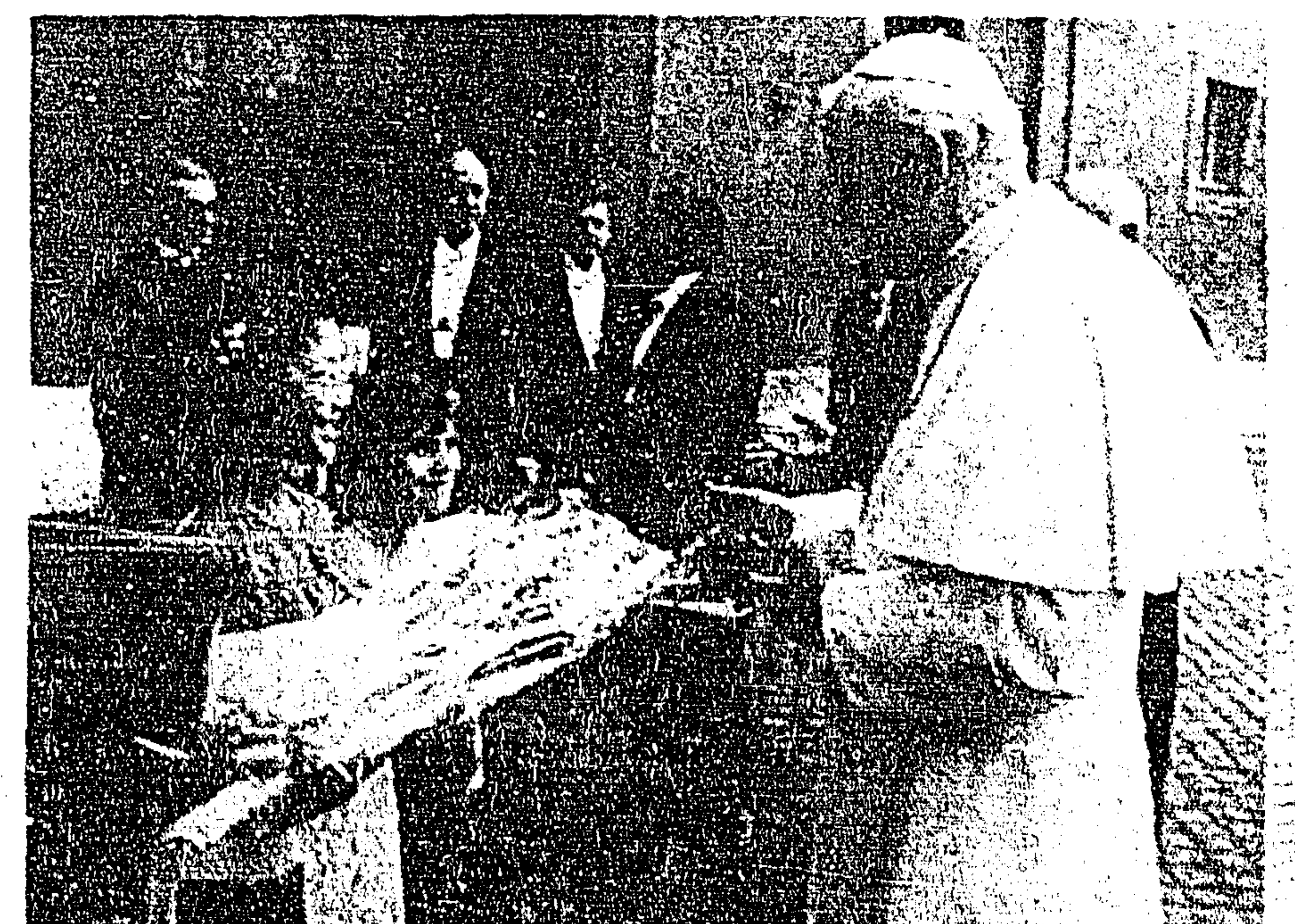
CIUDAD DEL VATICANO, Agosto 14 (UPI). — El Papa Juan Pablo II al llegar al Vaticano, recibió de manos de dos niños un ramo de flores. El Papa salió hoy del Hospital "Agostino Gemelli".

Por lo que se refiere a la retención del subsidio que ya lleva 45 días, indicaron que ello perjudica a 4 mil trabajadores universitarios que desde esa fecha no reciben salario por lo que la situación de sus familias se hace más difícil cada día.