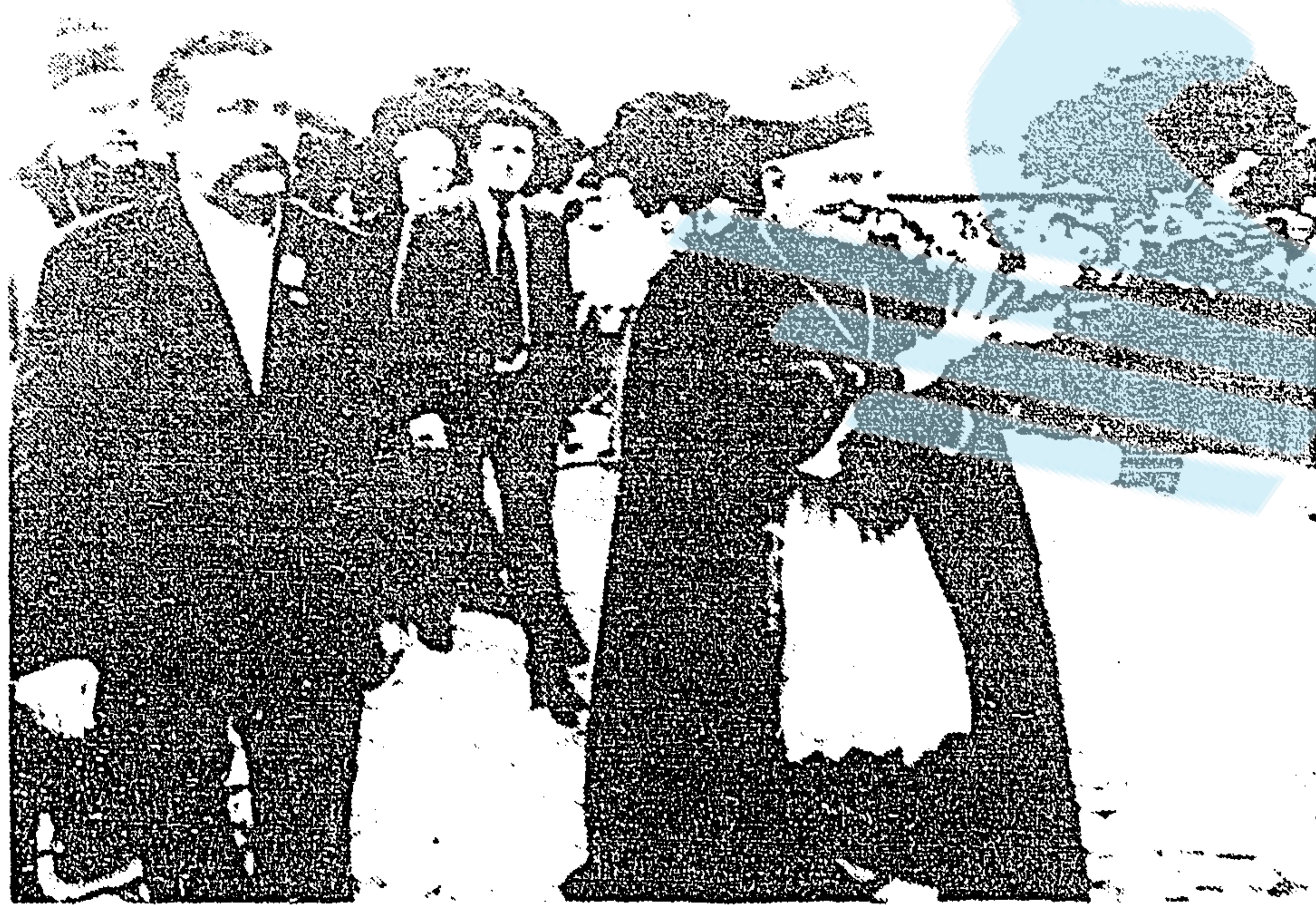
GDANSK, Polonia, 14 (AP). — El líder Lech Walesa (I) camina con el Obispo León Kaczmarek (D) y otros funcionarios este viernes, durante una ruidosa celebración por parte de los trabajadores polacos, en el primer aniversario del Sindicato Solidaridad. (LASERFOTO).