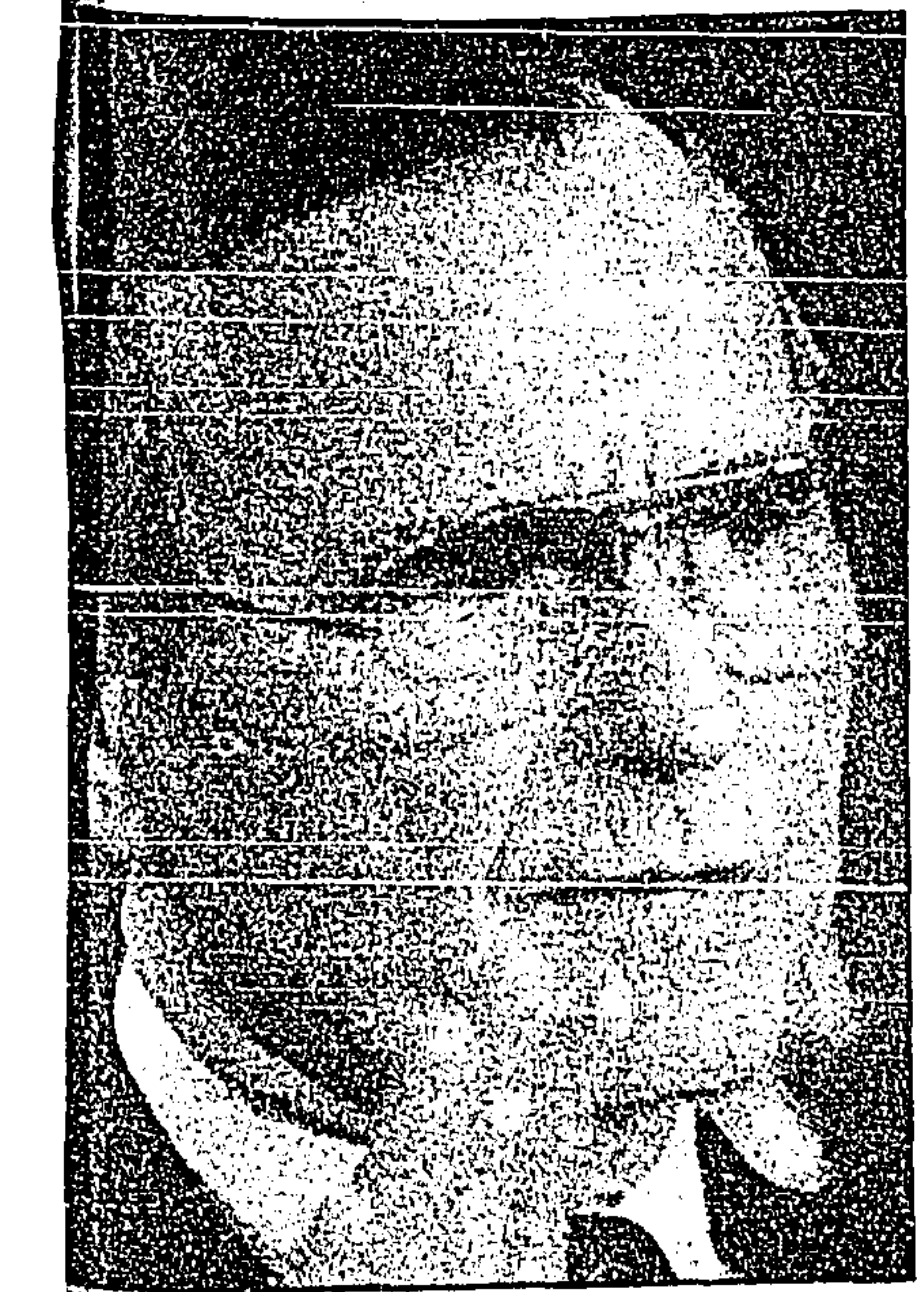
Bush: está cerca el día.

Al referirse a los aspectos de mantenimiento de la red eléctrica, argumenta que los recursos canalizados a este renglón han sido escasos y, por lo tanto, el programa de mejoramiento de la infraestructura se ha visto deteriorado.