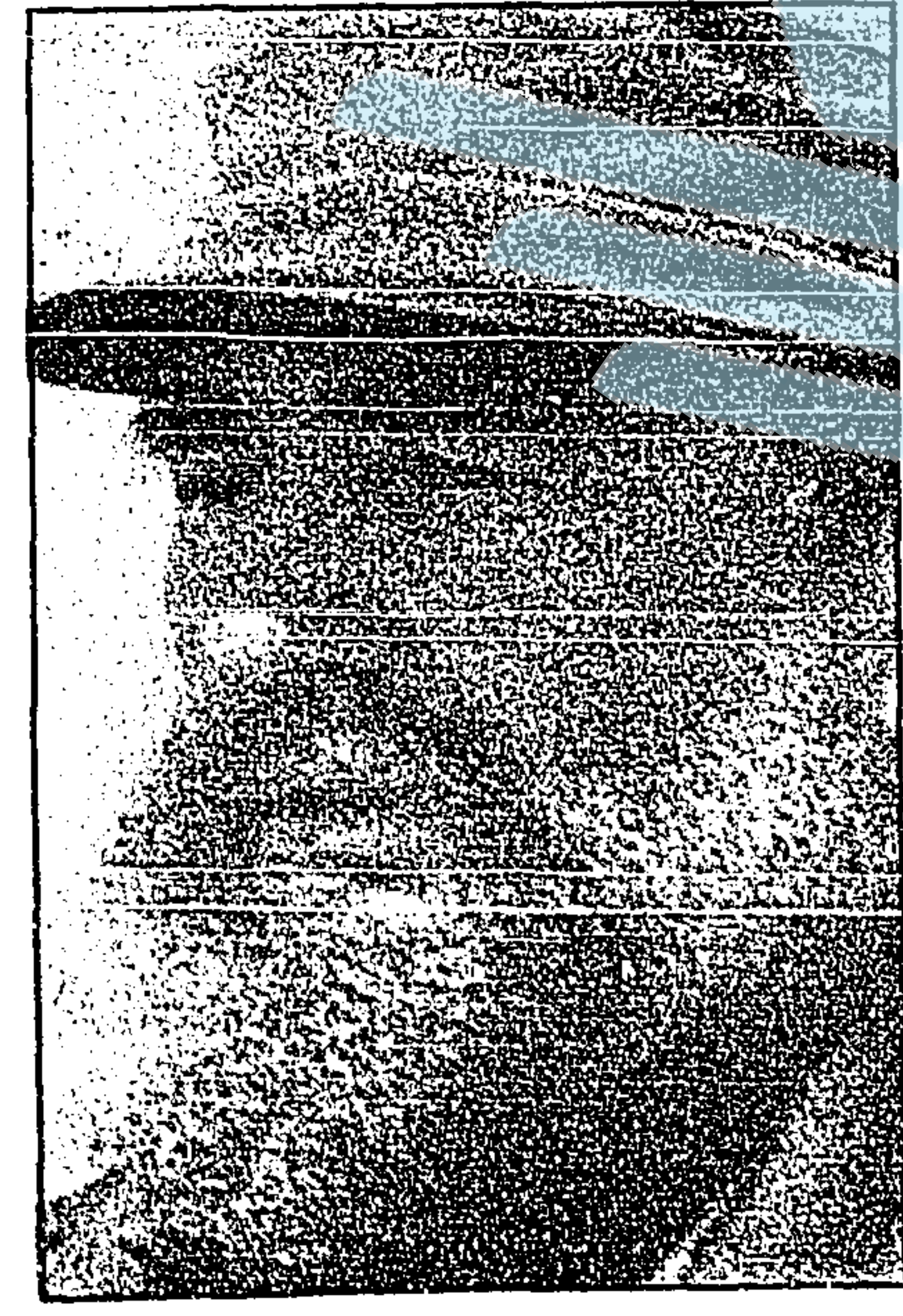
Doble embate contra Fidel.