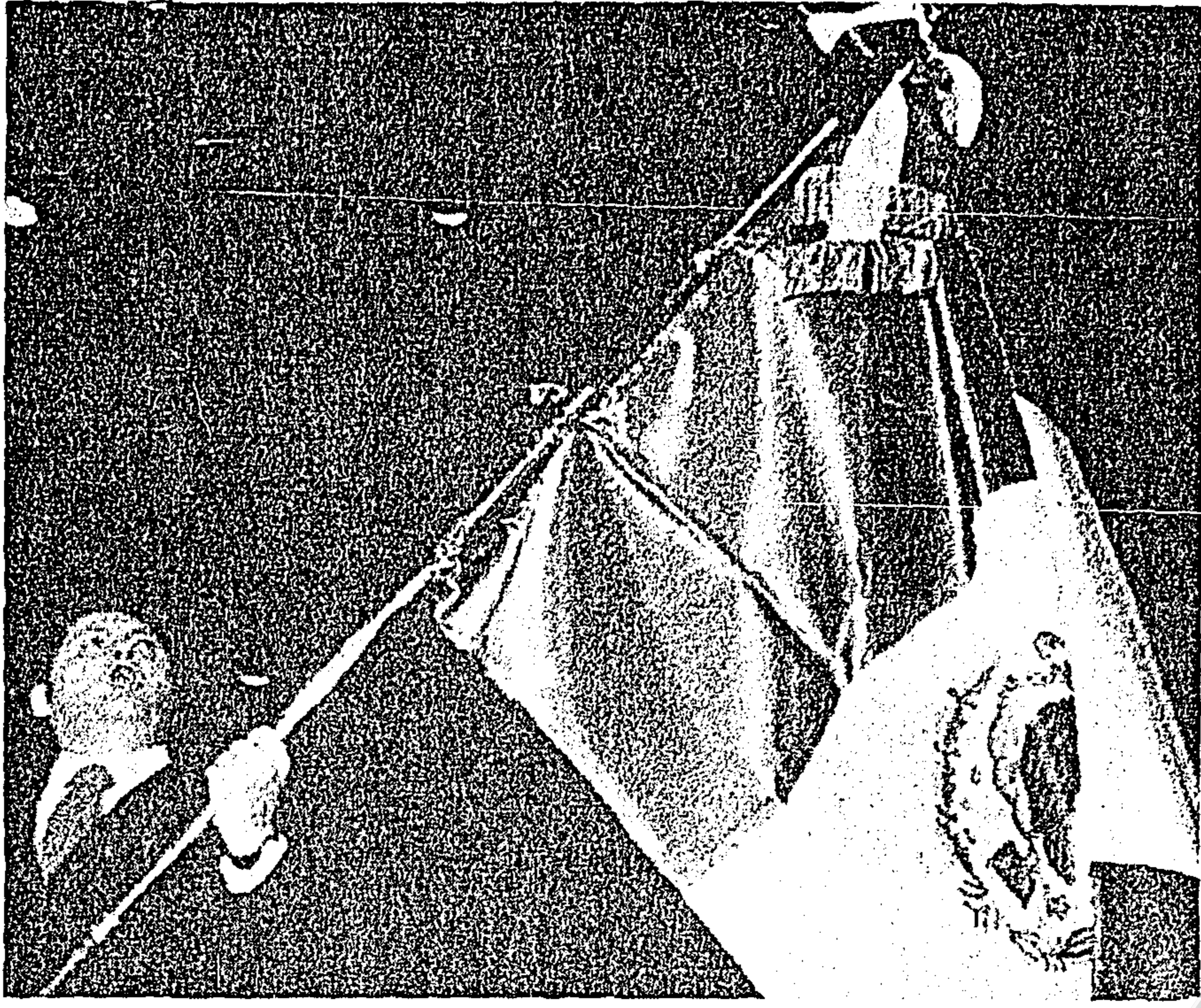
NUEVA YORK, 16 (AP).- El ministro de Gobierno de México, Mario Moya Palencia, en el 162 Aniversario de la gesta heroica mexicana. Hall este viernes en la noche en Nueva York, en el 162 Aniversario de la gesta heroica mexicana.