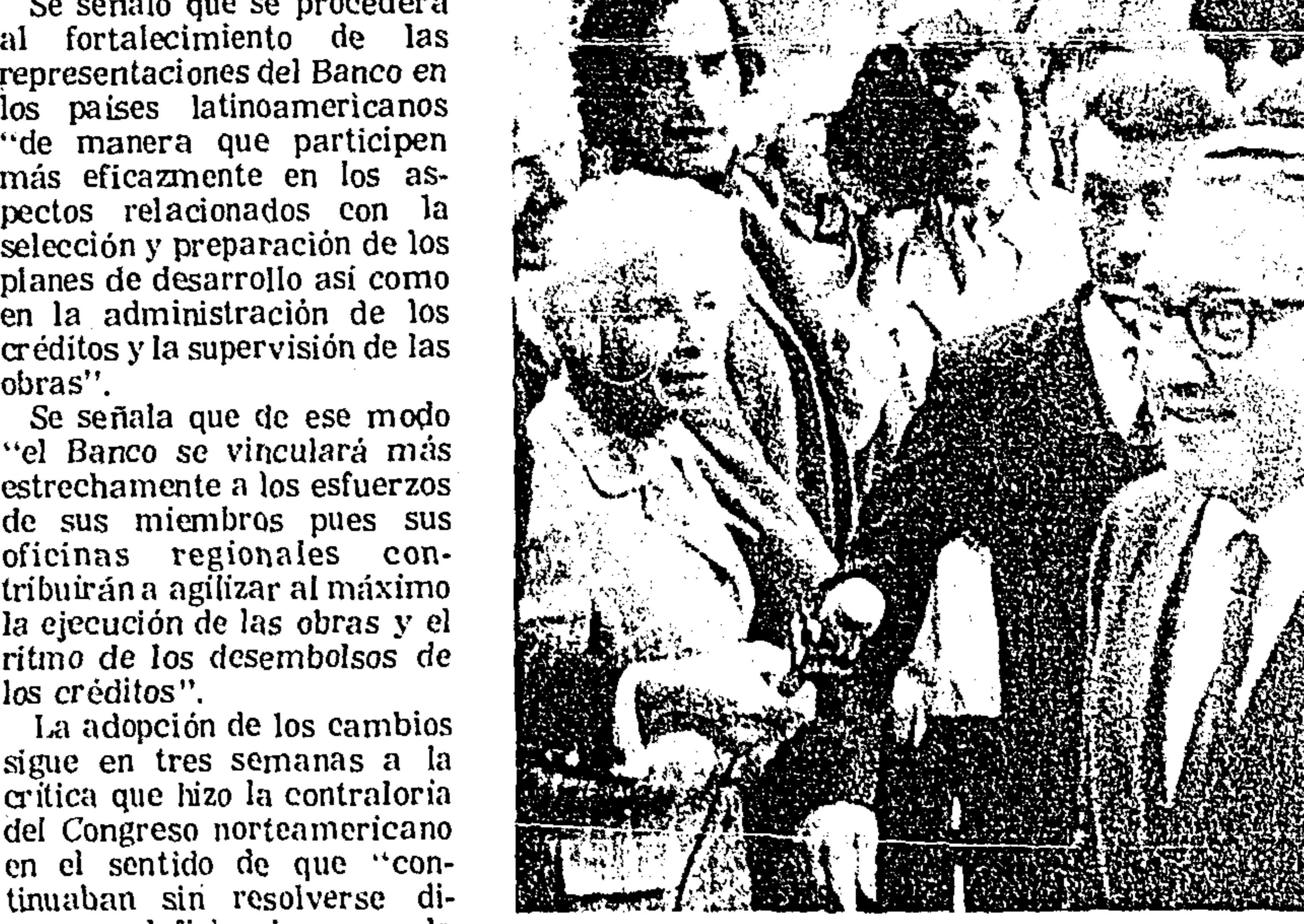
KISSINGER EN PARIS, Sept. 15.- TROTAMUNDOS.- El consejero presidencial Henry Kissinger, en los momentos en que llega al Palacio del Eliseo, en París, Francia, para sostener conversaciones con el Presidente de la República Francesa Georges Pompidou. Con anterioridad a esto, Kissinger sostuvo una reunión secreta con diplomáticos norvietnamitas, Le Duc Tho y Xuan Thuy.