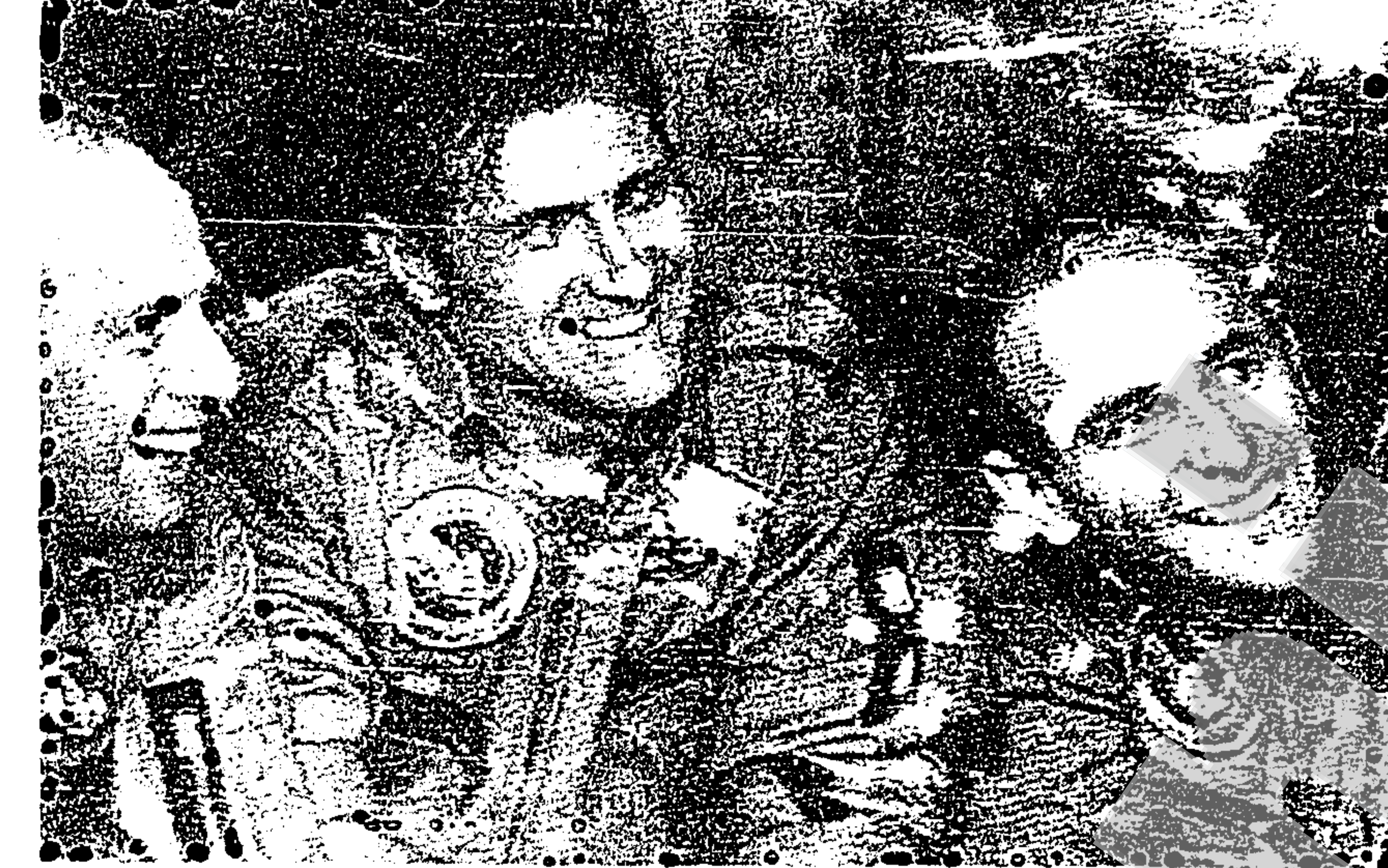
LOS ASTRONAUTAS reciben felicitación telefónica del Presidente norteamericano Richard Nixon por el éxito del Apolo 12. Los tres observan desde la unidad móvil de cuarentena. En las tres fotos, de derecha a izquierda, Charles Conrad, Richard Gordon y Alan Bean.