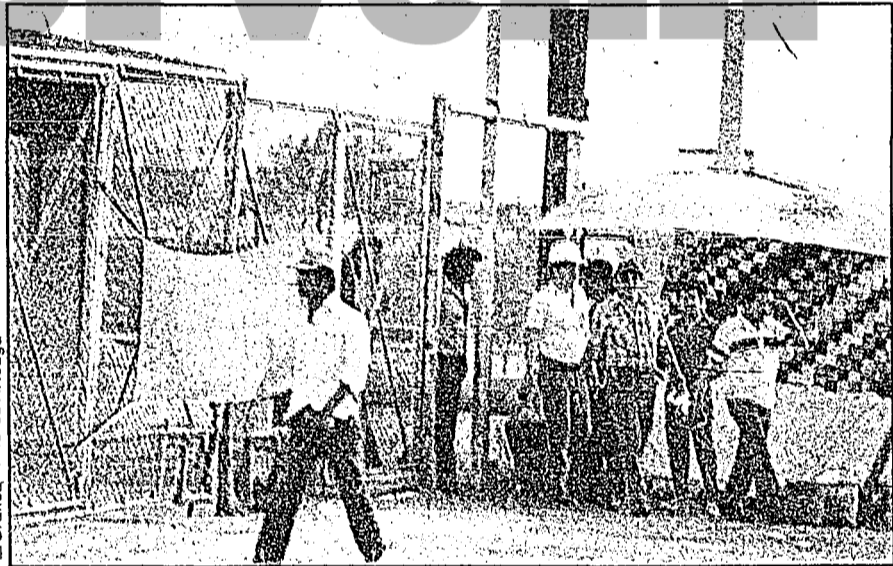
Los obreros de Ahmsa llevan dos días de huelga.