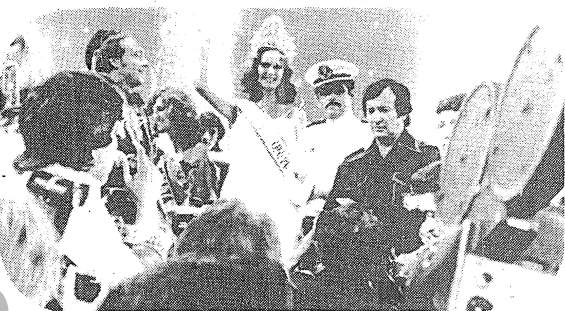
ACAPULCO, Gro., 24 (AP).- Margaret Gardiner, de ciudad del Cabo, Sudáfrica, ya coronada señorita Universo 1978, luce la corona del evento, en tanto camarógrafos y fotógrafos se aglomeran en torno a la