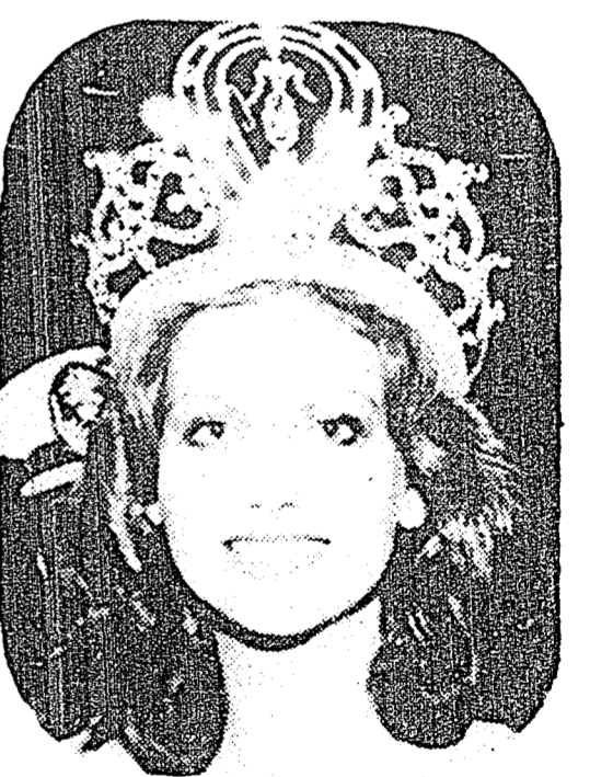
ACAPULCO, 24.- La nueva soberana, la Señorita Universo, Margaret Gardiner de Sudáfrica luce la corona del evento. (Información en la Pág. tres).