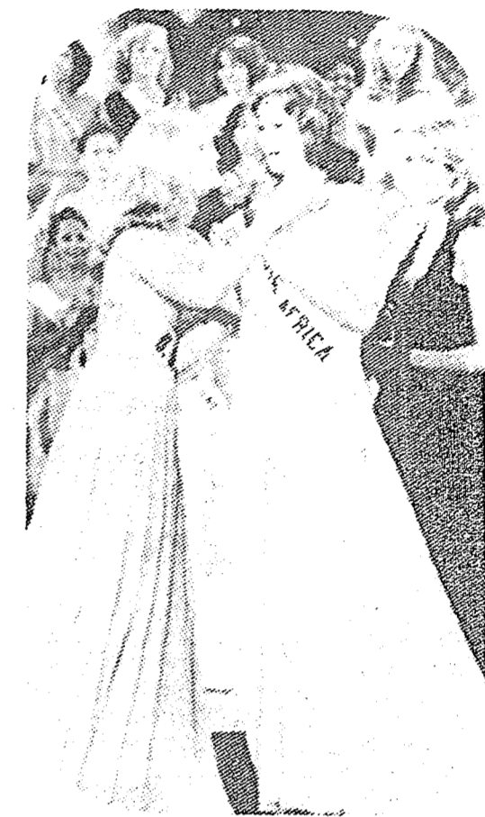
ACAPULCO, Gro., 24 (AP).- La señorita Sudáfrica en los instantes de conocer la elección a su favor, jubilosa recibe las felicitaciones de la señorita Estados Unidos. (TELEFOTO).

Torres Pancardo expresó que los obreros están dispuestos a continuar en su lucha por la Alianza para la Producción, pero que son los empresarios los que tienen la última palabra.