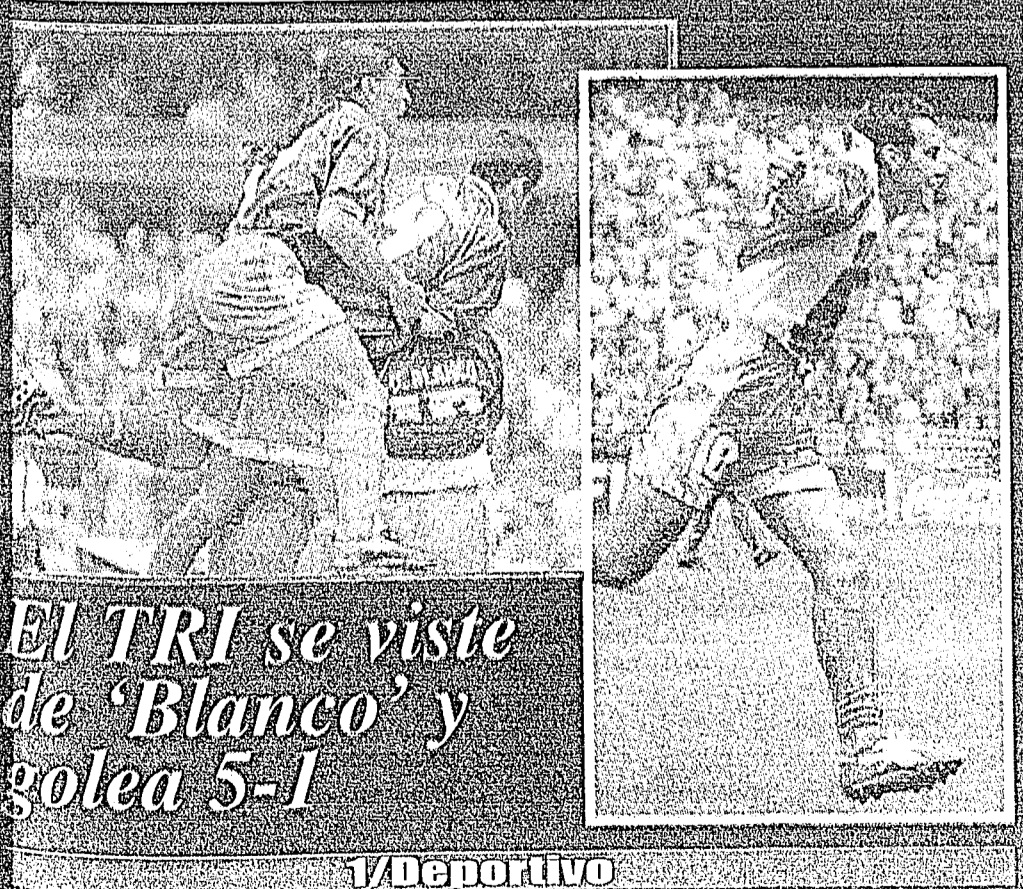
No perderá su registro.

candidatos a diputados locales, pre- sidentes municipales y regidores de esta entidad, González Fernández comentó que la Comisión de Fisco- lización determinó que en caso de que haya habido una donación por la transmisión de la empresa SKY, se le restará 30 por ciento del monto de los gastos de campaña. Sin embargo, en entrevista aclaró que no conoce físicamente el dicta- men porque es un asunto que no le compete a él, sino al Comité de Fiscalización al que se lo turnó la Comisión Nacional del Proceso In- terno; y se resolvió la no proceden- cia, por lo que el caso "ya se desa- hogó". Por separado, el cetemista Leo- nardo Rodríguez Alcaine, vocal de la Comisión Nacional para el Pro- ceso Interno, explicó sobre esa de- nuncia que "ésta fue una transmis- ión que la hizo como obsequio una televisora para probar el satélite y posteriormente hacer negocio con quien lo desee". ¿Quién les dijo a ustedes que fue una televisora (SKY) la que obse- quió la transmisión?, se le pregun- tó, y respondió: "En el momento en que Madrazo presentó la denuncia, inmediatamente el presidente de la Comisión Nacional se abocó a ver de qué se trataba y por eso puedo decir que es una cosa que obsequió la televisora como prueba para ha- cer negocio después". Dijo por ello que Labastida O- choa no tiene por qué perder su re- gistro como precandidato.