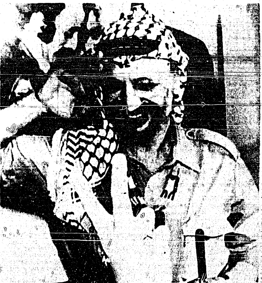
BEIRUT, Líbano, 30 (AP).-Yasser Arafat, líder de la OLP hace un saludo marcial luego de haber recibido a los reporteros. Arafat después se dirigirá al puerto de Beirut y de allí a un lugar desconocido que no ha sido revelado. (LASERFOTO)