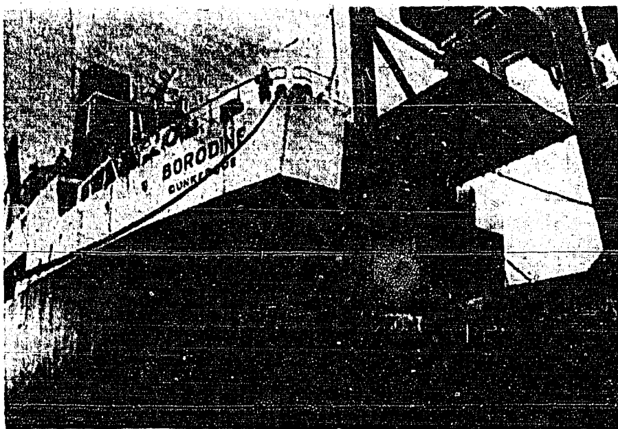
RIGA, Letonia, 30 (UPI).-El buque francés Borodine que llegó aquí con compresores para el gasoducto Euro-Siberiano, empezó a descargar dicho equipo que ha sido motivo de una controversia entre E.E.UU. y Francia.

Puede ser el Camino a un Reencuentro y Reajuste