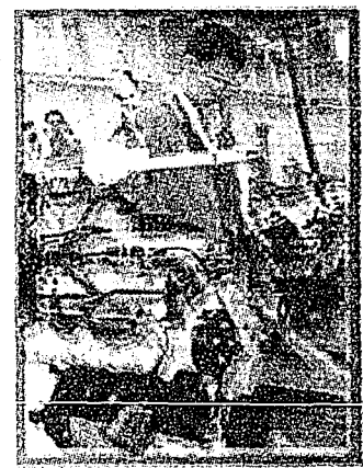
Queda México en tercer lugar.