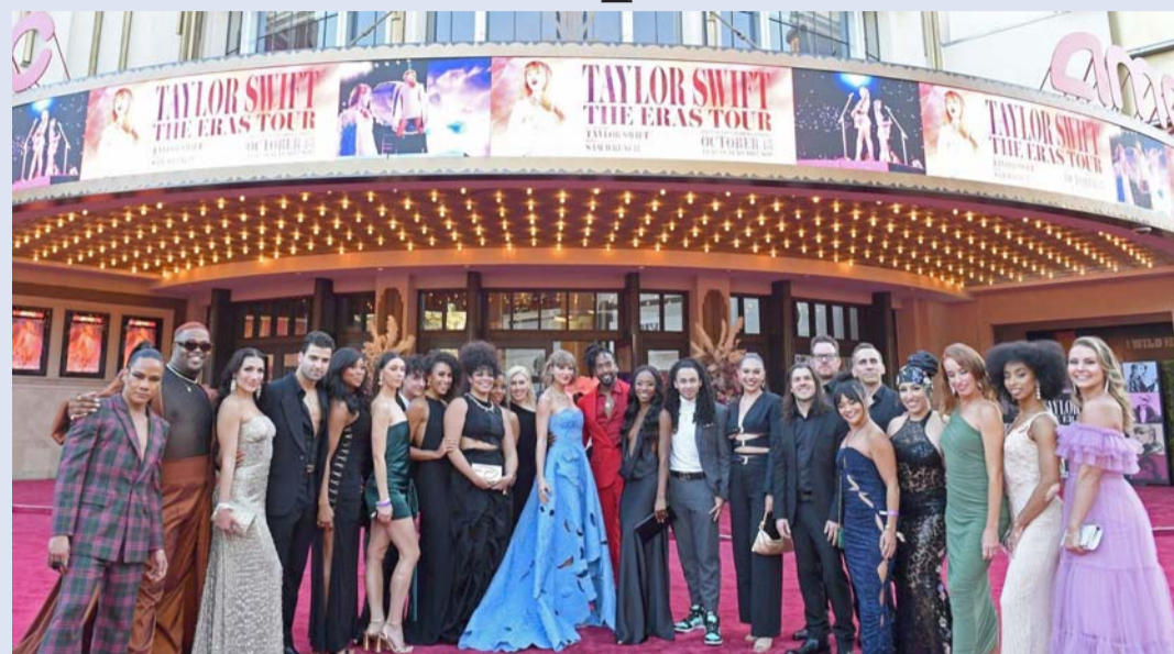
La cantante adelanta la premier de su película por la gran demanda de los fans, explicó.