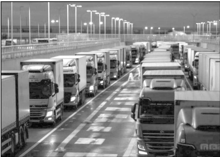
Con la reapertura de la aduana Córdova-Américas se llevaron a cabo 343 cruces sólo el martes pasado.

primero de octubre y concluirá el próximo 15, una vez que se vote el presidente tomará posesión el 1 de enero de 2024. Medina Mora —fundador y presidente del Consejo de Administración de CompuSoluciones, una empresa mayorista Integrador de soluciones de Tecnología de Información y Comunicaciones— llegó a la Coparmex en enero de 2021 y de acuerdo a los estatutos de la Coparmex puede reelegirse por cuatro periodos.