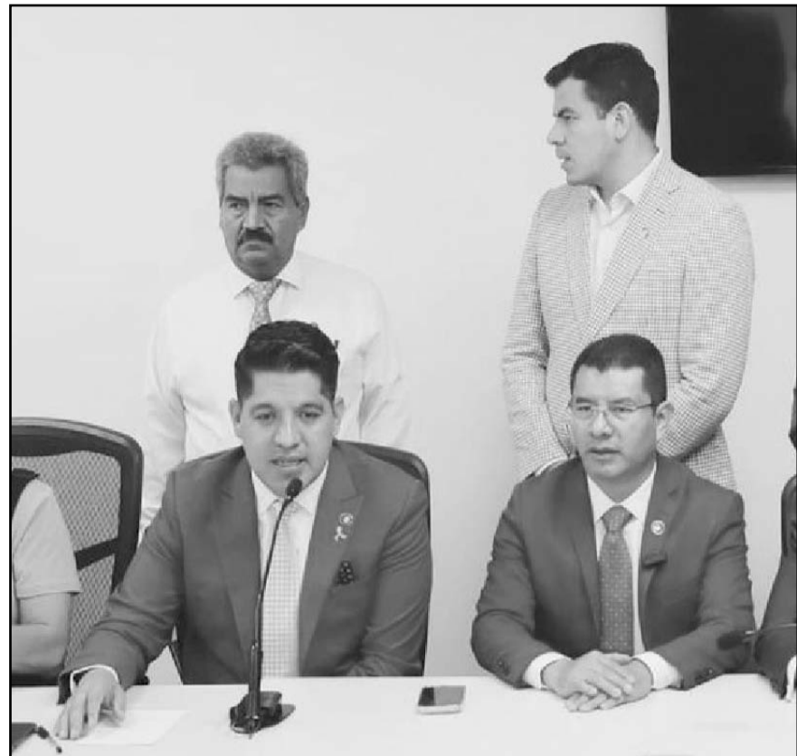
Detallaron que propondrán incrementar en tres dólares el precio del barril de petróleo establecido en los criterios generales.

"Necesitamos una institución duradera, no una institución de paso. Necesitamos la disciplina, la organización que hoy mantienen las Fuerzas Armadas", enfatizó.