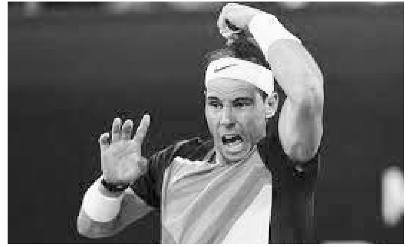
Rafael Nadal dejará atrás la lesión.

Ahora Pérez volverá a correr en la Fórmula 1 cuando el próximo 22 de octubre pueda correr en el Gran Premio de los Estados Unidos.