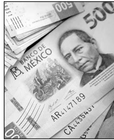
El FMI dio el pronóstico.

Ciudad de México.- La deuda pública de México superará el 50 por ciento del producto interno bruto (PIB) entrará la segunda mitad del próximo sexenio, pese a que se espera que la siguiente administración reduzca en más de la mitad el déficit público con el que concluirá el gobierno de Andrés Manuel López Obrador, prevé el Fondo Monetario Internacional (FMI). En su Monitor Fiscal el organismo calcula que la deuda pública, en 2023 y 2024 ajustada por el FMI a lo presentado por la Secretaría de Hacienda y Crédito Público en los Criterios General de Política Económica, continúe con una trayectoria ascendente hasta llegar a 50.2 por ciento del PIB en 2028, ya en la segunda mitad de la próxima administración. Esto pese a que, en línea con lo publicado por Hacienda, el organismo parte de que la próxima administración realizará un ajuste fiscal de más de tres puntos porcentuales del PIB. Al pasar de 5.7 a 2.7 por ciento el déficit público. No obstante, partiendo de que este ajuste fiscal se mantenga, la deuda seguirá creciendo. La actual administración, en palabras del secretario de Hacienda y Crédito Público, ha dicho que el manejo de la deuda es sostenible y se procurará que en