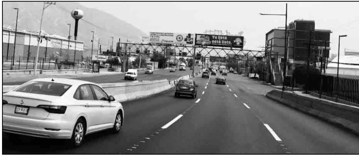
Se siguen mejorando las vialidades en el municipio, con el fin de tener una mejor movilidad.