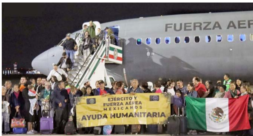
Gimnastas y connacionales fueron recibidos así en la capital del país.

Primero fue el preparador físico de ese club desde noviembre del 2012 hasta diciembre del 2015, tiempo en el que también fungió en ese lugar como un "Performance Manager".