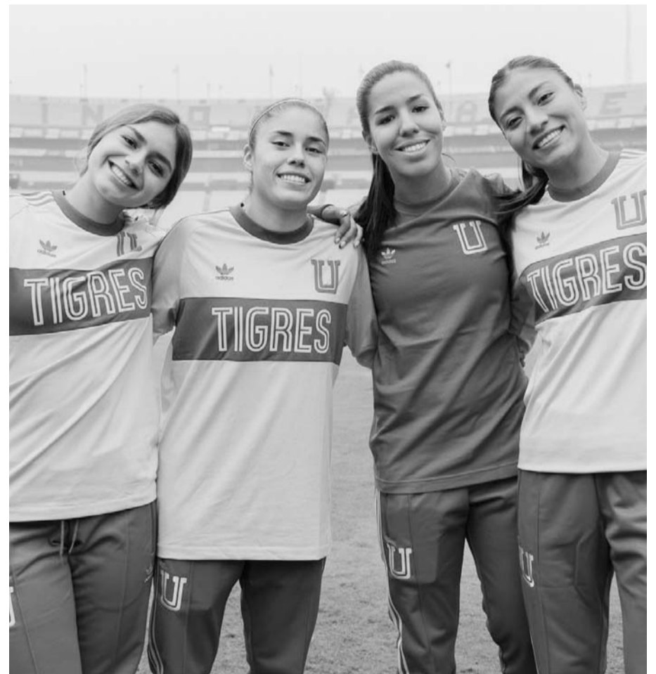
Las felinas se enfrentan al Cruz Azul.

Las 'Amazonas' son favoritas en este partido para ganar y mantenerse una jornada más en la cima de la Liga MX Femenil, pero Cruz Azul está a un punto de la zona de Liguilla y tras ello este día intentarán vender cara una posible derrota en la cancha del 'Volcán', motivo por el cual hoy se espera un gran partido entre felinas y celestes, aunque también una victoria de las locales para que se mantengan en lo más alto de la temporada. (AC)