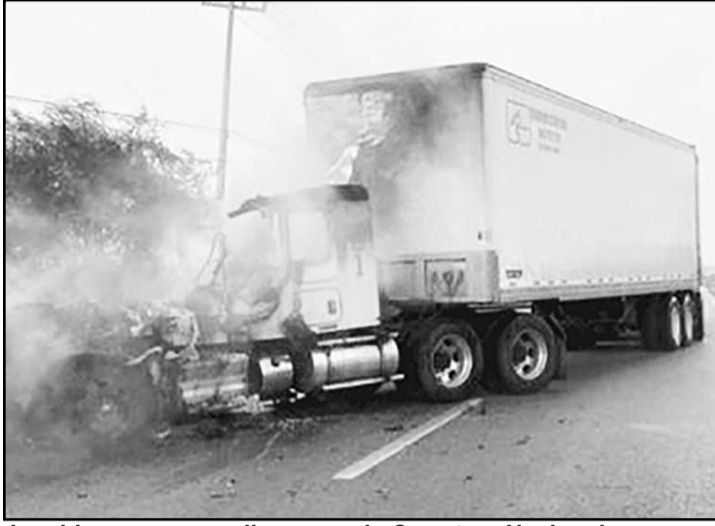
Los bloqueos se realizaron en la Carretera Nacional.

Según las declaraciones del Secretario de Seguridad, la