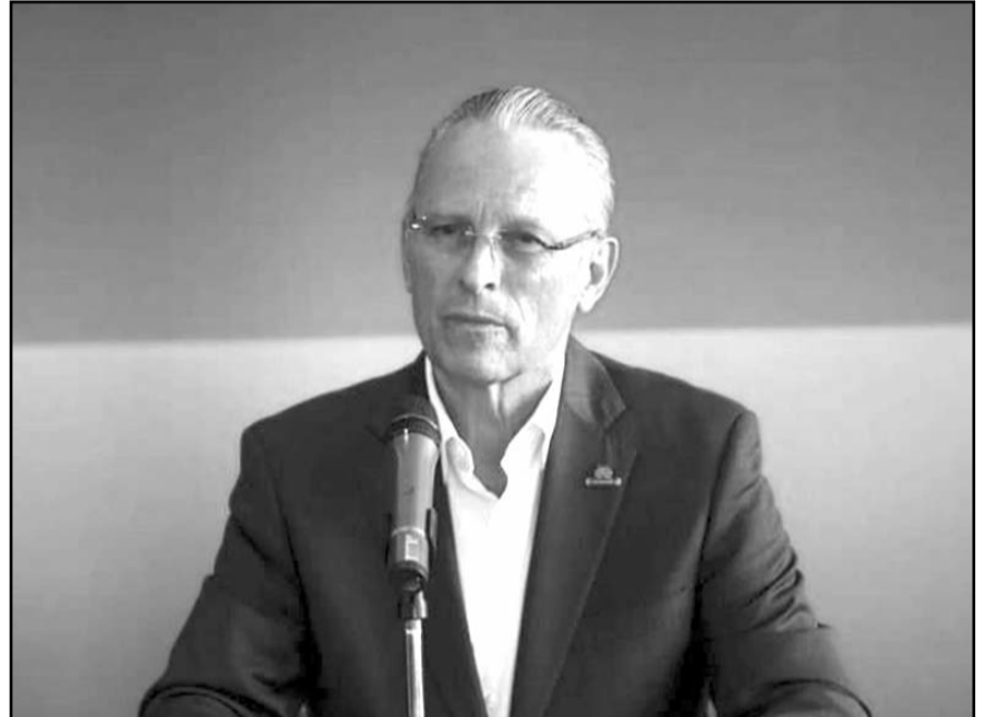
José Medina Mora, presentó su candidatura para dirigir ese organismo por un cuarto periodo.

como a pequeñas y medianas empresas ligadas a la industria automotriz y proveedoras de servicios. Esas revisiones a los camiones de las condiciones físico-mecánicas generaron un rezago en el cruce de camiones de 20 mil unidades que transportaban una carga con valor de 2 mil millones de dólares. El vicepresidente de la Cámara Nacional del Autotransporte de Carga (Canacar) Norte, Manuel Sotelo, advirtió que con la apertura de la aduana Córdova-Américas no se terminará con el rezago del cruce. "No creo que alcance a poder subsanar todo el rezago que hay, creo que nos va a tomar unas semanas que vuelva a la normalidad... va a tardar tiempo en recuperarnos", aceptó.