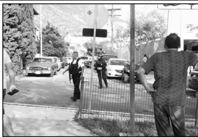
El enfrentamiento ocurrió entre grupos criminales.

Los hechos desataron un enfrentamiento que duró varios minutos.