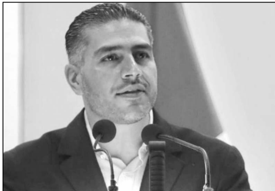
Fuentes señalaron que respondió a los cuestionamientos de la defensa de 12 de los presuntos responsables de su agresión.

Señalaron que este no debía ser tomado en cuenta pues realizó su declaración cuando aún estaba hospitalizado.