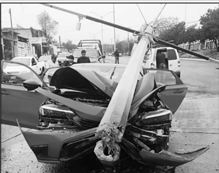
Colonia Plutarco Elías Calles, en Monterrey.