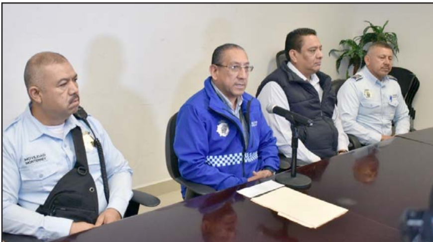
Las autoridades esperan que lleguen a la Basílica más de mil.