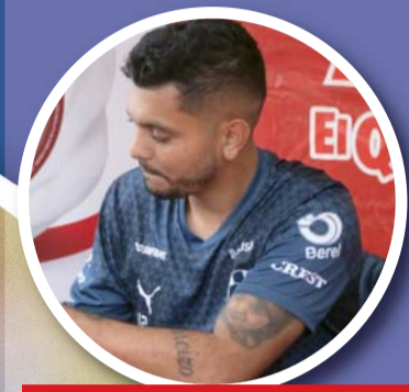
Jesús Manuel Corona Recientemente lesionado Status actual: imposibilitado