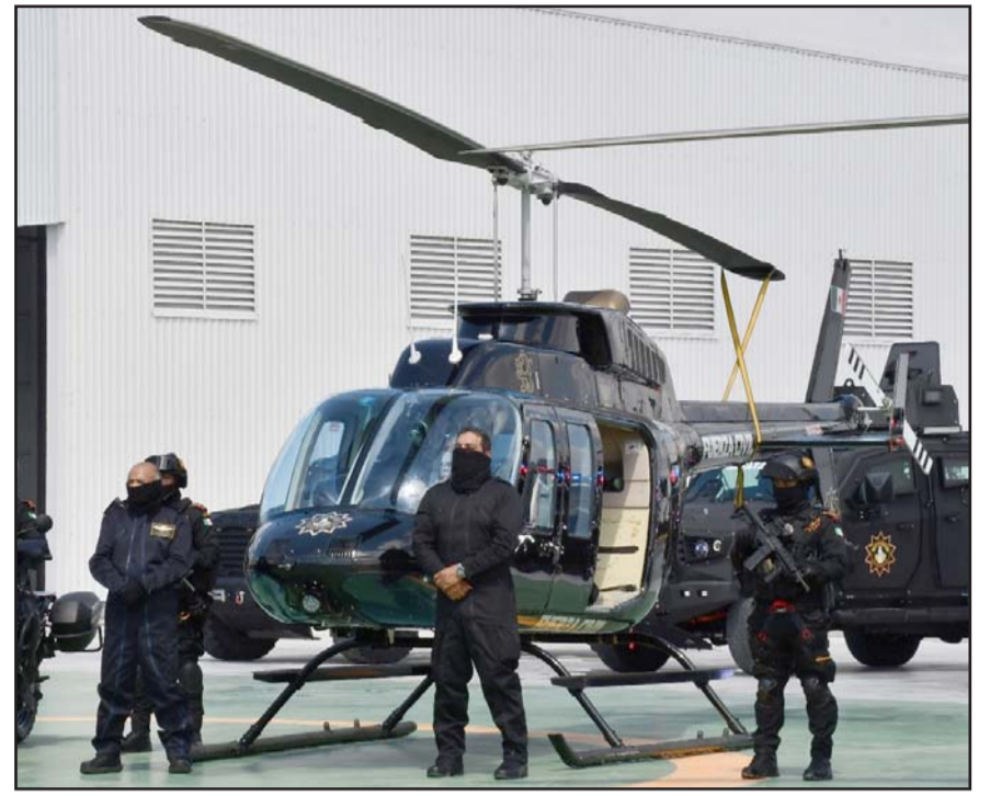
La idea es blindar la entidad y proteger a la ciudadanía, sobre todo después del ataque en el que un elemento de la Policía de Abasolo perdió la vida.

“Esos logros que comúnmente se los enumeran al gobernador o al Gobierno del estado, en realidad son gracias al