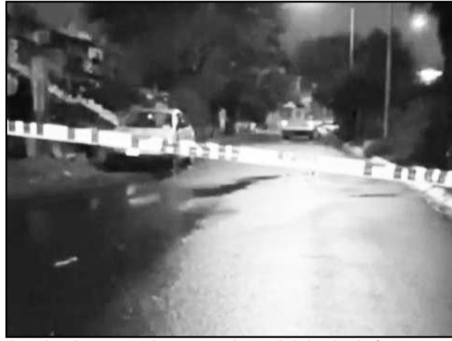
Los hechos ocurrieron en el municipio de Juárez.

Tras la agresión, diversos habitantes del sector comunicaron lo sucedido a las autoridades y al lugar arribaron elementos de