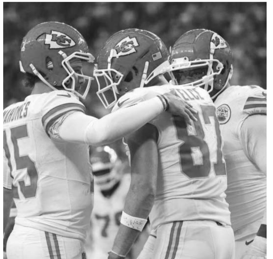
Los Jefes se miden a Denver.

Fuerza Regia de Monterrey buscará esta noche y también el día de mañana ese hecho de mantenerse en la cima de la temporada regular en la Liga Nacional de Baloncesto Profesional de México.