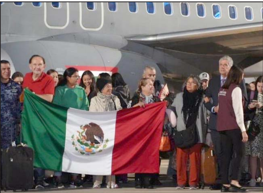
En total, han sido 287 los connacionales que arribaron al país en dos aviones de la Fuerza Aérea Mexicana tras ser rescatados del conflicto en Israel.

La operación de repatriación fue encabezada por mujeres integrantes de la Sedena, marcando un hito en el rescate de los mexicanos en la zona de conflicto en Medio Oriente.