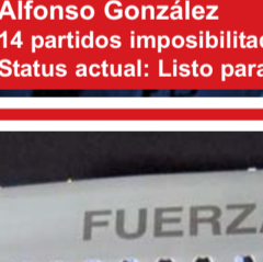
Alfonso González 14 partidos imposibilitado Status actual: Listo para jugar