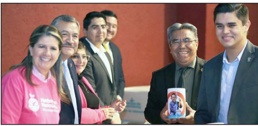
Se hará una recolección de alimentos y aportaciones monetarias.

Según cifras de la Fiscalía General de Justicia del Estado, en comparación con los periodos de enero-agosto de los años 2022 y 2023, el delito de robo a casa habitación disminuyó un 58 por ciento.