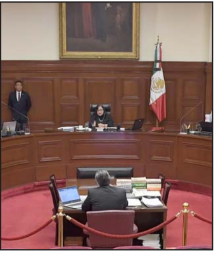
Asegura que ninguno beneficia a los ministros.