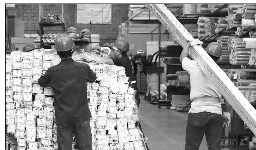
Las empresas interesadas podrán hacer la deducción acelerada de inversiones, que varía de 56% a 89% en 2023 y 2024.