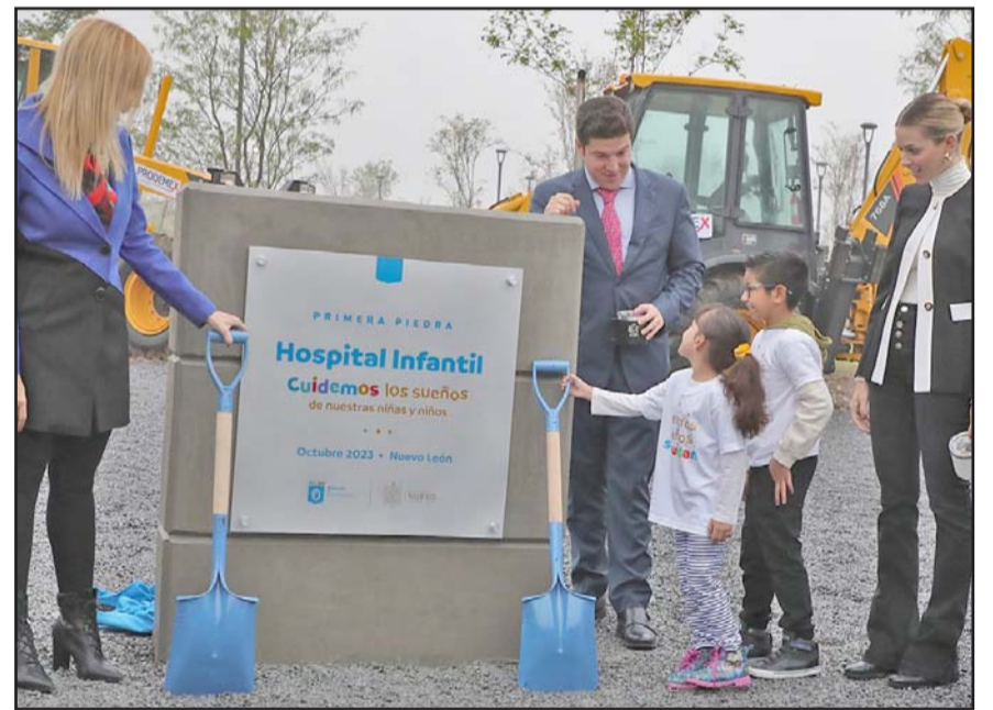
Estará ubicado en los terrenos del extinto penal del Topo Chico.

“Se soñó con un con un hospital que fuese amigable, que tuviese también el acceso, la accesibilidad para los niños, terapias con mascotas, que pudiese tener estrategias innovadoras para la intervención y el tratamiento de ellos”, añadió.