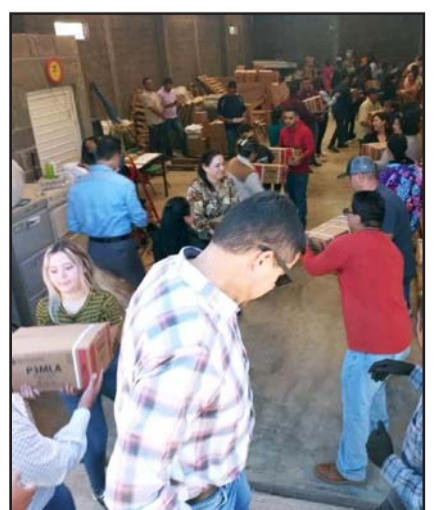
Amagan con parar labores si no se resuelven amparos para distribuir el material educativo en Chihuahua.