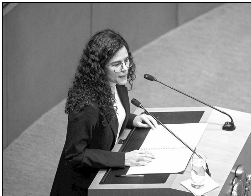
La titular de la Segob fue cuestionada duramente por la oposición.

Nacional Kenia López Rabadán mostró desde su escaño una pancarta con la fotografía de una joven Luisa María Alcalde, entonces activista, exigiendo justicia para los normalistas desaparecidos en Ayotzinapa.