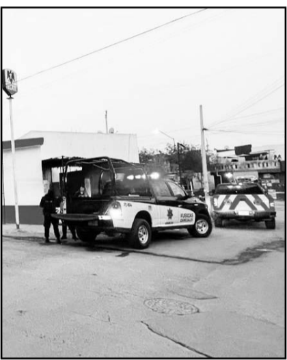
Fue en el municipio de García.

Se les solicitó una revisión precautoria a sus pertenencias, cuyo resultado fue el decomiso del vehículo, además de diversas dosis de presunta droga, una báscula digital, una bandolera y dinero en efectivo.