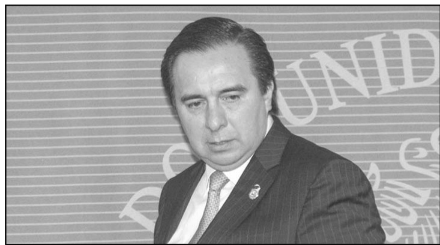
Alejandro Encinas aseguró que por parte de México el proceso ya está avanzado.