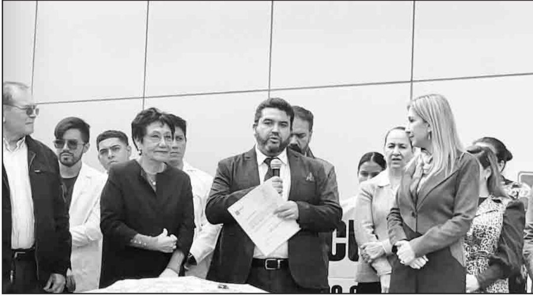
Por mutuo acuerdo entre las autoridades estatales y la organización Tierra y Libertad se designó