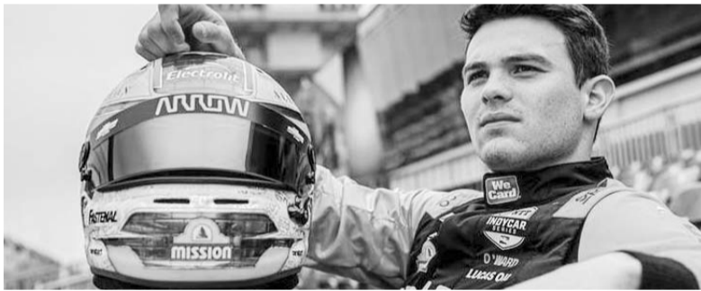
El regio usará el coche de McLaren del 2021 que en su momento pilotó Daniel Ricciardo.