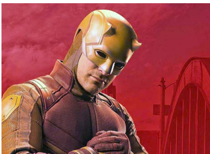
No estaban contentos con los resultados del show.

Se presume que "Daredevil: Born Again" estrene en algún punto del próximo año.