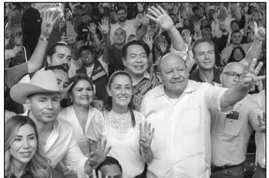
Claudia Sheinbaum dijo que lo más importante es el proyecto de la Cuarta Transformación, ya que de lo contrario "no nos va a ir bien".

"Según lo que me dice la Comisión, el equipo de Marcelo Ebrard tendrá tres días para manifestar lo que a su derecho convenga sobre el contenido de estos informes y siga el proceso de desahogo de la impugnación", finalizó Delgado.