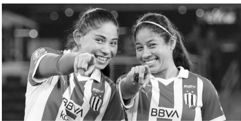
Las albiazules visitan a San Luis.

Tigres viajarán hoy a Houston y harán el reconocimiento de cancha en el Shell Energy Stadium, en donde enfrentarán a Rayados el próximo sábado a las 16:00 horas. (AC)