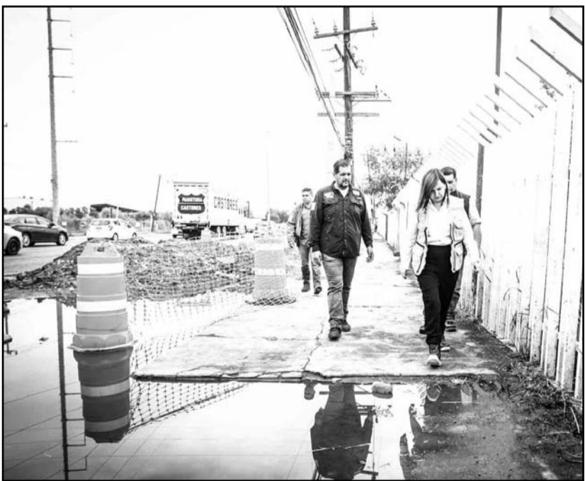
La alcaldesa prometió que quedarán listas antes de que termine el año.

bajar el cableado, evitando este tipo de accidentes, ganando en belleza y accesibilidad de la banqueta". Destacó que la banqueta puede ampliarse y se le puede dar el carácter de accesibilidad universal para que cualquier persona se pueda mover en la medida que no haya interferencia de postes deteniendo cableado.(ATT)