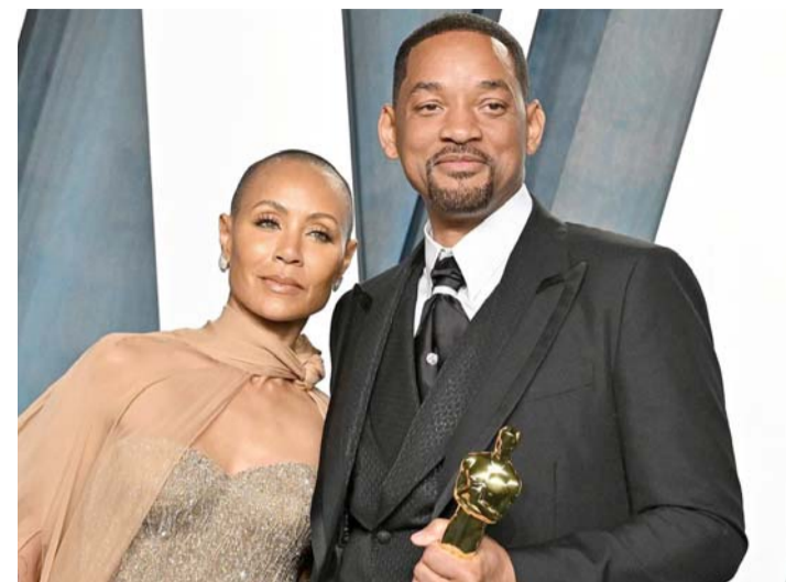
La revelación fue dada a conocer a través de las memorias de la actriz, en un libro llamado "Worthy".