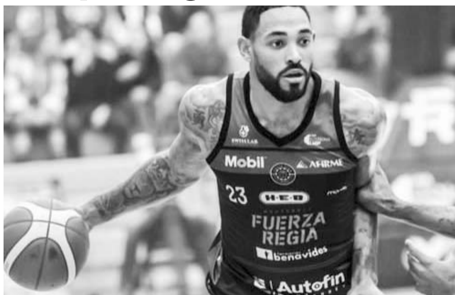
La quinteta regia jugará esta noche en Zacatecas.