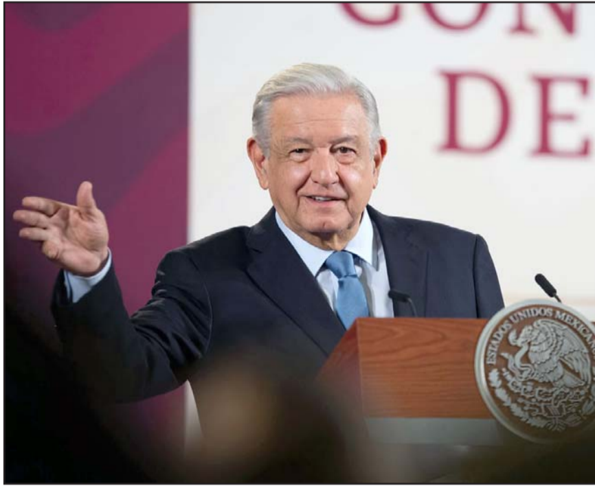
'Hay un enojo y están también desinformando', planteó López Obrador.

"Hay enojo y están también desinformando, hablando de que se van a quedar los trabajadores del Poder Judicial sin sus prestaciones, no; si el Poder Legislativo suspende, cancela estos fideicomisos, no se afecta en nada a los trabajadores. Eso también para que lo conozcan todos los trabajadores del Poder Judicial, son los privilegios de los de arriba, que un ministro en México gana hasta 700 mil pesos mensuales si se suma todo lo que obtie-