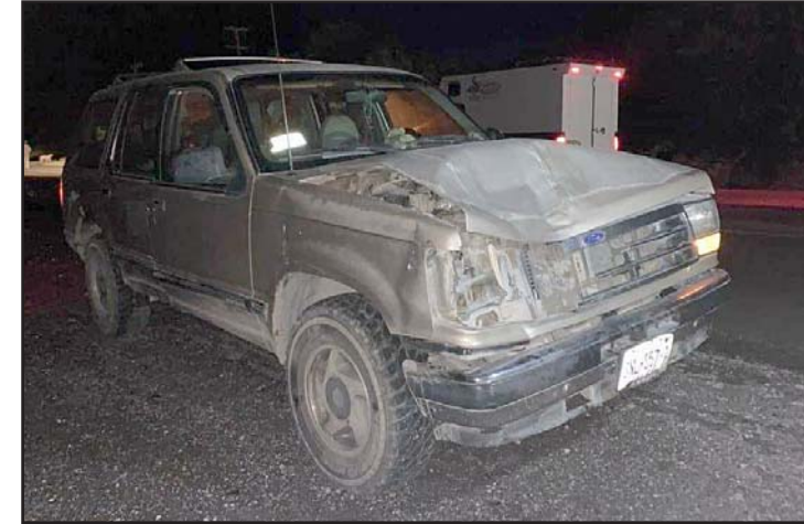
Los ocupantes sólo presentaban lesiones leves.

Se indicó que en ese momento se desplazaban por los car-