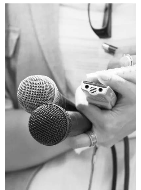
Celebra la Sociedad Interamericana de Prensa su 79 Asamblea General.

Indicó que la región latinoamericana es muy desigual, donde al parecer masas muy pobres atienden mejor los discursos de la demagogia del populismo.