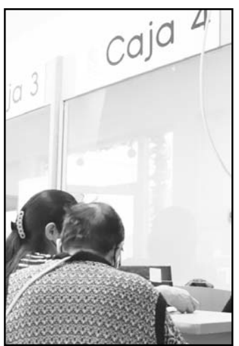
Hoy se reanuda los pagos.

Y es que por instrucciones del área de la Secretaría de Bienestar el pago de pensiones y programas del bimestre noviembre-diciembre siguen de manera habitu-