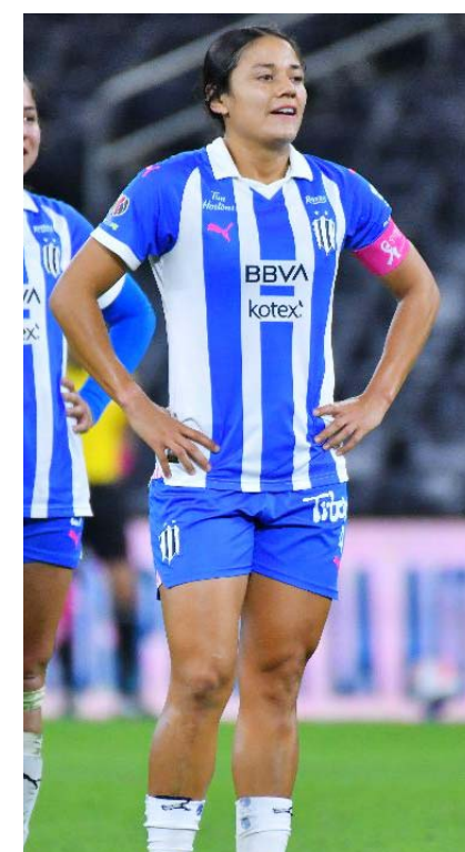
Monterrey recibe a Tijuana.