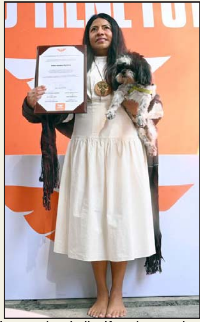
La senadora Indira Kempis se registró también como precandidata.

La senadora destacó a las madres buscadoras, los trabajadores del campo y comunidades de pueblos originarios y a la libertad de expresión.