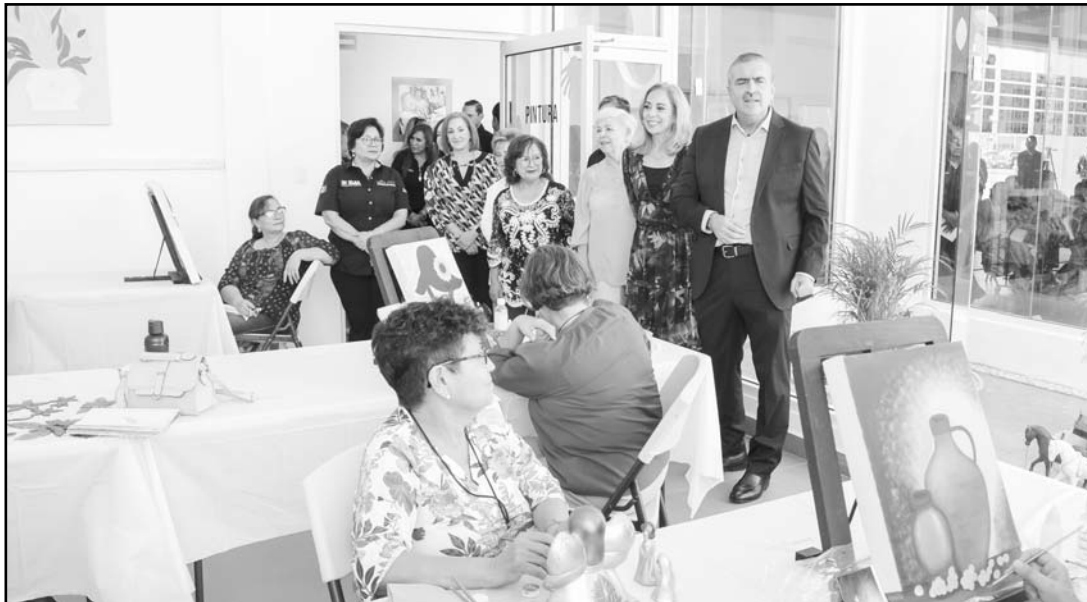
El presidente municipal de Apodaca, hizo un recorrido por las instalaciones.