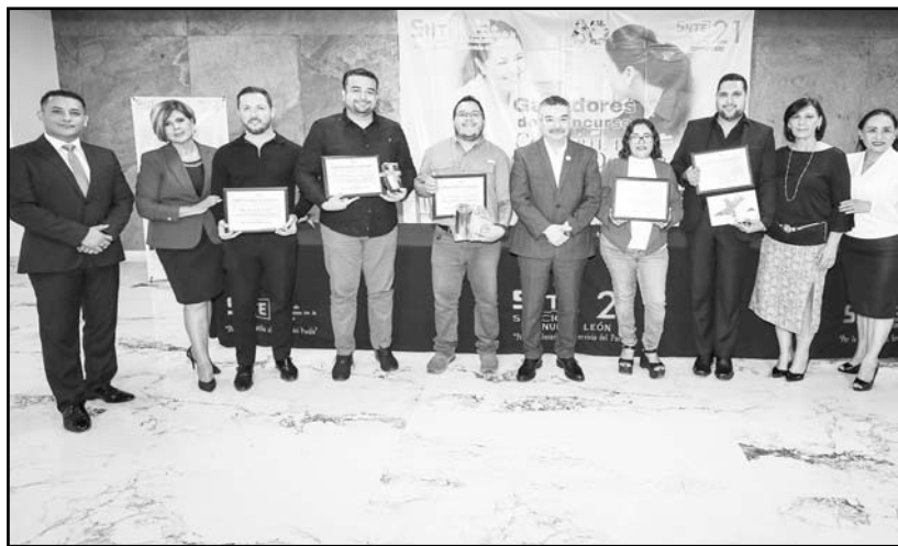
Fueron dos convocatorias las que se lanzaron y se premiaron.

En cumplimiento con la convocatoria del certamen nacional, Comparte tu Experiencia Docente todas y todos a la Escuela, Buenas Prácticas e Innovación en la docencia, emitida por el Sindicato Nacional de Trabajadores de la Educación, la Sección 21 del Sindicato Nacional de Trabajadores de la Educación realizó la ceremonia de premiación a los ganadores.