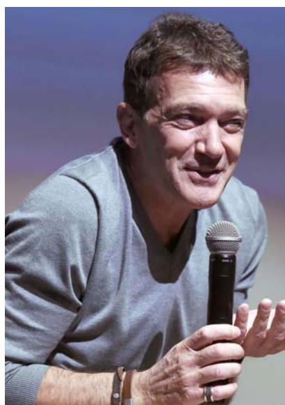
La entrega será en los premios Latin Grammy este jueves.

La velada se llevará a cabo en el Palacio de Congresos y Exposiciones FIBES, en Sevilla, España. Desde allí se podrá ver a Antonio Banderas recibir este importante premio ya que es destacado principalmente como pro-