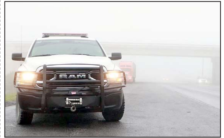
Desconocen el paradero del o los tripulantes.

Más tarde arribó el personal del Instituto de Criminalística y Servicios Periciales.