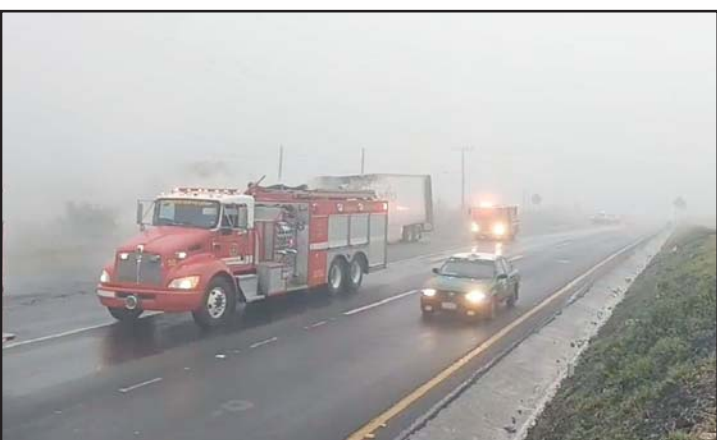
Fue a la altura del Ejido Rinconada.