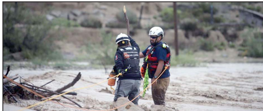
Los escurrimientos provocaron que varios cruces en arroyos fueran cerrados.

El respaldo de Jesús Nava Rivera a Samuel García Sepúlveda se dio este domingo luego de que el gobernador con licencia fuera a la sede de Movimiento Ciudadano en la Ciudad de México a registrarse como candi-