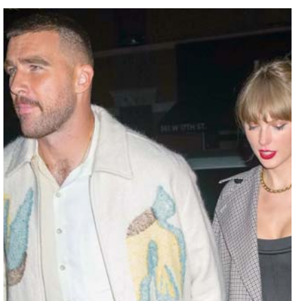
Taylor Swift y Travis Kelce.

Antonio Banderas recibirá este premio como un nuevo hito en su carrera y exitosa trayectoria que lo tiene como un destacado actor y cineasta. Su carrera la inició en el mundo del teatro y luego trasladó su talento al cine, principalmente, de la mano del mítico director Pedro Almodóvar. Actualmente, tiene 63 años de edad y se mantiene activo en este rubro y además como un gran empresario con su línea de perfumes.