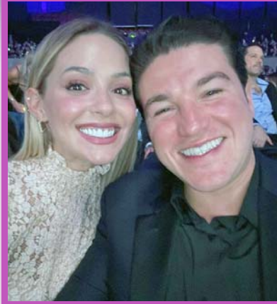
El gobernador y su esposa acudieron al show de 'El Sol de México' en donde entonaron sus éxitos y lo compartieron en redes sociales.