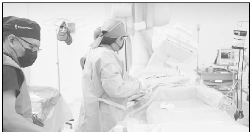
Se hizo una importante inversión y está en el Hospital de la Sección 50.

Lo anterior con la finalidad de reconocer las áreas de oportunidad que permiten mejorar y atender las demandas de los agremiados y sus familias, principalmente ésta nueva sala de Hemodinamia, a la vanguardia de las instituciones de salud del país.