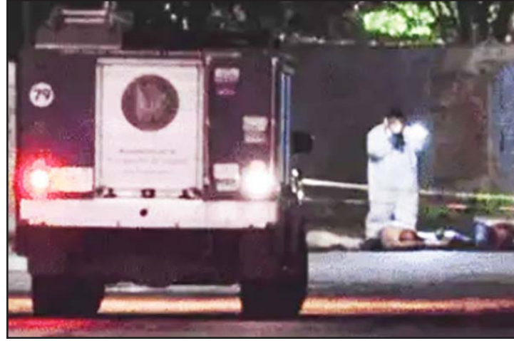
Los hechos se registraron en el sector San Bernabé.