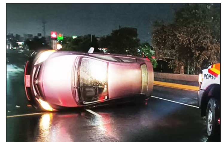
El accidente fue en la Avenida Garza Sada.

Las autoridades presumen que el exceso de velocidad y el pavimento resbaladizo por la lluvia ocasionaron que el conductor perdiera el control del auto y al maniobrar se volcó.