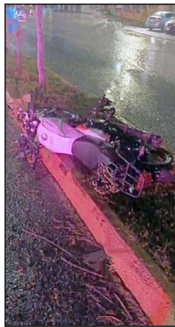
Ocurrió en Cadereyta.

Desafortunadamente el motociclista terminó perdiendo la vida cuando ingresaba al área de emergencia del Hospital Pemex, en el municipio de Cadereyta.