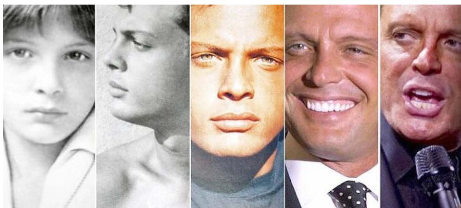
"El Sol" iniciará su recorrido por México en Monterrey el 14 de noviembre.

MONTERREY, N. L. LUNES 13 DE NOVIEMBRE DEL 2023