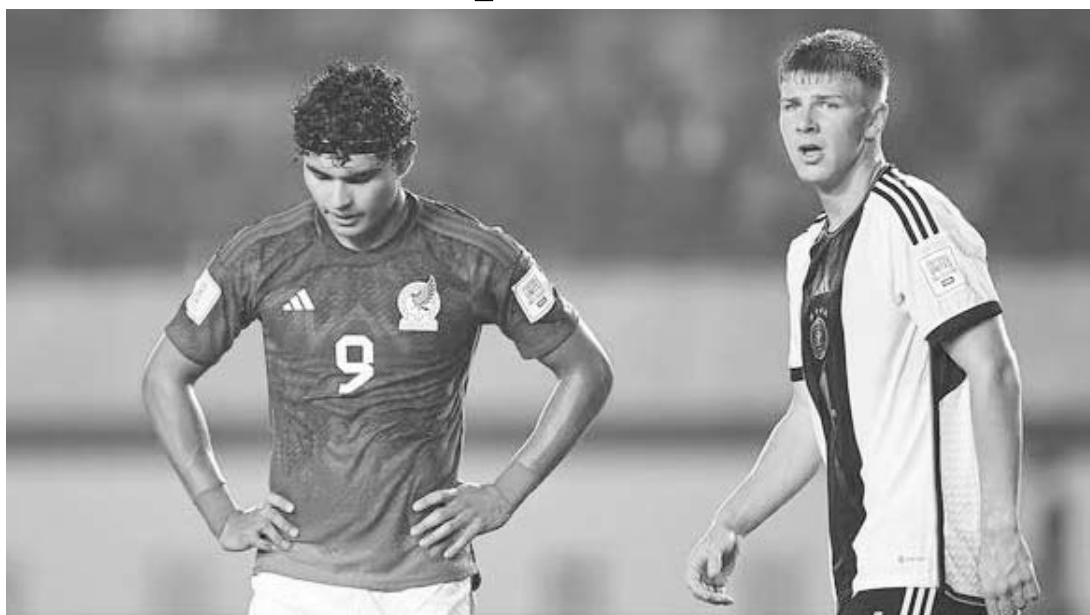
México cayó con Alemania 3-1.

La Selección Mexicana Sub-17 comenzó con el pie izquierdo su camino en la Copa del Mundo de la categoría que está siendo en Indonesia, al caer con Alemania 3-1.