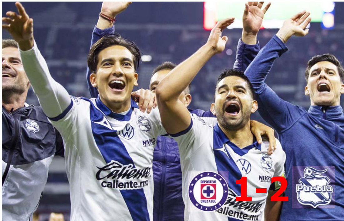
Puebla avanzó de manera directa y enfrentará a Tigres.