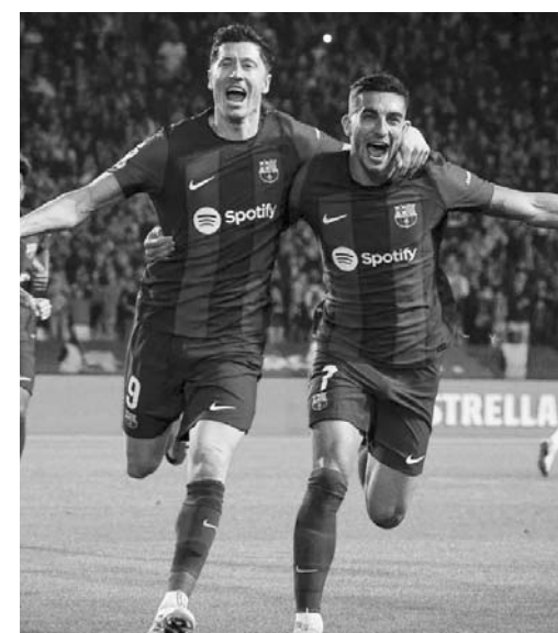
Los catalanes son terceros de la liga.

Ese resultado ha hecho que el conjunto del AEK se hiciera de 24 puntos para que sean terceros en el fútbol griego.