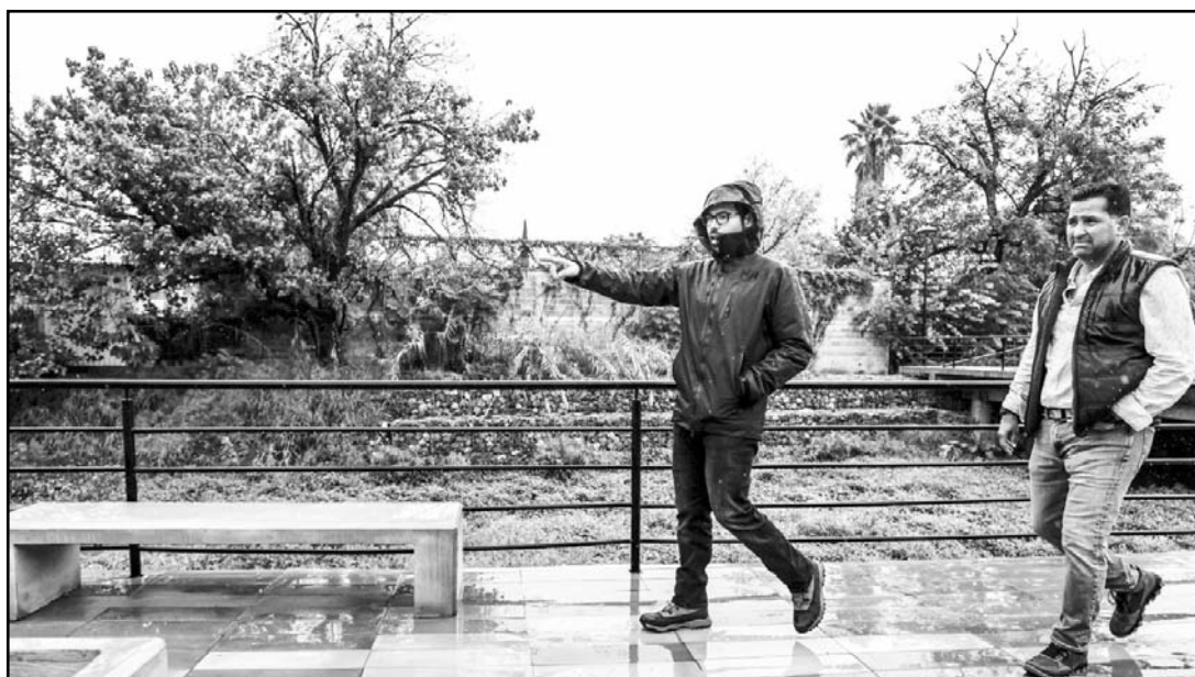
El presidente municipal de Santiago dijo que será cien por ciento ecológico.

En este sentido, el ejecutivo municipal manifestó que continuarán trabajando en brindar más y mejores espacios, para la recreación de las familias del municipio y de todos los que visitan continuamente la ciudad.(ATT)