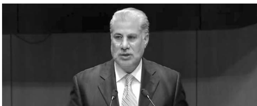
El senador morenista mostró mensajes en redes en el que lo acusan de ‘fascista’ por su posición en contra de algunas directrices de su partido.

Mañana, lunes 13 de noviembre, tras encabezar la reunión del gabinete de seguridad y la conferencia de prensa matutina en Ciudad Obregón, Sonora, el presidente Andrés Manuel López Obrador pasará su cumpleaños 70 con la comunidad yaquí para supervisar los avances del Plan de Justicia para este pueblo indígena.