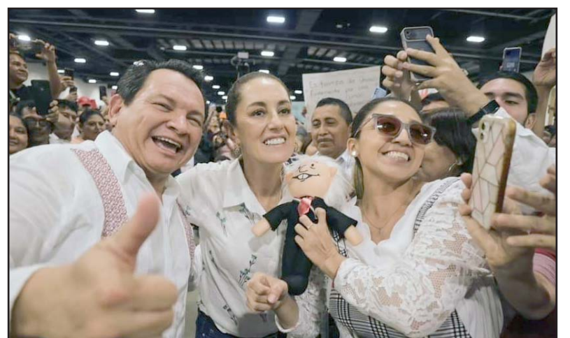
Claudia Sheinbaum, coordinadora de la 4T, elogió el proceso interno de Morena para seleccionar a precandidatos.

Asimismo, arremetió contra el expresidente Felipe Calderón, pues, dijo, fue un “usurpador” que