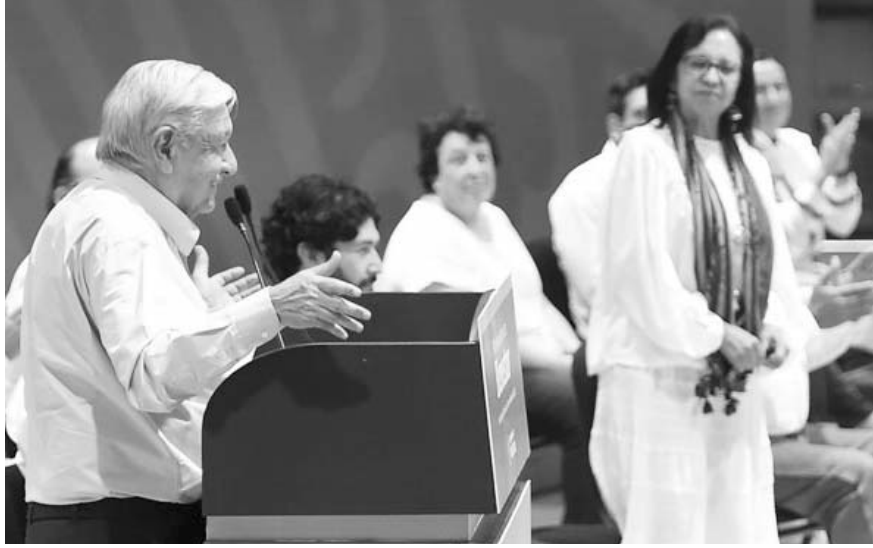
El presidente López Obrador anunció 10 compromisos para Baja California antes de terminar su Gobierno.

“Antes de concluir el mandato presidencial, enviaré una iniciativa de ley al Congreso para mantener tanto en la fron-