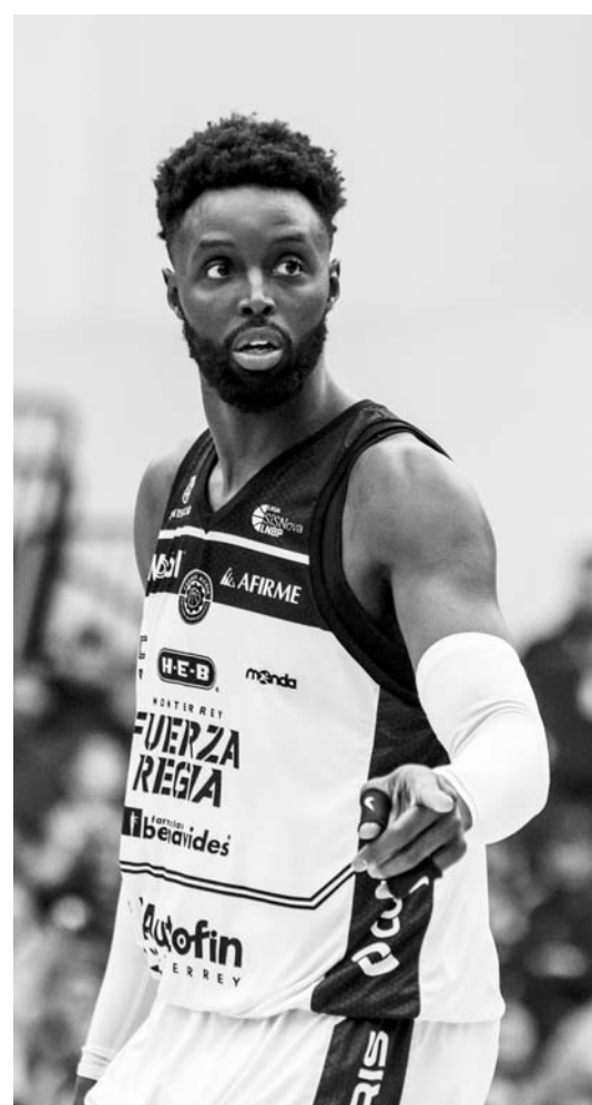
Fuerza Regia está a dos triunfos de avanzar.

Internacional continuará en Monterrey a partir del próximo jueves, aunque también durante los días viernes, sábado y domingo de esta semana que acaba de iniciar, siendo todo esto en la segunda y última etapa del evento. (AC)