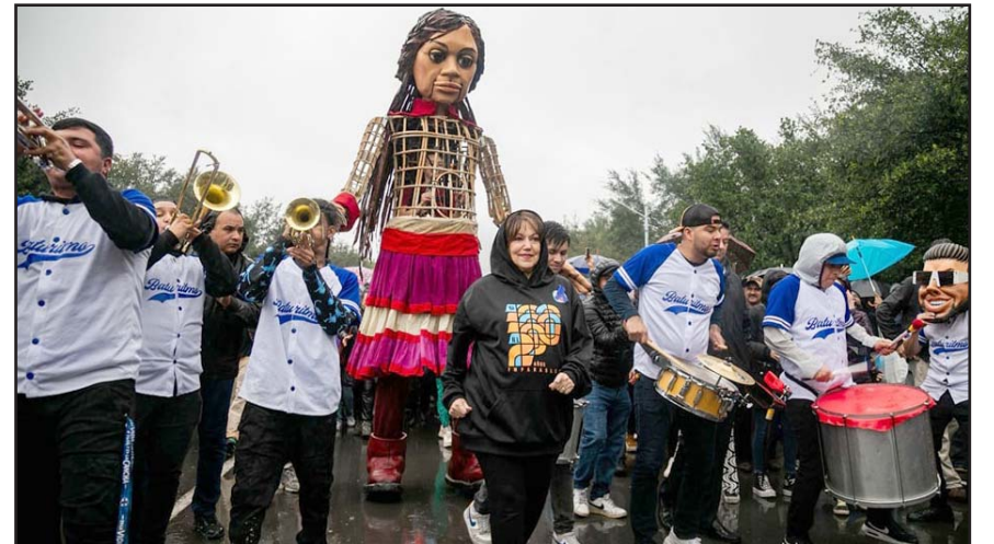
Es una marioneta gigante que ha simbolizado la resiliencia de los niños refugiados.

“Ahora te despedimos con todos los niños y niñas de Nuevo León. Adolescentes y jóvenes también se suman. Más de un millón 500 mil niños, niñas, adolescentes y jóvenes te despiden de Nuevo León, pero te dejan las puertas abiertas con los valores que tú nos transmites: respeto, inclusión, diversidad, y, sobre todo aquí en donde todos los niños, las niñas, los adolescentes y jóvenes son recibidos y respetados sus derechos. Muchas gracias, Amal, por tu visita, nos enorgullece y nos da la oportunidad de decir: Nuevo León siempre los protege”, comentó.