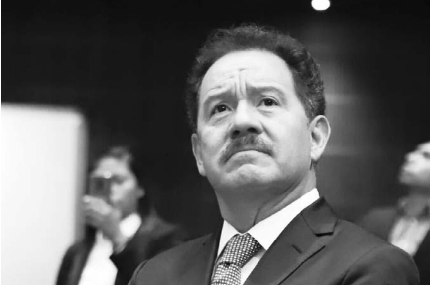
El diputado morenista se ausentó cuando dieron los resultados de las encuestas en el estado, que dio el triunfo a Alejandro Armenta.