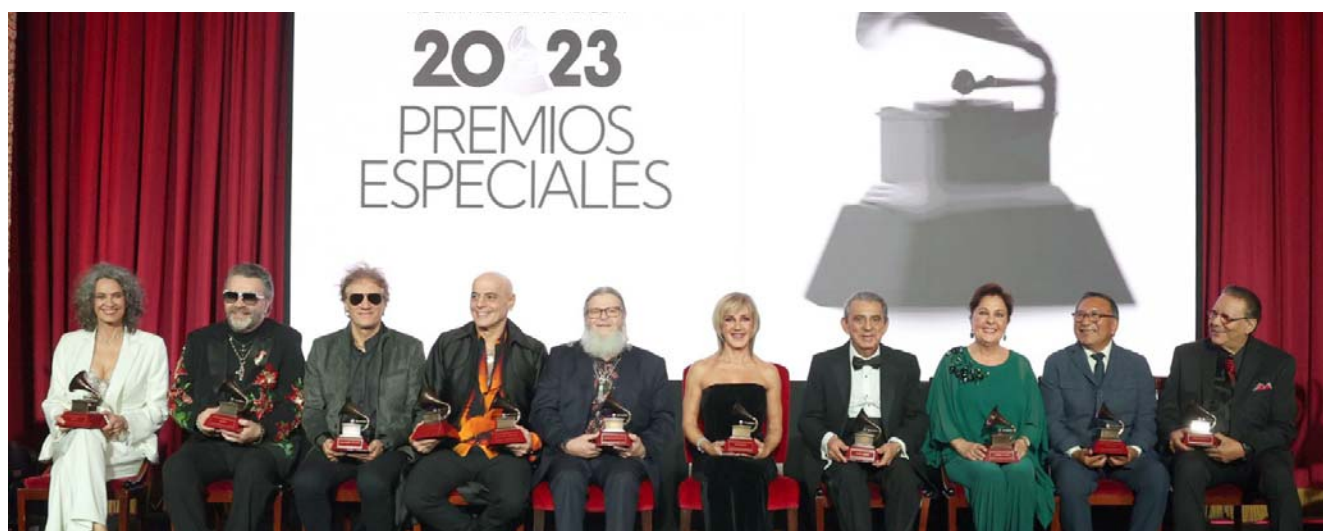
Los organizadores de la ceremonia publicaron la premiación en sus redes sociales.

Una de las razones por las que el intérprete de "La incondicional" se