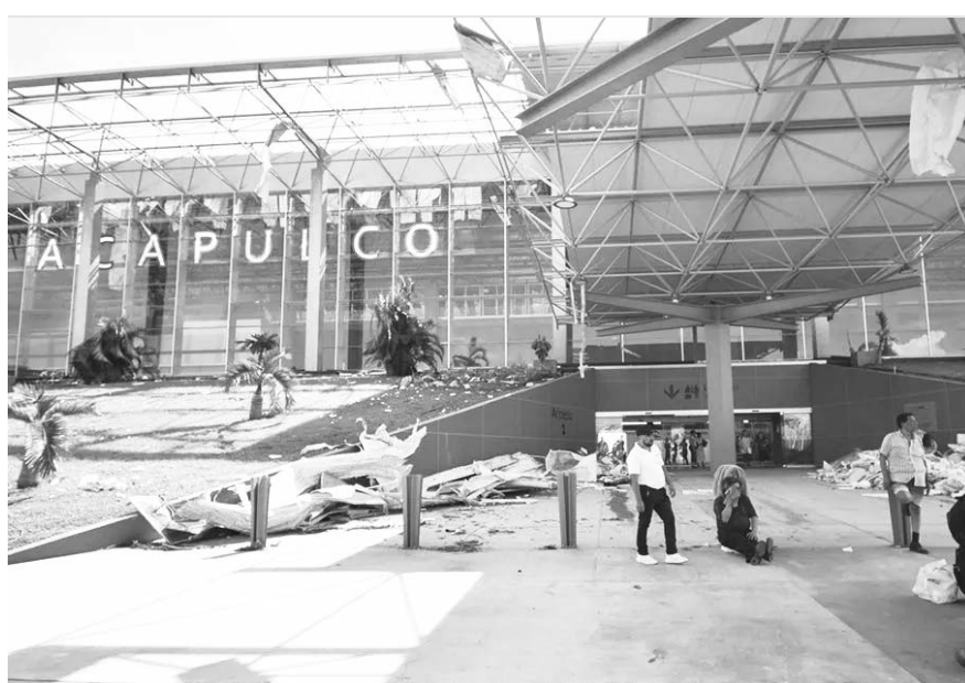
A partir de hoy reanuda actividades de vuelos nacionales.

sobre, todas y todos somos necesarios para engrandecer el proyecto de la Cuarta Transformación, así que vamos juntos, vamos unidos, es el momento de salir adelante a conquistar el corazón y la conciencia de la Ciudad de México”.