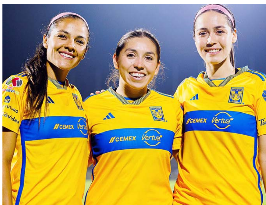
Tigres tiene ventaja de 3-1 sobre Pumas.

Si las auriazules logran hoy ese cometido y se meten a la semifinal, ahí lo más seguro es que enfrenten a las Rayadas del Monterrey, aunque eso es algo que muy posiblemente se confirme en las próximas horas.