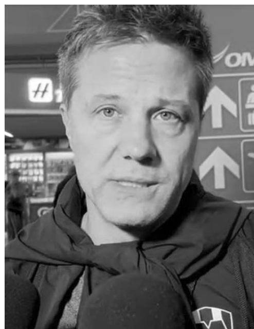
Noriega se mostró exigente.

Por último, el presidente de Rayados se mostró con algo de confianza respecto a que la