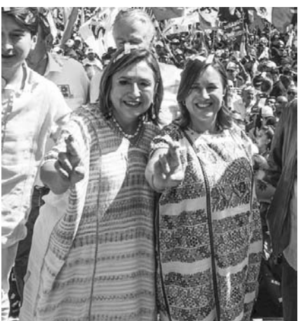
La representante opositora advirtió que ‘no se va a dejar’ del Gobierno.