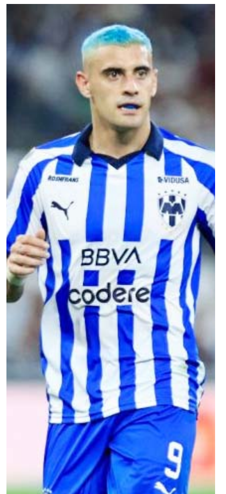
Monterrey, con ilusiones.