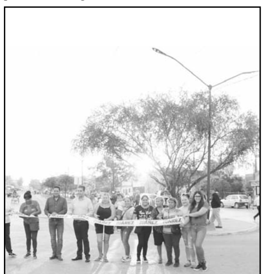
El alcalde, Paco Treviño inauguró la obra.

Añadió que su administración seguirá invirtiendo en obra pública para mejorar la calidad de vida de los habitantes de Juárez. (AME)