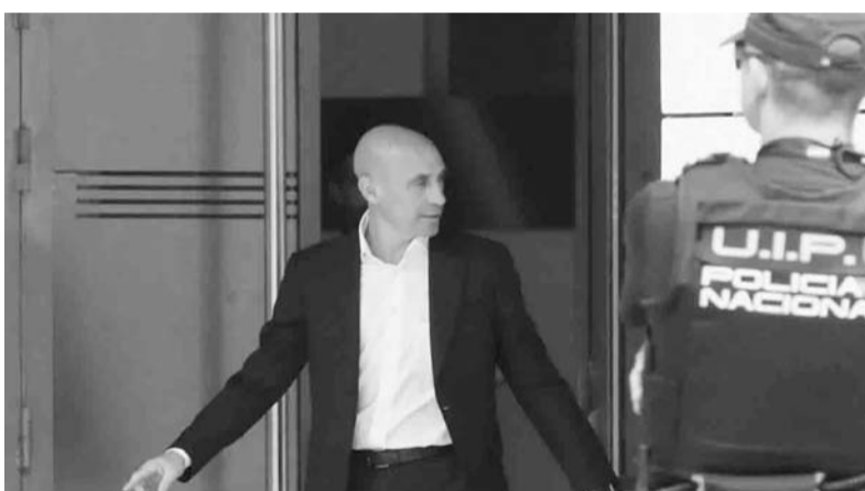
Fue detenido al aterrizar en el aeropuerto Adolfo Suárez Madrid-Barajas.

Los anteriormente mencionados volverían a jugar en este torneo internacional en una hipotética serie de semifinales ante Tigres o Columbus Crew. (AC)