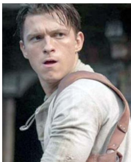
Muy grande para el papel, dicen.

Pese al descontento, Butch Hartman, director de la serie original, señaló durante la MegaCon en Orlando, que Tom tiene el perfil perfecto para interpretar a Danny en una película "live action".