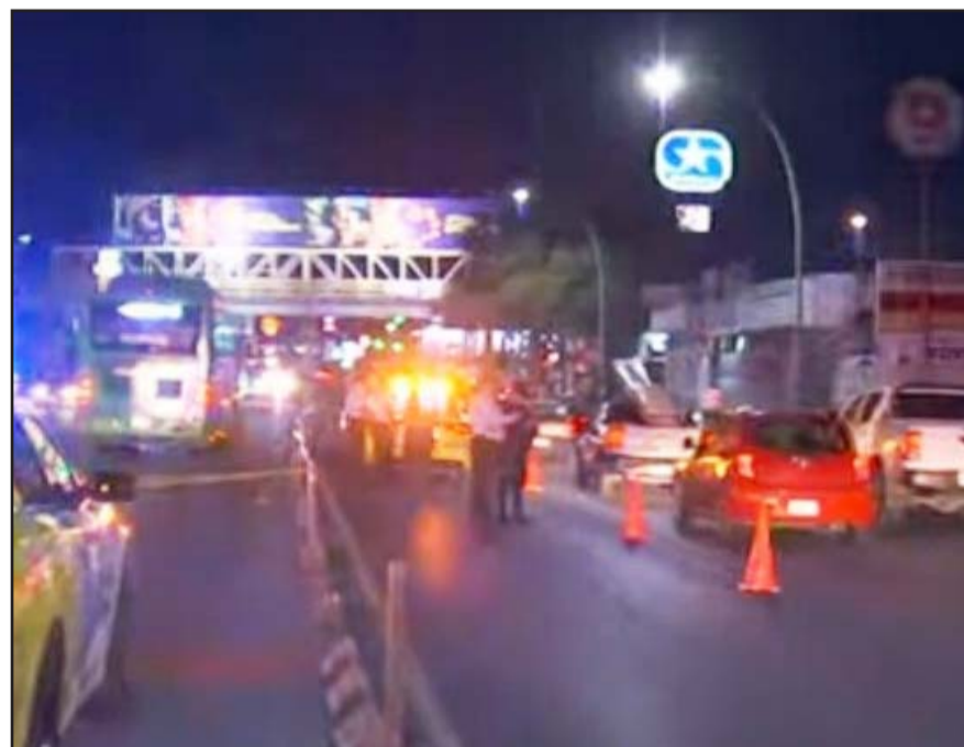
Fue en la avenida Lincoln en donde el niño intentó cruzar.

Trascendió que la víctima iba acompañado de otro menor, ya que se dirigían a una tienda de conveniencia y no utilizaron el puente vehicular.