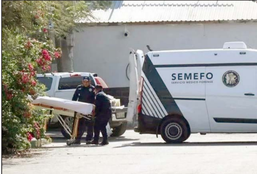
Tras salvarse de dos atentados 'El Forti' no la libró de un tercero.

Se indicó que este miércoles el hombre llegó a su casa a bordo de una motocicleta.