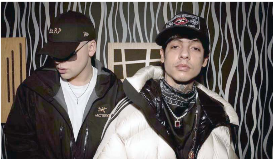
Lo prometido, es deuda.

A casi una hora de su estreno, el video ya supera el millón de reproducciones y los 600 mil me gusta, además de que los usuarios de YouTube y las redes sociales