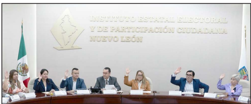
El Partido del Trabajo también se inconformó y se los aprobaron.

"Nos faltarían los candidatos de una coalición y digamos que a partir de ese momento empezáramos a tomar definiciones concretas en cuanto a preparar un formato que el Consejo Local debe conocer y aprobar, y luego ver la sede del debate", mencionó la titular del INE en Nuevo León.