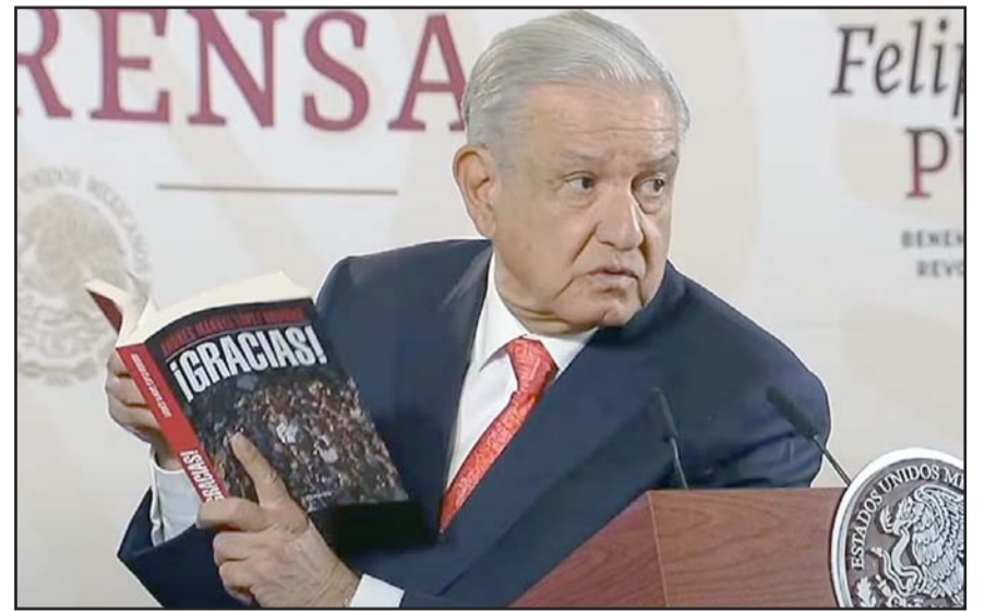
La Sala Superior del Tribunal Electoral consideró que está bajo su derecho de libertad de expresión.

Se hizo una revisión manual mediante técnicas computacionales e inteligencia artificial. En una primera revisión, se detectaron 28 errores de coherencia argumentativa, sintaxis, neutralidad o pertenencia temática, criterios de invalidación establecidos por el INE por lo que se reemplazaron dichos reactivos.