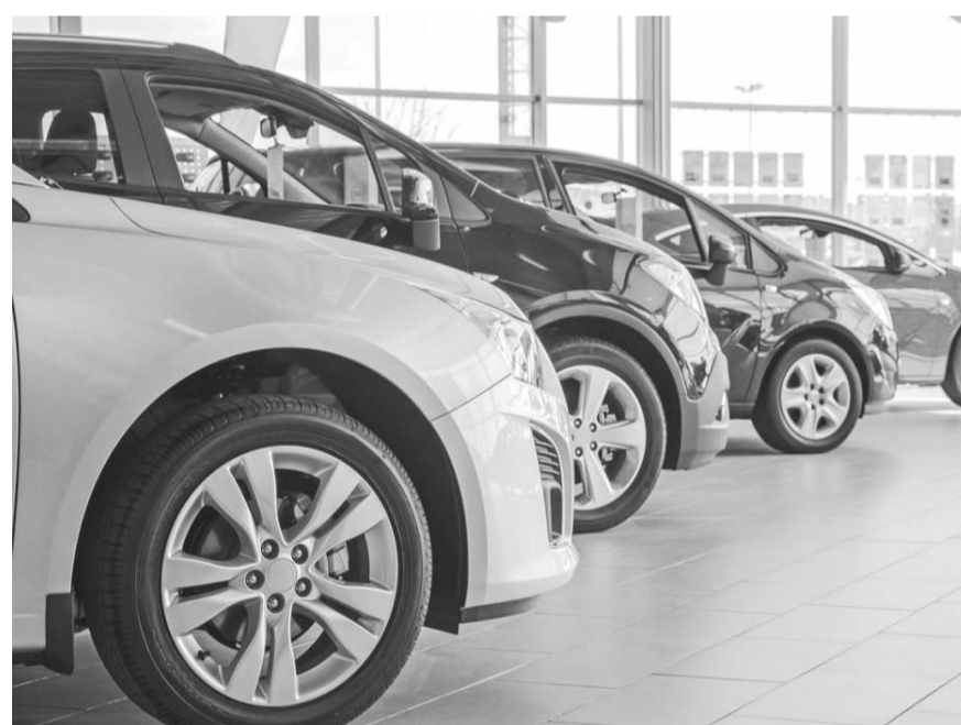
La industria automotriz comercializó 124 mil 395 autos nuevos el mes pasado, 4.7% más que en marzo del año anterior.

En cuanto al desempeño contra el mes inmediato anterior, destaca un incremento de 11 mil 137 vehículos más vendidos en marzo, es decir, un avance de 10% frente a febrero, destacó Guillermo Rosales, presidente ejecutivo de la Asociación Mexicana de Distribuidores de Automotores