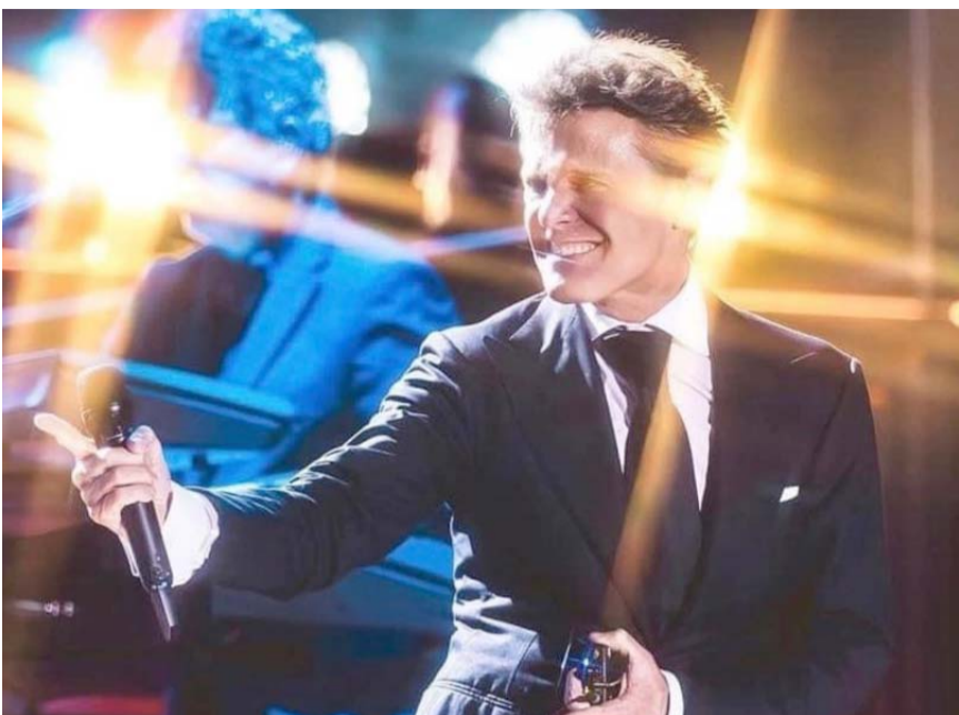
Retomará gira en México a partir de agosto.