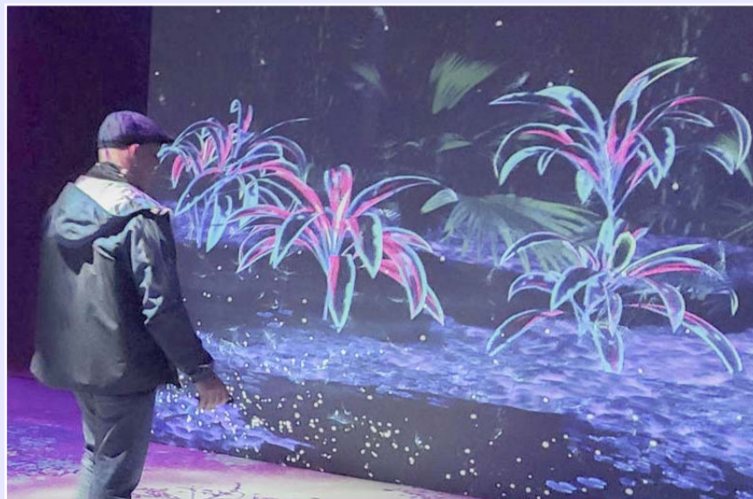
Cameron ha creado sus propios mundos que se convierten en filmes.

En ocasiones, los sueños se hacen realidad, reconoció el cineasta. "Me encantan los sueños e incluso las pesadillas, porque de ellas saco muchas buenas ideas para historias. Me gusta el proceso de soñar, que no