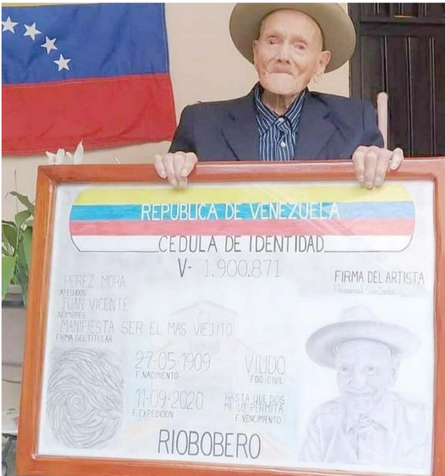
Tuvo once hijos, 41 nietos, 18 bisnietos y 12 tataranietos.

La curadora agrega que todas las propuestas están sujetas a una investigación crítica y sistemática, reconociendo como puntos de partida e influencia diversas expresiones culturales de contextos globales vertidas en la Historia del Arte, en objetos y artefactos que conforman el lenguaje plástico y visual que permite construir nuevos mensajes.