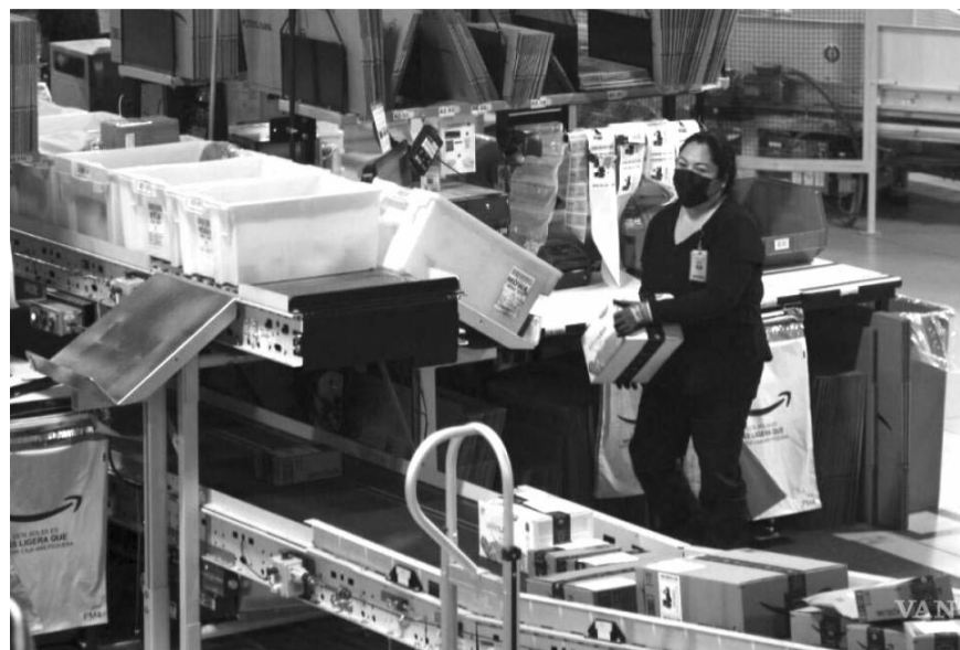
Tras cuatro años de estar fuera del top 25 del Índice de Confianza de Inversión Extranjera Directa (IED), México regresó a la posición 21

Aún así, 85% de los directivos empresariales consultados dijeron que ya están invirtiendo o buscan lugares para colocar su capital, además de que 88% aseguró que mantendrá sus niveles de IED o los aumentarán.