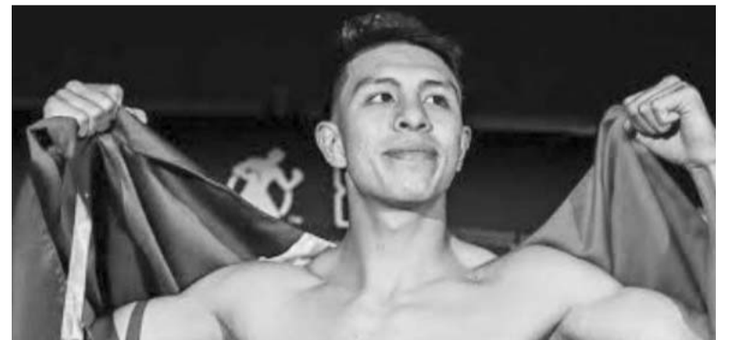
Garantizó que tanto él como Álvarez ofrecerán un gran espectáculo.

Diggs se une a una cargada ofensiva de los Texanos encabezada por su QB Stroud, el actual novato ofensivo del año de la NFL que también incluye a Mixon y los receptores Nico Collins, Tank Dell y el ala cerrada Dalton Schultz .