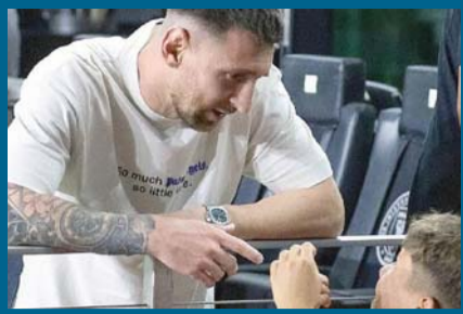
El argentino estuvo en un palco.