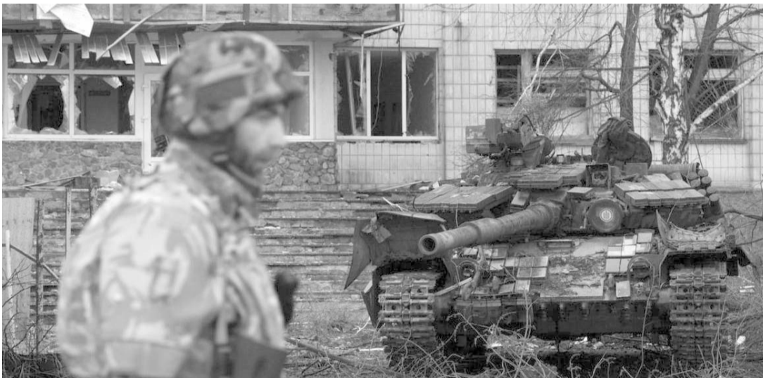
Buscan 50 mil nuevos reclutas para frenar la invasión de Moscú.

La edad media de los soldados ucranianos, como en el lado ruso, ronda los 40 años, según analistas militares.