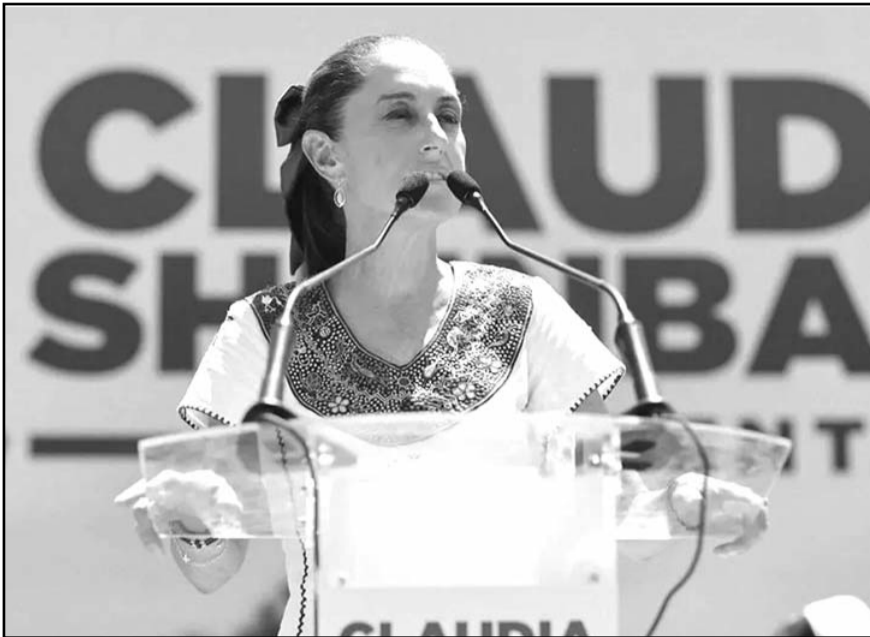
"Yo soy candidata, él tiene que explicarlo", dijo la abanderada presidencial.