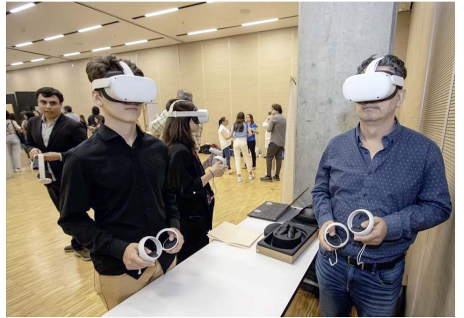
La muestra colectiva está conformada por alumnos de sexto semestre de Artes Visuales.