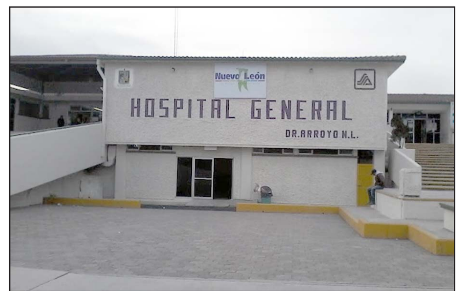
Fue atendida en el hospital general del municipio pero falleció.

Indicaron que llegaron este fin de semana a la casa de unos familiares en el Ejido La Coloradas, en dicha localidad.