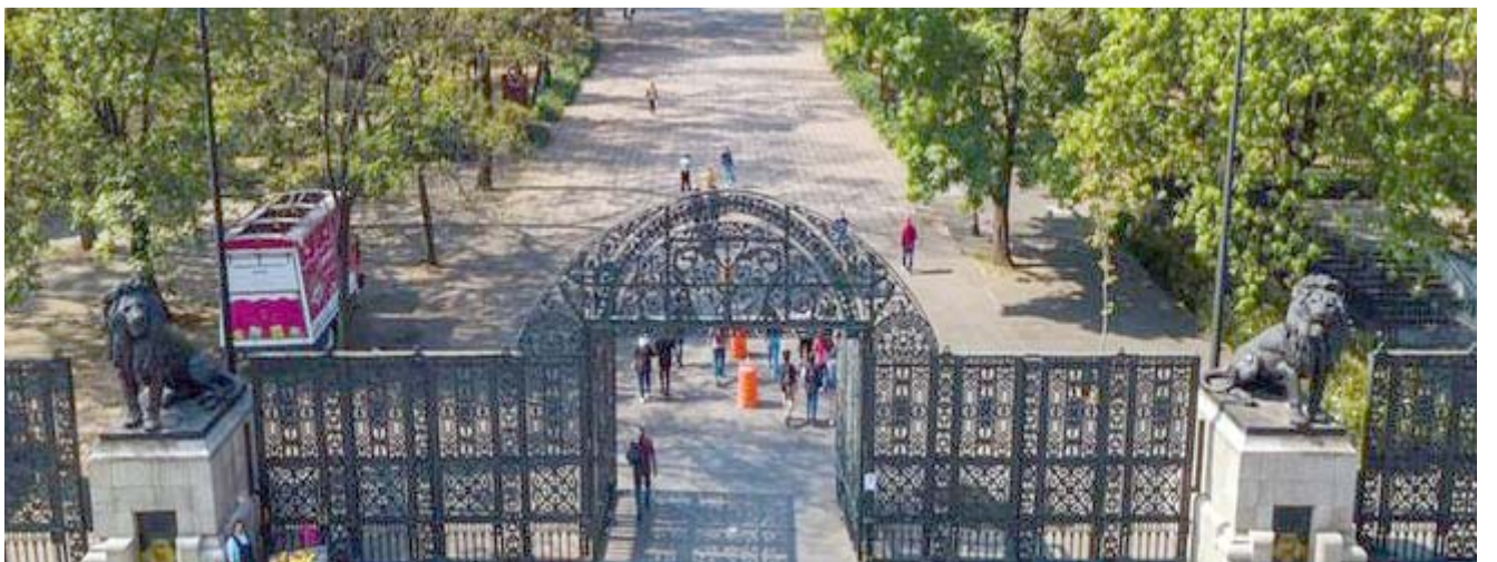
Se realizarán trabajos de construcción de infraestructura, proyectos, obras civiles y complementarias.

objeto transferir recursos presupuestarios federales por parte de Cultura, para que esta última realice de manera eficiente y eficaz las obras, los proyectos ejecutivos, así como todas las adquisiciones de insumos requeridos para la integración del Proyecto "Complejo Cultural Bosque de Chapultepec", también denominado, Plan Maestro del Proyecto "Complejo Cultural Bosque de Chapultepec", a través de las Secretarías del Medio Ambiente, en adelante "SEDEMA" y de Obras y Servicios, en adelante "SOBSE", así como precisar los compromisos que sobre el particular asumen la "ENTIDAD FEDERATIVA" y "CULTURA"; y establecer los mecanismos para la evaluación y control de su ejercicio", reza el documento.