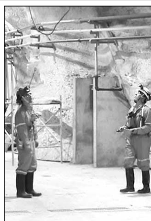
La USTR solicitó al gobierno mexicano iniciar un Mecanismo Laboral de Respuesta Rápida contra Minera Tizapa.

El mecanismo laboral se activa bajo el Tratado entre México, Estados Unidos y