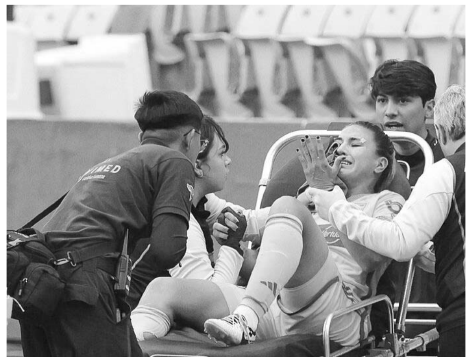
La jugadora de las Tigres estaría de vuelta en julio.

Su regreso a la actividad grupal con las ‘Amazonas’ tal vez sea para inicios del mes de julio y cuando esté por iniciar el Torneo Apertura 2024. (AC)