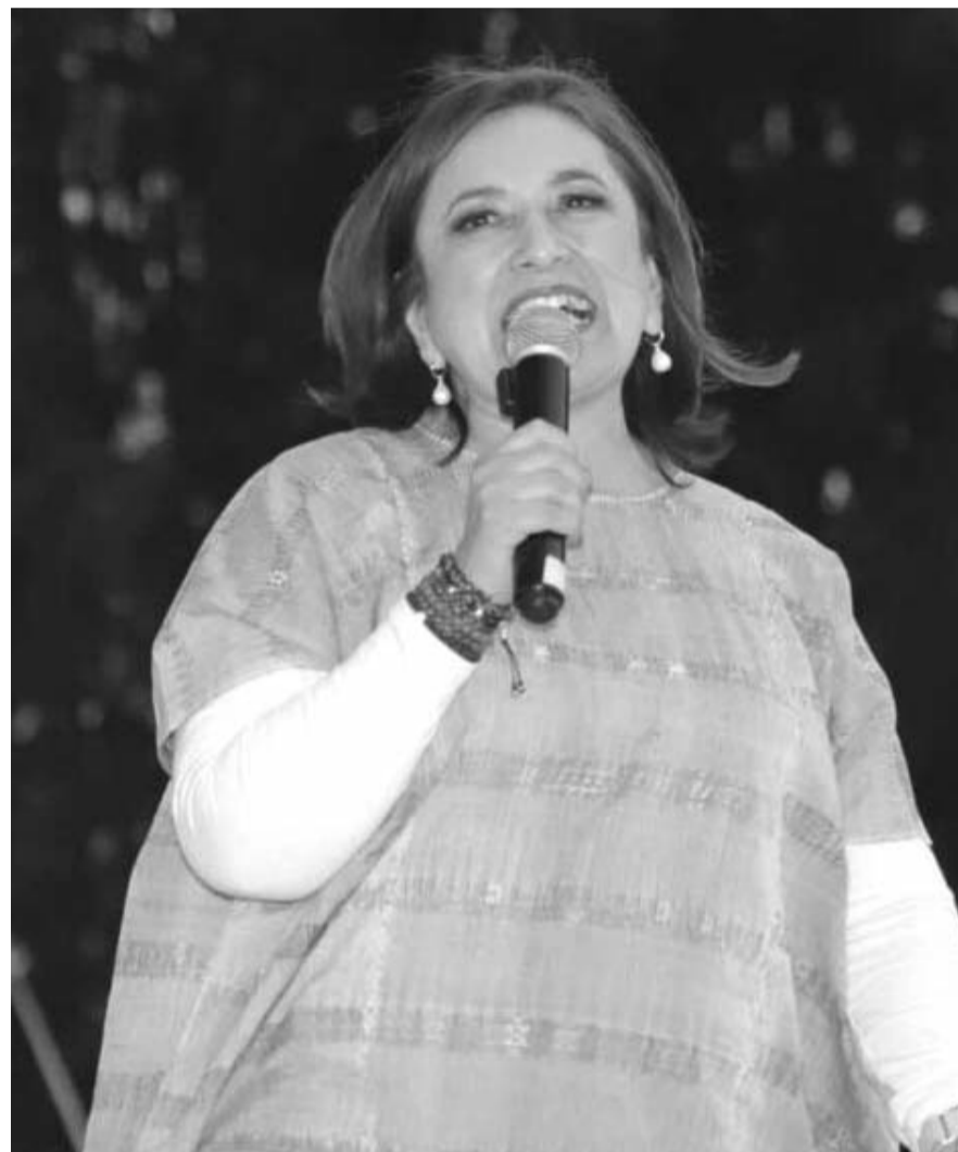
Xóchitl Gálvez Ruiz destacó que hay dos proyectos en juego: que siga la corrupción con Morena o un México próspero, seguro y sin miedo.

Al acto asistieron los exgobernadores del Estado de México Arturo Montiel y César Camacho.