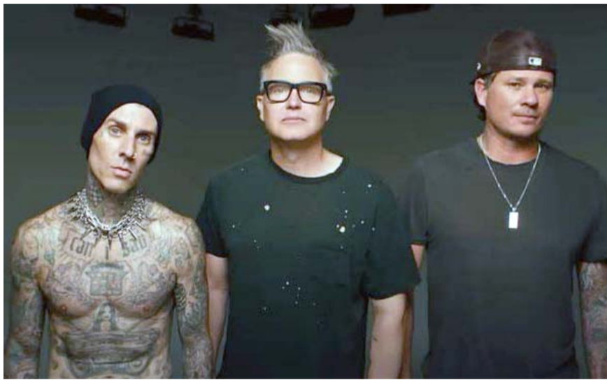
El bajista Mark Hoppus, reportó cuadro con molestia en la garganta.