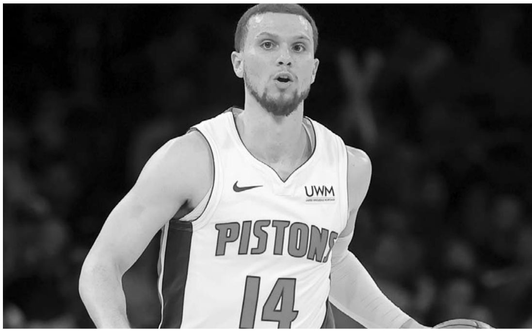
Detroit perdió increíblemente pese a los 50 puntos de Malichi Flynn.

Los Celtics de Boston superaron 135-100 al Thunder de Oklahoma y con un récord de 60 victorias por 16 derrotas se han hecho del liderato de la conferencia Este en la NBA, además de que tendrán la oportunidad de jugar toda la postemporada como locales si es necesario.