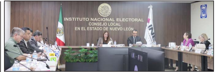
El Instituto Nacional Electoral determinó que será el 11 de mayo.

dades federales electorales como también del Estado de Nuevo León, con el objetivo de establecer una coordinación permanente con Ejército, Guardia Nacional, Fiscalías, Fuerza Civil, a la que agregaremos en su momento a las autoridades municipales que son responsables de lo que suceda en su territorio".