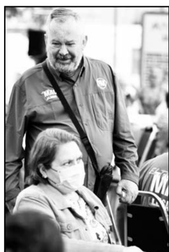
Hizo una consulta ciudadana

Entre ellas se destacó el mantenimiento de los parques, calles y la necesidad de una clínica de salud para los vecinos de la zona.