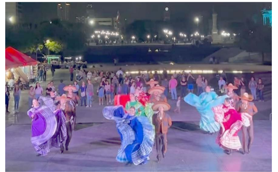
Un fin de semana más de fiesta dancística.

Por último, "Noches de Algarabía Folklórica" tiene como escenario la explanada del Museo de Historia Mexicana.