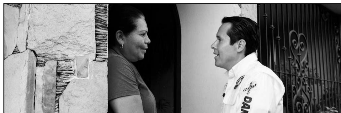
El aspirante a la presidencia municipal inició ayer los recorridos por las colonias.