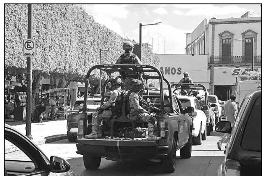
Los elementos de las fuerzas federales vigilaron el perímetro de la Catedral durante varias horas.

Los elementos de las fuerzas federales vigilaron el perímetro de la Catedral durante varias horas, desde antes de que comenzara el acto religioso, hasta después de que varias unidades de la Guardia Nacional se fueran tras la carroza hacia el panteón.