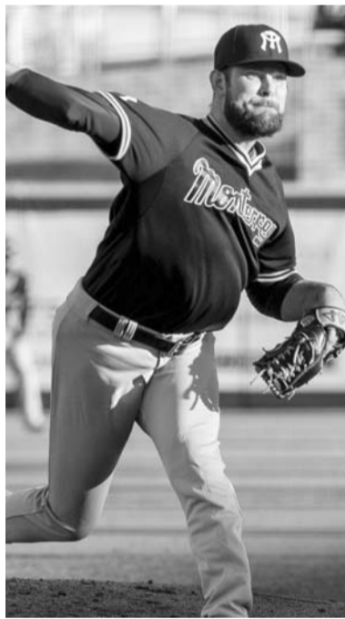
Sultanes dividió en la Florida.

La localía respondió en la octava entrada con una carrera, pero el pitcheo de los regios les fue suficiente para aguantar la ventaja y