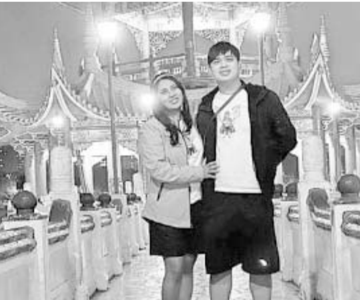
Aquí te enseñan desde pequeños, medidas de prevención.

La dirigente agregó otros aspectos que, a su juicio, contravienen al acuerdo de Barbados, del que dijo que "ha sido integralmente violentado por parte del régimen de Nicolás Maduro".