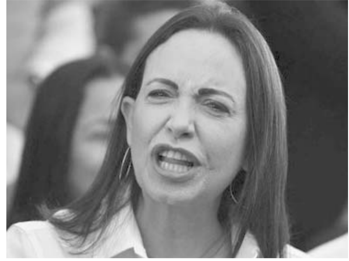
Considera se quebranta el derecho de los venezolanos.

Sobre el terremoto recuerda que estaba en su casa en un sexto piso. Al abordar el de ayer y el de 2017, dice que "ambos los sentí muy fuertes, pero en México me impactó más; sentí que brincaba y aquí más que nada un balanceo"; concluye que "nos quedamos en el departamento. Después me salí al parque y él [mi esposo] debía ir a una compañía en donde estudia".