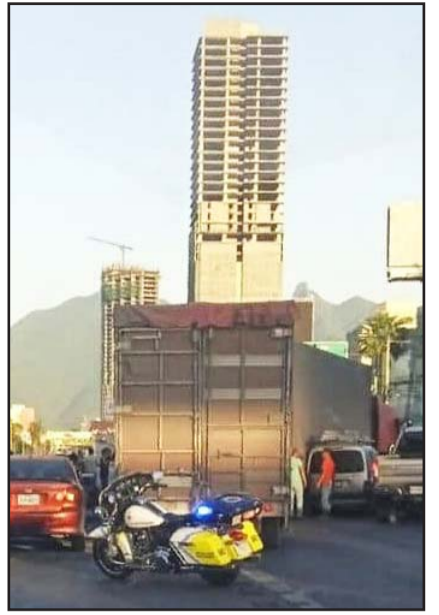
Fue en plena hora pico.

Los hechos ocasionaron la movilización de unidades de la policía preventiva municipal, Fuerza Civil y elementos de la Agencia Estatal de Investigaciones, quienes ya indagan los hechos.