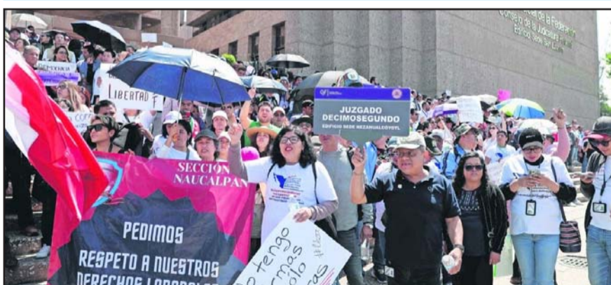
Desde los juzgados laborales de San Lázaro, convocó a los más de 40 mil trabajadores para salir en mayo.

"Perdió la censura; ganó la libertad"; AMLO celebra que tribunal electoral no hay prohibido su libro.