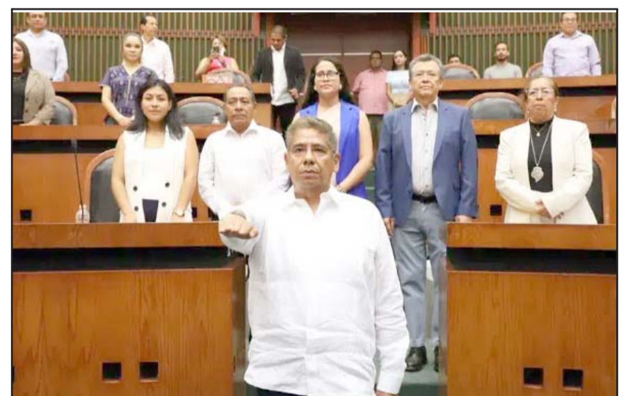
La gobernadora Evelyn Salgado Pineda envió al Congreso la terna finalista para el nuevo titular de la Fiscalía General del Estado.

Kothan exigió a la gobernadora que no volviera a nombrar a militares al frente de la fiscalía y la Secretaría de Seguridad Pública estatales; la petición no fue escuchada.