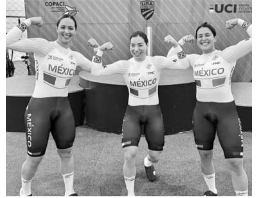
En ciclismo también se calificó.