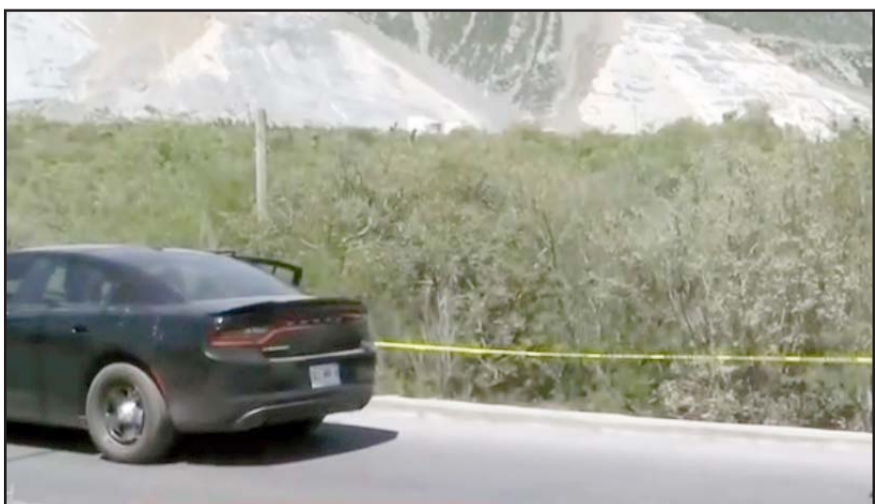
Fue en un lote baldío del municipio de Escobedo.