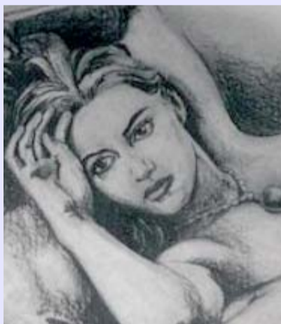
El propio Cameron trazó a Rose.

es más que la mente entrenándose y poniendo en marcha el motor de la narración", contó.