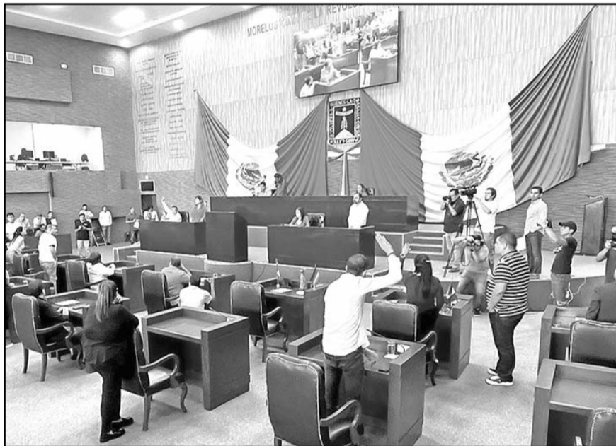
Con 11 votos a favor y seis en contra, la mayoría del Congreso de Morelos aprobó la solicitud de Cuauhtémoc Blanco para separarse del cargo de gobernador.

Blanco Bravo recurrió al TEEM para impugnar la omisión del Poder Legislativo porque desde el 26 de marzo solicitó por escrito autorización al Congreso local para separarse del cargo, luego de la sentencia del