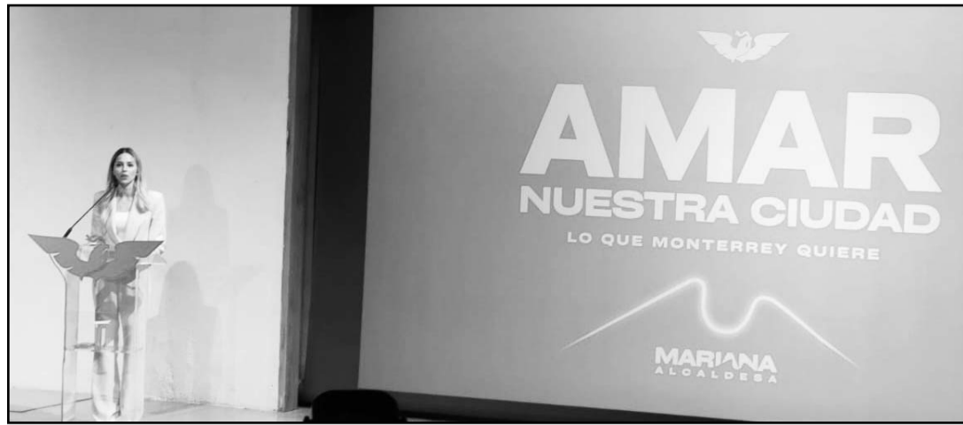
La candidata de Movimiento Ciudadano planteó su plan en 13 ejes.