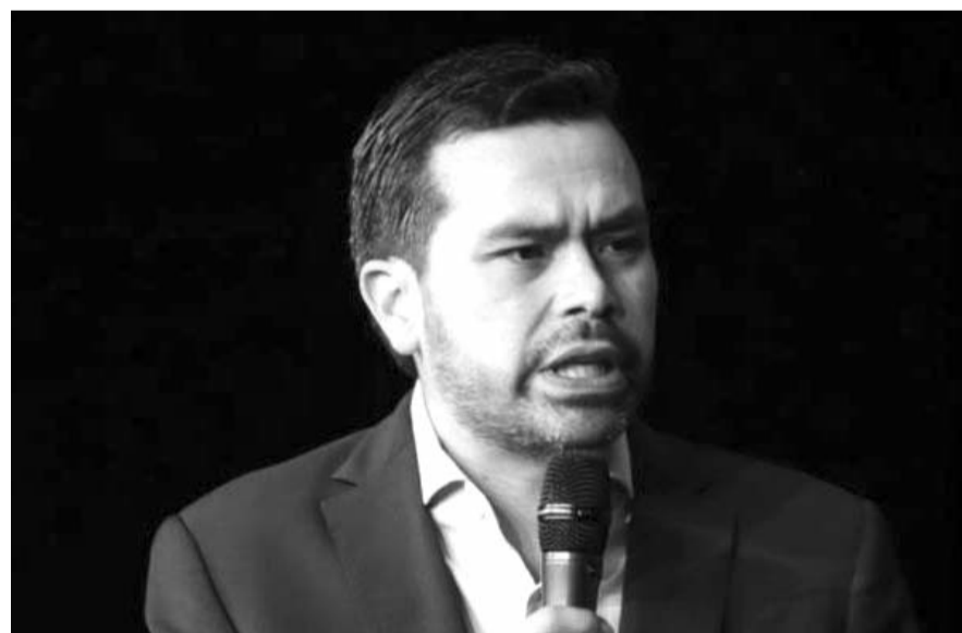
Se defiende de acusaciones.

Por otro lado, Álvarez Máynez ha negado rotundamente las acusaciones, calificándolas como parte de una "guerra sucia" de la alianza PRI y PAN en su contra y contra Movimiento Ciudadano.