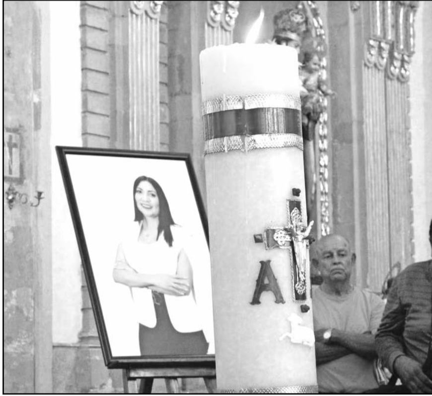
Señalaron su preocupación por que el crimen quiera imponer a sus candidatos y la violencia afecte la libertad de los ciudadanos a votar.

Por su parte, el padre Ávila consideró que esta inseguridad es resultado "del descuido de las autoridades" y las "presuntas y supuestas complicidades en muchos territorios, y llamó a "hacer votos para que cada quien asuma la responsabilidad que tiene para lograr la paz en el país".