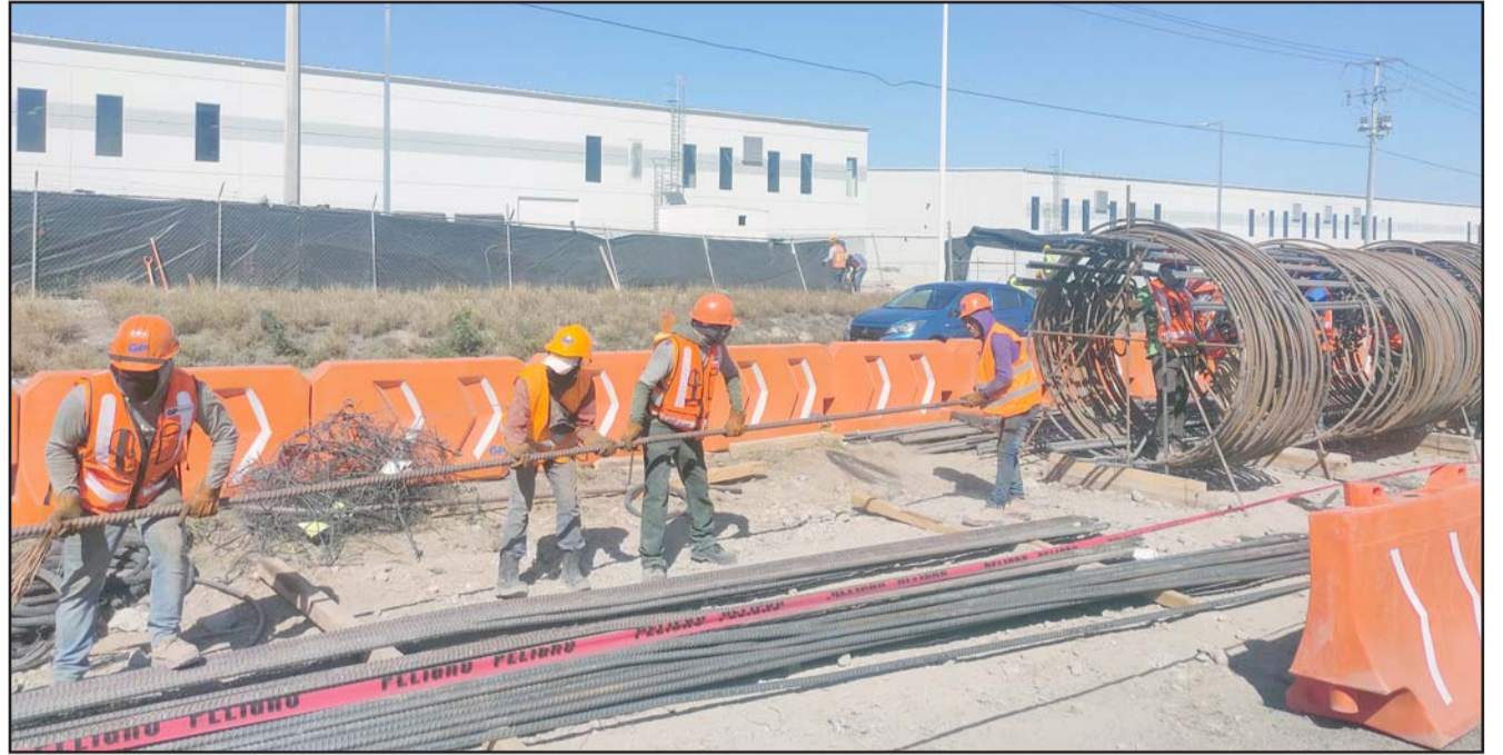
A diario se encuentran cuadrillas trabajando por la avenida Miguel Alemán

"La Línea 6 está conectada con la Línea 4 permitiendo ser la más grande de América de 41 kilómetros de longitud, vamos a cumplir con la promesa de tener esta línea para el mundial de fútbol, para que la ciudad se Monterrey y capital del estado, esté a nivel de las grandes capitales del mundo", manifestó.