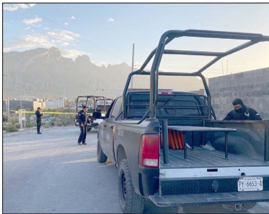
Fue en la colonia Los Arcángales del mencionado municipio

El percance vial causó todo un caos automovilístico, por lo que tuvieron que movilizar las unidades lo más rápido que se pudo, incluso empujando las unidades, mientras que arribaban las grúas para removerlos.