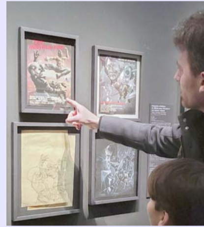
Los dibujos, piedra angular del artista.

"Puedo imaginar que eso sea una posibilidad (el uso de la IA), pero nunca la usaríamos para crear la ima-