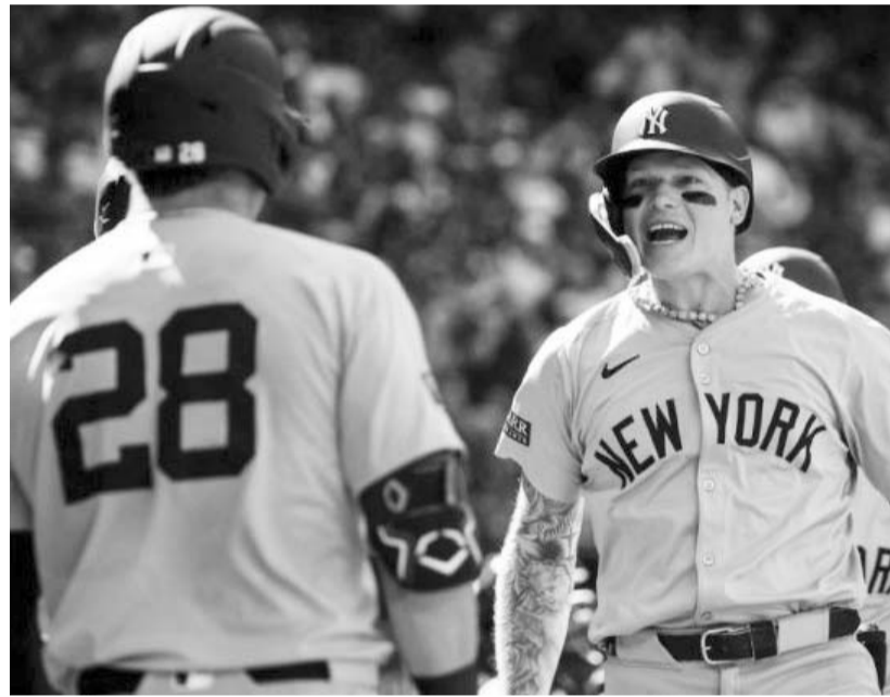
El mexicano remolcó dos carreras.

A su vez, Isaac Paredes generó una carrera en los Rays y esto fue en la derrota de 4-1 sobre los Rangers de Texas.