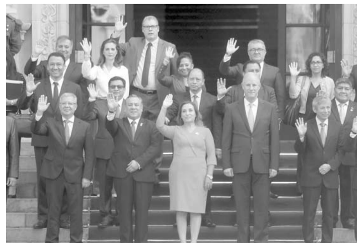
Es el tercer gabinete de la presidenta peruana.

Con una segunda moción de censura en marcha contra Boluarte, el presidente del Consejo de Ministros, Gustavo Adrianzén, se dirigió ante el pleno del Congreso para pedirle el voto de confianza, que le permitiría al gabinete seguir en funciones.