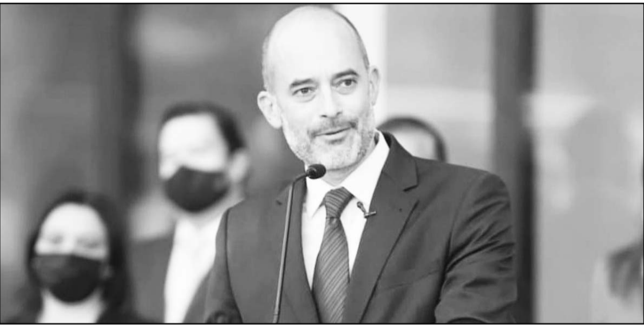
El alcalde sampetrino dijo que cuando lo terminen será un centro de apoyo muy importante.

"Los mismos captores, al menos de los que fueron ubicados el pasado lunes, les proveen un vehículo mediante el cual ellos se trasladan", concluyó.(CLR)