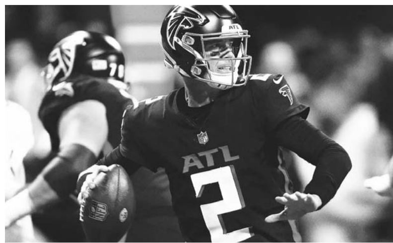
El mariscal brilló con Halcones y Potros.

Donovan ha estado a cargo del trabajo fuera del campo, como lo es el expandir la base de fanáticos y la presencia internacional de equipo.