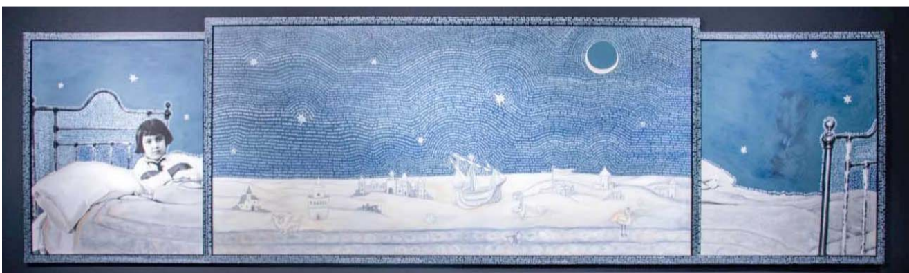
Los temas principales son el clasismo, racismo, cuestiones de género y feminismo.

Con emoción y confianza los competidores comenzaron las presentaciones de sus prototipos con la seguridad de que la experiencia vivida los marcará para siempre.