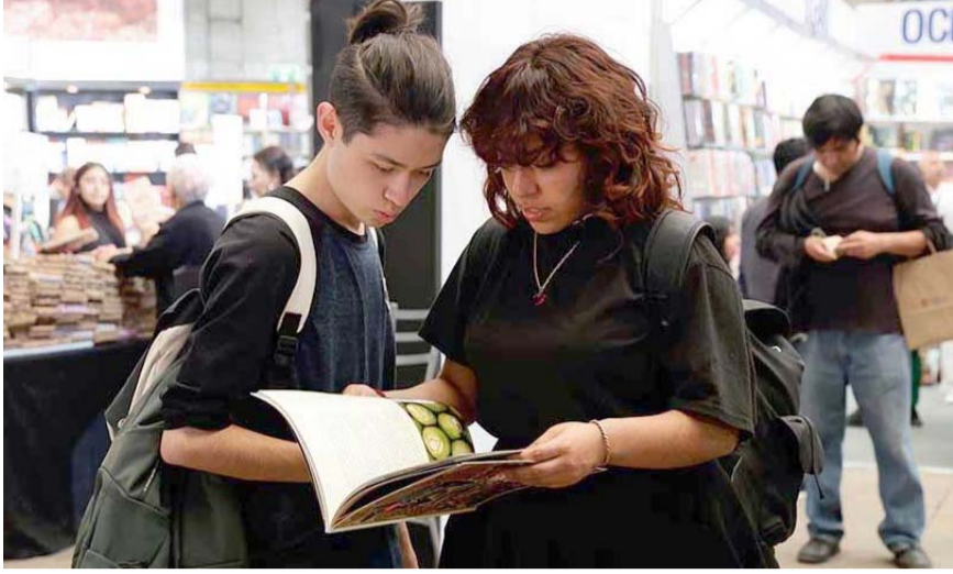
La celebración es promovida por la UNESCO.