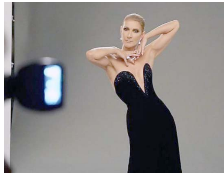
Dion revela que su rutina diaria incluye terapia deportiva, física y vocal hasta cinco días a la semana.

Además, ella ha asegurado que él no ha tenido el mínimo interés en buscar a los niños; mientras que personas cercanas al cantante aseguran que es la madre quien no lo permite.