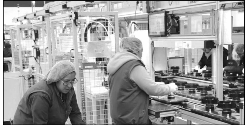
Este repunte de la economía se debió principalmente al dinamismo del sector servicios.

Contrario a lo anterior, las actividades legislativas, gubernamentales y de organismos internacionales disminuyeron 0.5% en el mes; los servicios profesionales, científicos y técnicos, así como los servi-