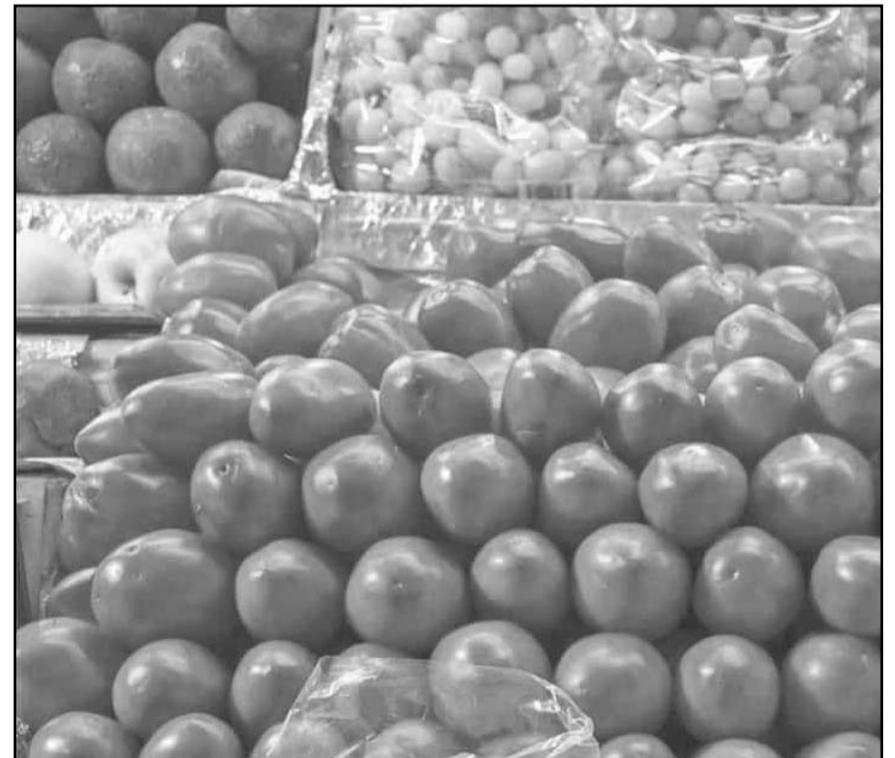
Afirman que pretenden hacer una nueva investigación al cambiar el periodo de análisis de 1995-1996 a 2018-2019 lo que es contrario a la ley.

La Corte aseguró que, aunque, es difícil realizar una investigación en 2024 sobre hechos de 1995-1996 y pese a que hay preocupación sobre si se encontrará evidencia sobre ello la ley pide que se mantenga el análisis sobre dicha fecha, por lo que la determinación final que hizo el Departamento de Comercio con otras fechas hace contrario a la ley dicha resolución.