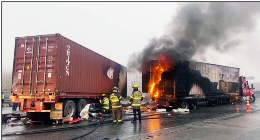
Durante todo el día de ayer se hicieron trabajos en la zona.

Dos de las unidades llevaban carga plástico y los otros dos iban vacíos. Una de las unidades de carga que se in-