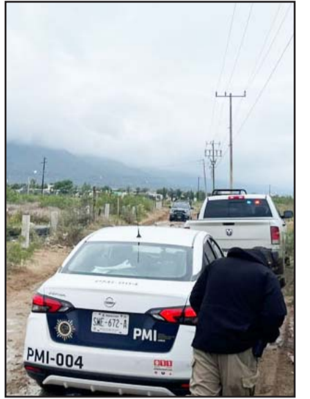
Fue en la colonia Villa Nova.

Tras realizar una inspección de rutina, los efectivos municipales hallaron