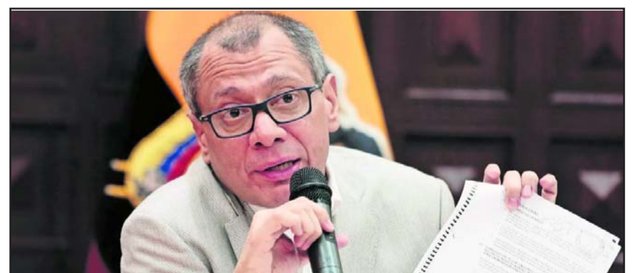
Se ha pedido el apoyo de terceras embajadas en Ecuador para el caso.

"Estamos acudiendo al Consejo de Derechos Humanos, lo de la Convención de Caracas que es nuestro derecho que nos entreguen a Jorge Glas