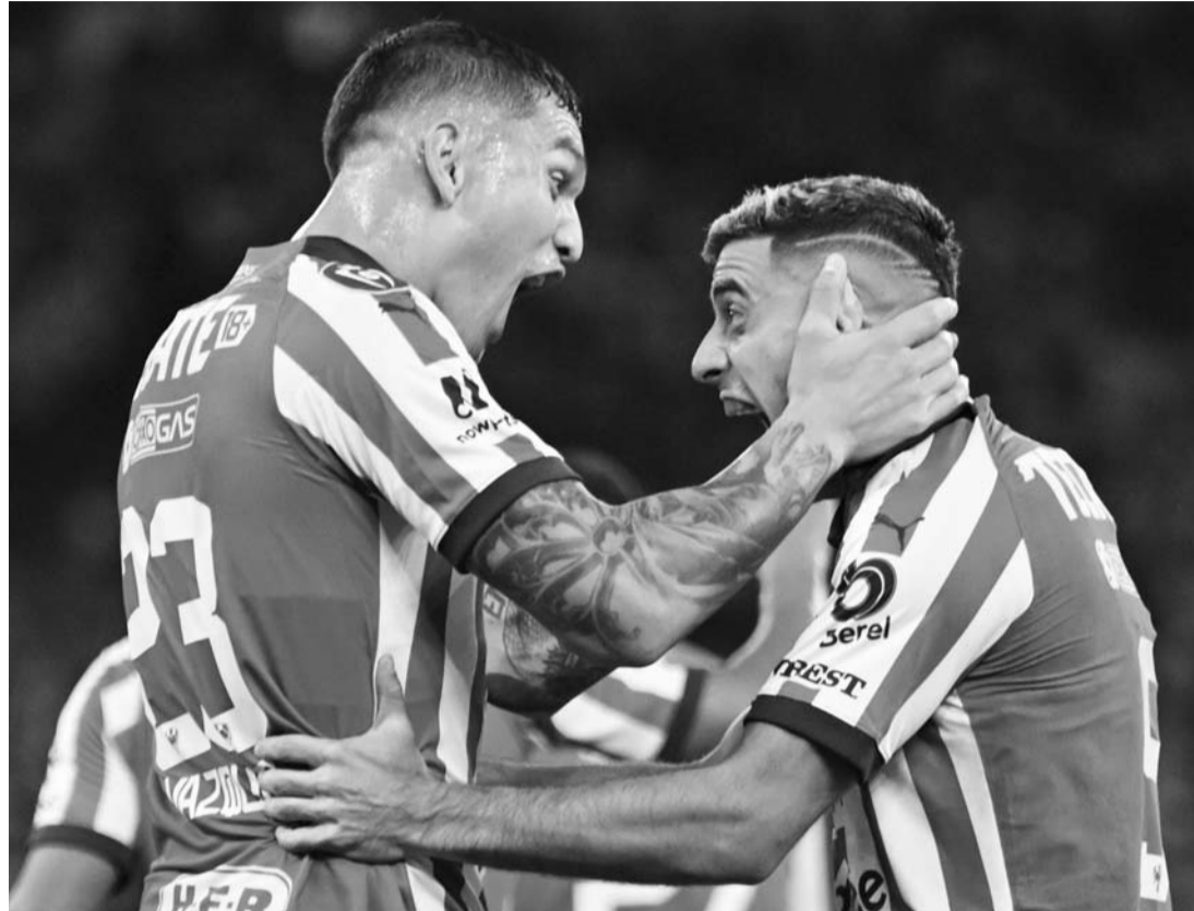
Monterrey buscará aumentar su hegemonía.

Con todo esto, los Rayados buscarán mantener su hegemonía ante los clubes de la MLS cuando los enfrenten en la ronda de las semifinales de la