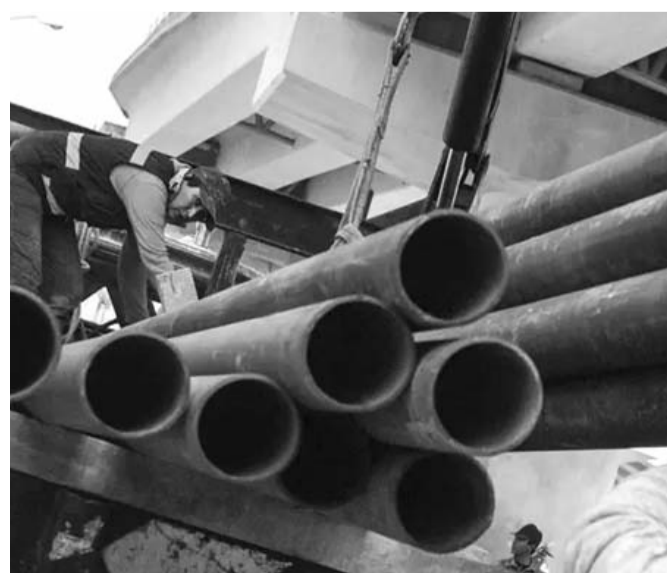
Es a productos de acero, aluminio, textiles, confección, calzado, madera, plástico y sus manufacturas.

A productos de acero circular con diámetro inferior a 14 milímetros le impusieron un arancel de 50%, entre otros productos. Los aranceles entrarán en vigor a partir de mañana por un periodo de dos años contados a partir de la fecha de publicación.