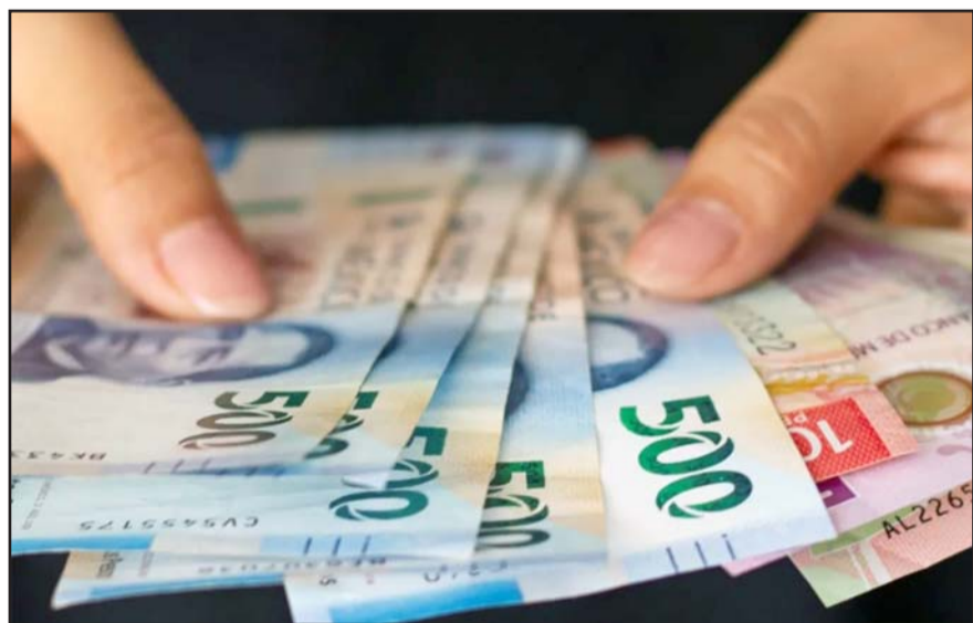
Es parte del boom económico que se vive en la entidad.