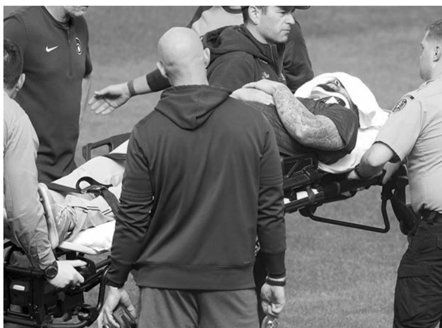
Alrededor de 20 minutos duró tendido en el césped.

Desde su debut en las Mayores con Kansas City, el 12 de abril de 2017, Junis tiene marca de 38-45 con efectividad de 4.63 en ocho temporadas divididas con Royals, San Francisco Giants y Milwaukee.