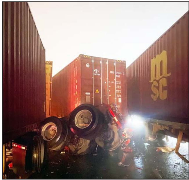
La circulación fue reabierto después de permanecer todo ese tiempo cerrada.