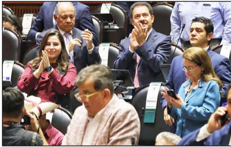
La minuta fue turnada a la cámara de senadores para su análisis y votación.

El debate se retomó el lunes en punto de las 14:22 horas, luego de que el pasado miércoles la sesión quedó suspendida por un "error", cuando el dictamen a discusión era distinto al que había aprobado la Comisión de