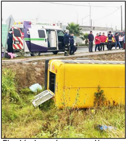
El vehículo cayó a un canalón.

En cuanto al vehículo en que viajaban las personas, quedó asegurado por las autoridades y fue llevado en una grúa al corralón correspondiente.