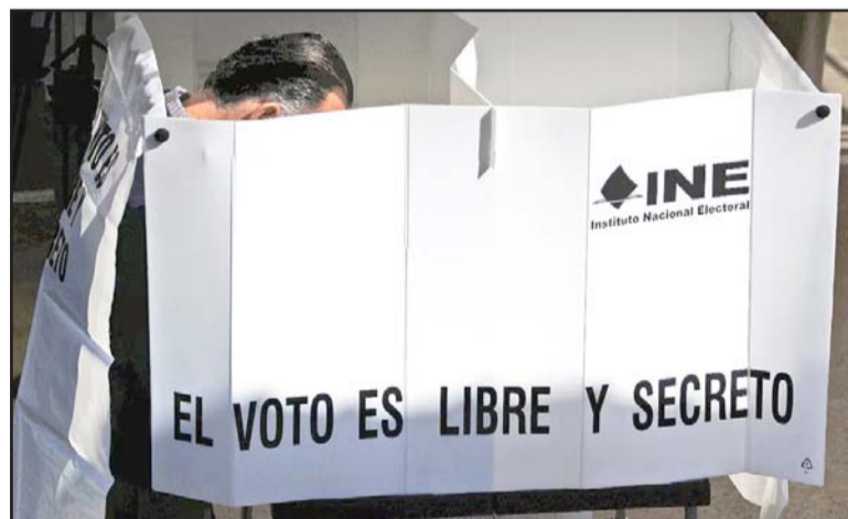
Se estableció que 20,964 casos con inconsistencias leves podrán ser reincorporados a la Lista Nominal del Extranjero.

El proyecto deberá ser avalado por las comisiones unidas del Registro Federal de Electores y