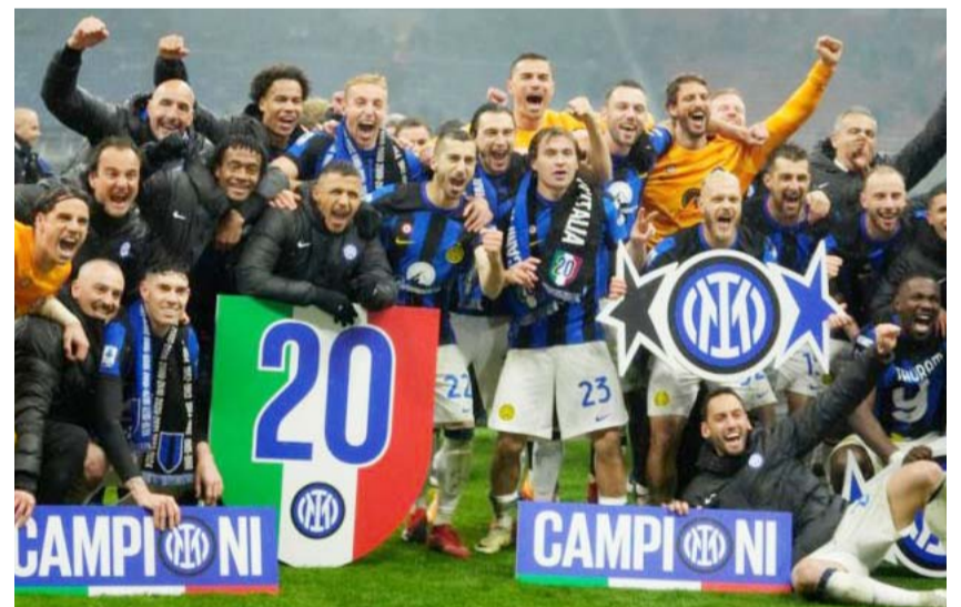
Inter de Milán alcanzó su vigésimo cetro.