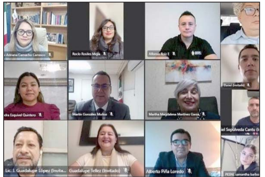
Entre esos están candidaturas del Partido del Trabajo y Morena.

Por último, también se acreditó a la Coalición SHHNL el registro de planillas para Cerralvo, Dr. González, Guadalupe, Iturbide, Melchor Ocampo, Mina, Monterrey, Rayones, y Salinas Victoria.