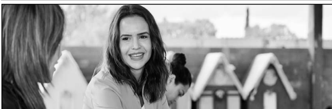
Propuso que las órdenes de restricción por violencia de género oncluya a los animales