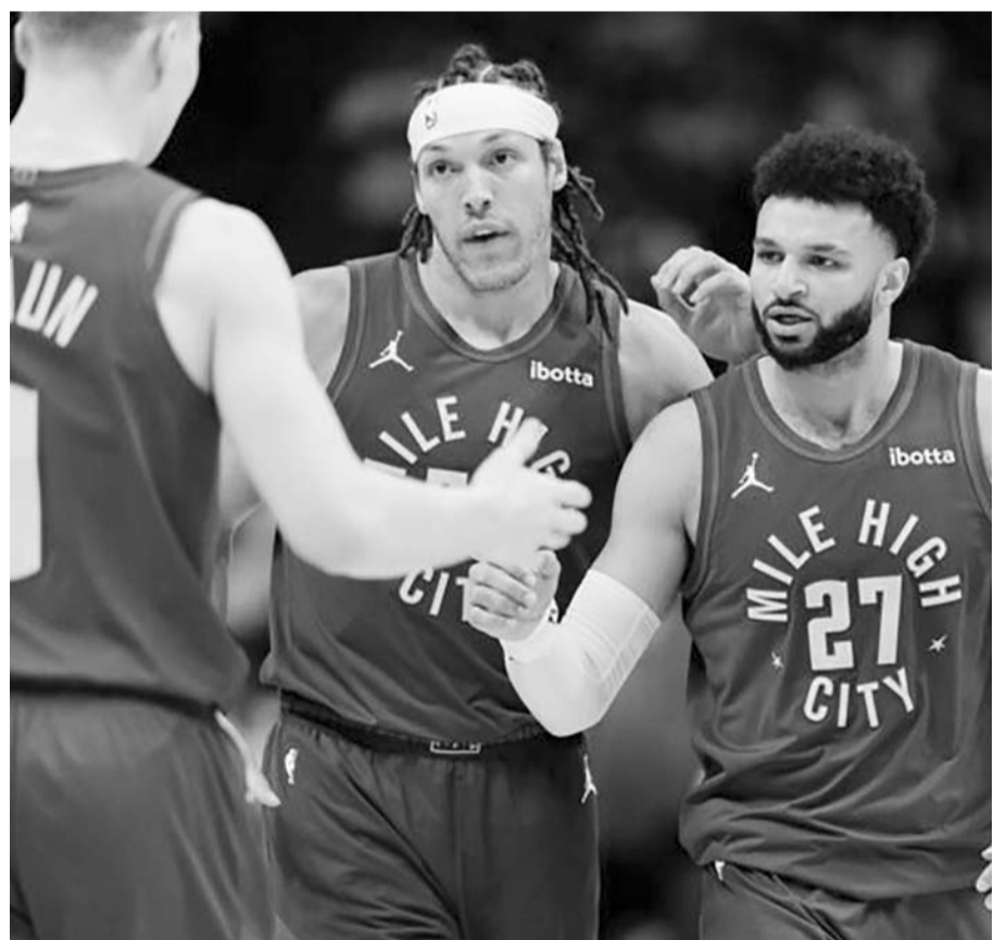
Nuggets de Denver venció anoche a los Lakers de Los Ángeles 101-99.

Murray terminó con 20 puntos, incluidos 4 en el cuarto periodo, y Nikola Jokic registró un triple-doble con 27 unidades, 20 tableros y 10 asistencias.