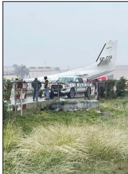
Aseguran que perdió los frenos.

De manera repentina el conductor perdió el control del volante, se salió de la carpeta asfáltica y cayó en un canalón.