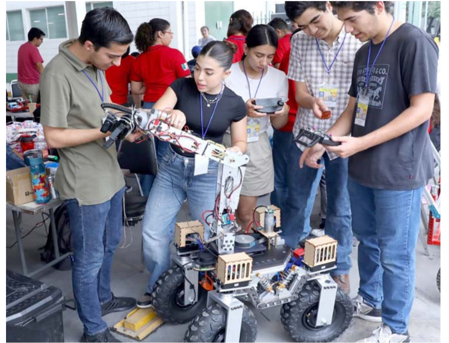
Más de mil participantes nacionales y extranjeros compartieron y se divirtieron con sus prototipos en robótica.

Colegio Bilingüe "Salvador Novo" también dieron muestra de sus conocimientos tecnológicos en la categoría Roboline Kids.