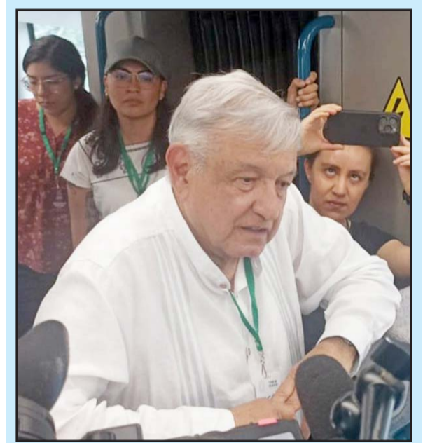
Se modificó el proyecto original para evitar la perforación de cenotes.

A su vez, también se estableció tomar recursos de la extinción de la Financiera Nacional de Desarrollo Agropecuario, Rural, Forestal y Pesquero, y del pago de adeudos al ISSSTE por cuotas y aportaciones de los estados, municipios, dependencias y entidades de los gobiernos locales, así como los ingresos de la enajenación de inmuebles propiedad del mismo instituto y los ingresos pagados por los créditos fiscales federales propios que realicen las entidades federativas, sus municipios o cualquiera de sus entes públicos.