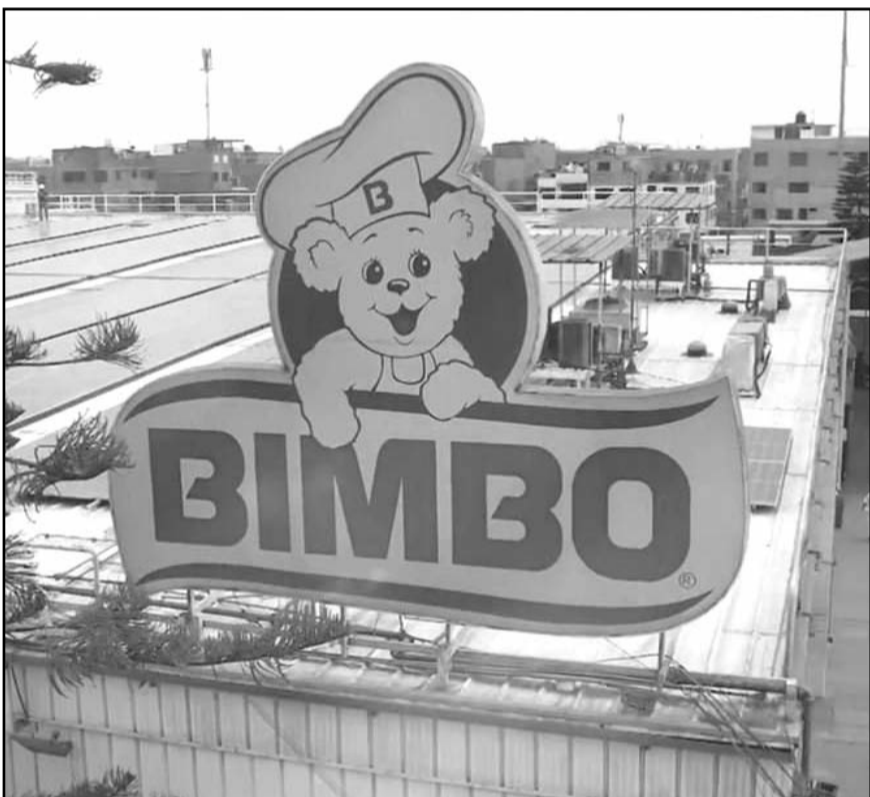
Grupo Bimbo fue impactada en sus resultados del primer trimestre del año por el superpeso, con ventas por 93 mil 221 millones de pesos, una caída de 0.3%.

De esta forma, a tasa anual y con cifras ajustadas por estacionalidad, el Indicador Global de Actividad Económica creció 2.6% en febrero pasado. Por grandes grupos, las agropecuarias aumentaron 5.8%; mientras que las industriales lo hicieron en 1.5% y los servicios, 3.2%.