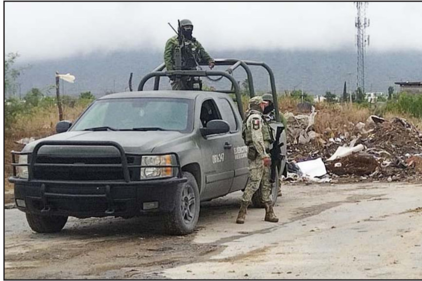
Los agresores se dieron a la fuga y no han sido identificados.

Los efectivos ministeriales interrogaron a vecinos del sector, sobre los hechos violentos suscitados la tarde del lunes.