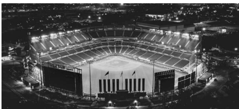
La serie se jugará hoy, mañana y el jueves.

izquierdo. Se unió al zurdo DL Hall, quien entró en la lista de lesionados debido a un esguince en la rodilla izquierda, el domingo.