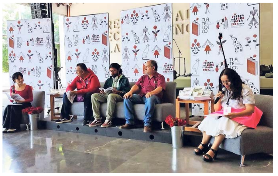
Punto Neutro es una reflexión de la violencia en México, dijeron.

El libro puede ser adquirido en línea y en las instalaciones del CCU.