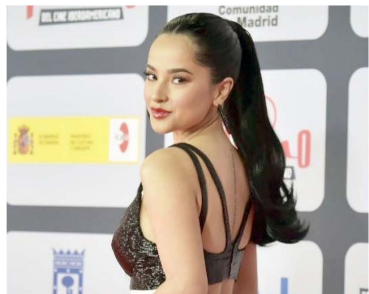
La joven de 27 años y de ascendencia mexicana, además deleitará con una actuación especial.

"Ser la anfitriona y actuar en los Latin AMA, justo después del lanzamiento de 'Mercedes', es como sumergirse en un torbellino de emociones y creatividad", expresó Becky G en un comunicado de prensa. "Es una celebración tanto de los logros pasados como de las aspiraciones futuras, todo ello encapsulado en un vibrante evento que honra nuestra música".