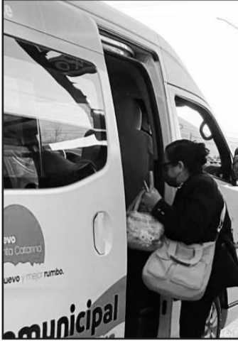
Ha sido un gran éxito.

En pro de la movilidad integral de los habitantes de Santa Catarina, desde esta semana el Ayuntamiento concretó ampliar las rutas intramunicipales con el programa "Bus Intermunicipal".