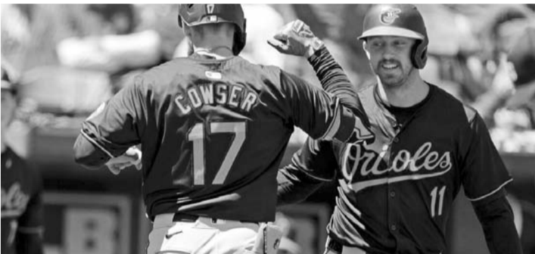
James McCann y Colton Cowser batearon jonrón y Adley Rutschman produjo dos carreras por los Orioles.

Ryan comentó durante la conferencia de prensa, que es un honor ser mencionado entre los mejores atletas de Atlanta, incluidos Dominique Wilkins, Chipper Jones y "nombrar a cualquier lanzador de los Braves".