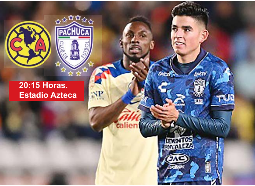
Las Águilas reciben al Pachuca en la ida de las semifinales.