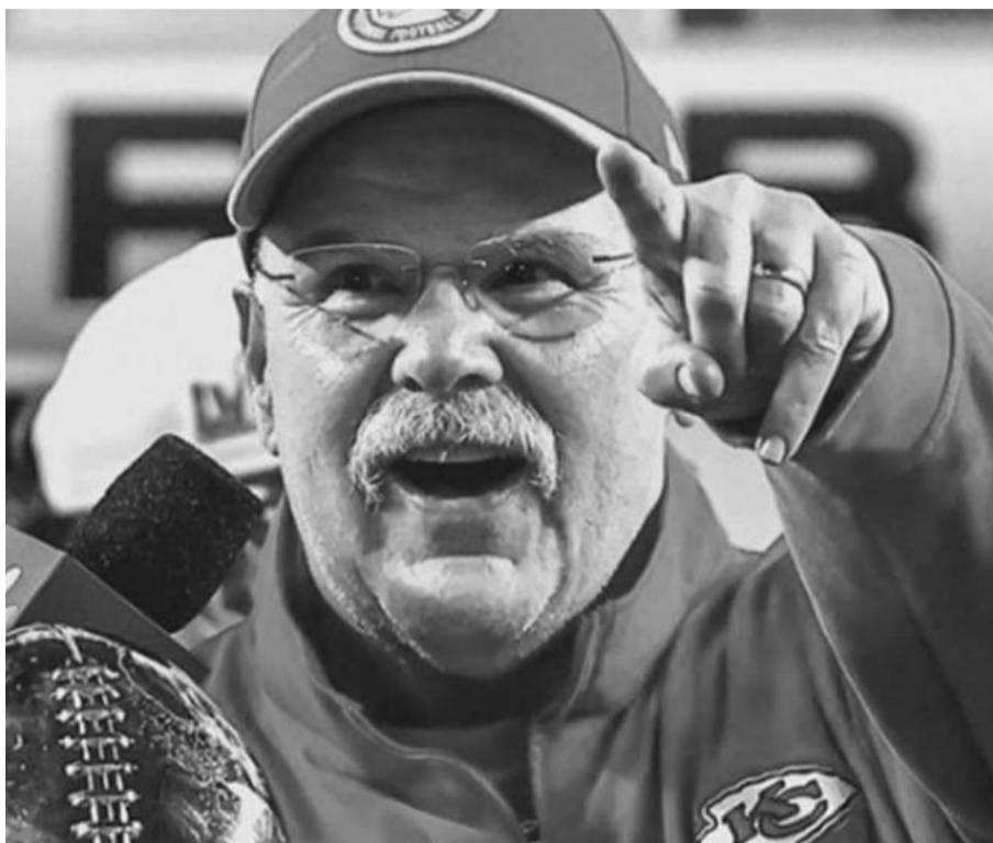
Andy Reid, el campeón de la NFL.

Clark y con toda la familia Hunt por darme la oportunidad de liderar a esta franquicia histórica", comentó Andy Reid en un comunicado. "Ha habido tanta gente que ha contribuido en nuestro éxito y en los Super Bowls, y agradezco mucho a los jugadores, entrenadores y todo el equipo de trabajo que ha invertido su tiempo en este proceso".