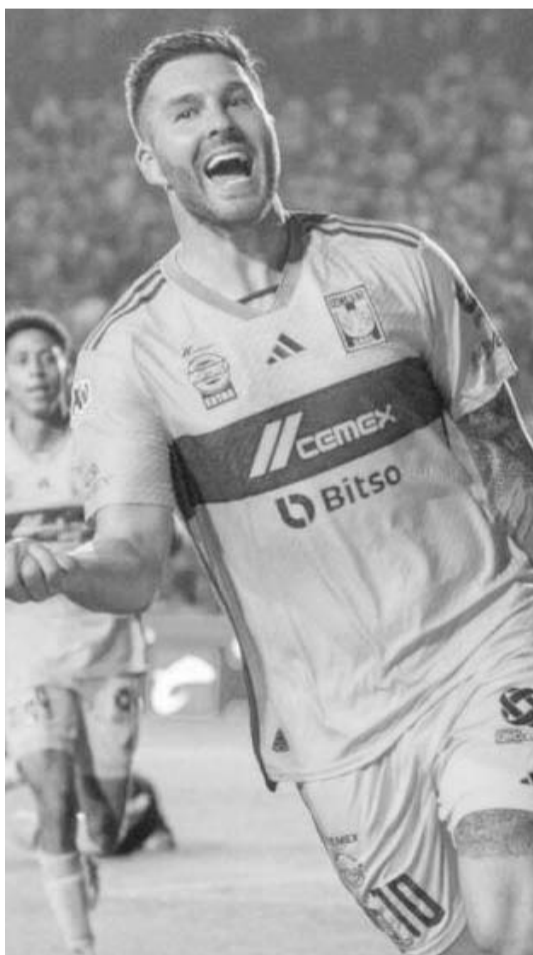
André Pierre Gignac.