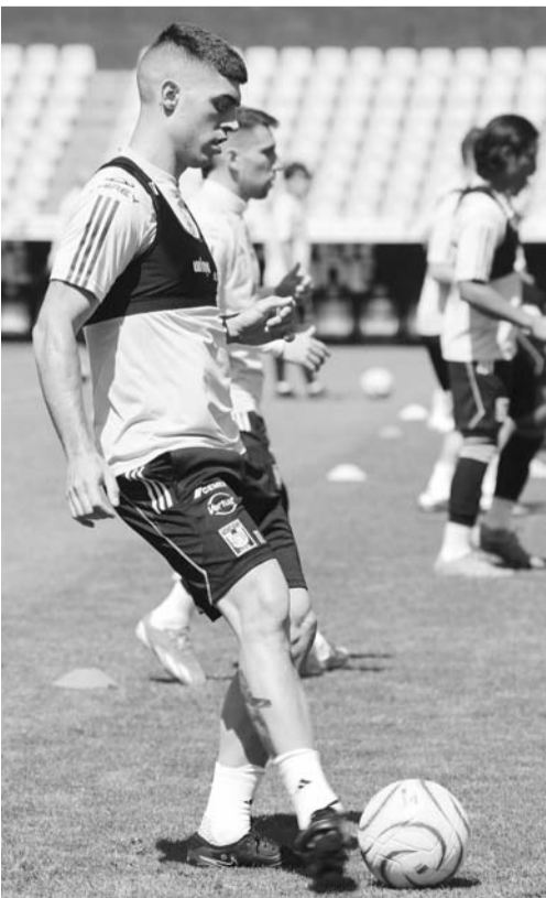
Los felinos, a cerrar fuerte.

En tanto, otro que se recuperó fue Javier Aquino, sin embargo, no podrá ver acción ante los fronterizos debido a que aún sigue expulsado tras reclamos al finalizar el Clásico Regio. (AH)