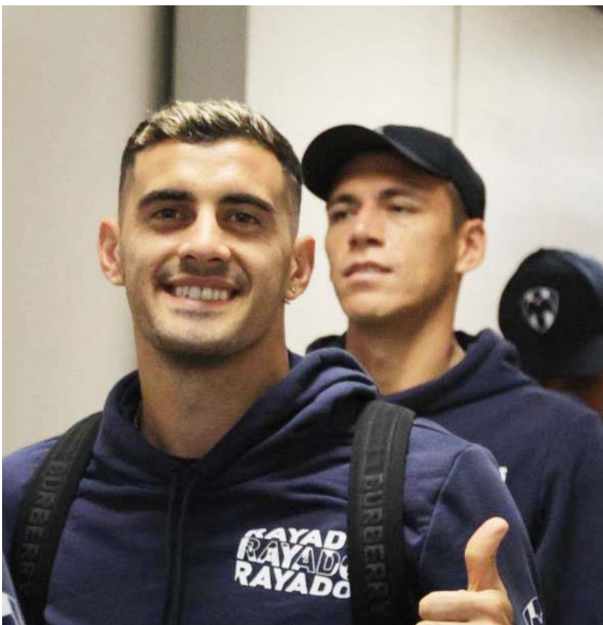
Monterrey juega mañana ante Columbus Crew.

Será este martes cuando Rayados haga reconocimiento de cancha del Estadio Lower.com Field, el duelo será el miércoles en punto de las 18:15 horas.