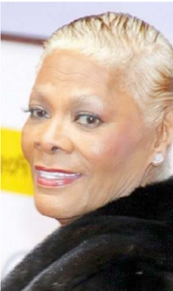
Cher, Ozzy Osbourne, Dionne Warwick y la banda Foreigner, entronizados.

algunos de los nombres previamente nominados, como el de Ozzy Osbourne, quien finalmente sí será admitido al selecto grupo de artistas por segunda ocasión, tras el ingreso de su agrupación, Black Sabbath.