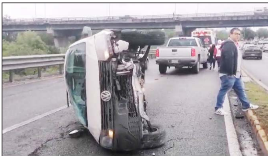
La conductora sólo resultó con lesiones leves.

El accidente se registró alrededor de las 21:30 horas del domingo, y al lugar arribaron elementos de Protección Civil del Estado, Monterrey, paramédicos de la Cruz Roja Mexicana y