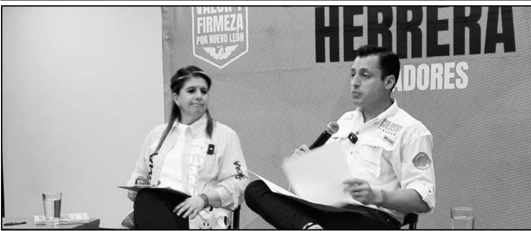
Lo dieron a conocer al presentar su quinto eje de campaña.