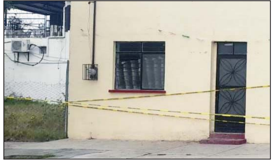
Los 12 trabajadores fueron secuestrados durante la madrugada del lunes

La Fiscalía General de Justicia abrió una carpeta de investigación para poder dar con el paradero de los presuntos responsables de la privación ilegal de la libertad, de los 12 trabajadores de una constructora.