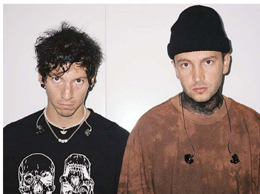
El dueto se presenta esta noche en el Lunario del Auditorio Nacional.

La serie marca su regreso a la comedia en tv en español tras más de 10 años. Su empresa, 3Pas Studios, es parte de la producción ejecutiva.