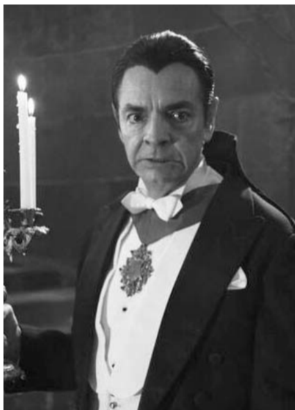
"Y llegaron de noche", es el nombre de la comedia de ViX.

Ahora, la distribuidora de contenido audiovisual explicó este martes, en un comunicado, con las primeras imágenes del comediante caracterizado de vampiro, que su nueva producción está