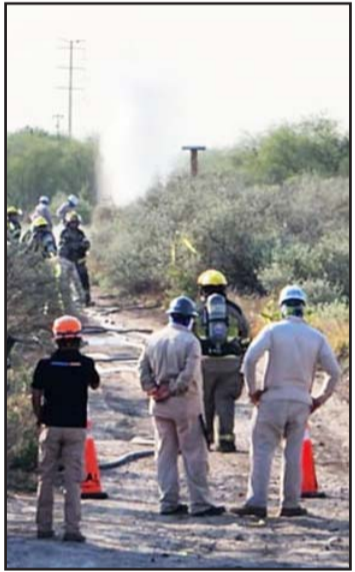
Municipio de Apodaca.

Indicaron que en un principio el acusado fue sometido por tener en su poder varios gramos de drogas.