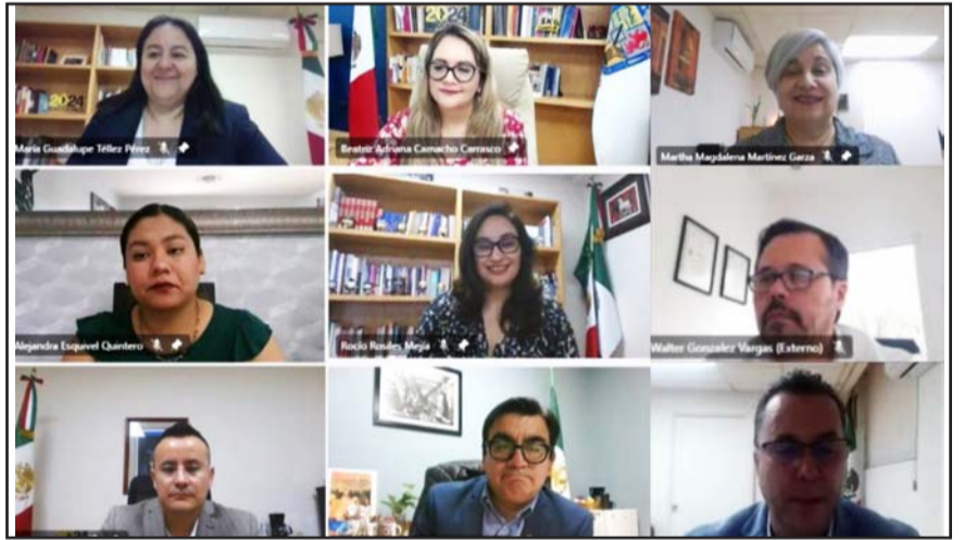
Se trata de las que se utilizarán para las diputaciones locales

Su quebranto constituye un delito en los términos del artículo 187 del Código Penal Federal y su correlativo 189 del Código Penal para el Estado de Nuevo León, por lo que el responsable será puesto a disposición de las autoridades competentes.