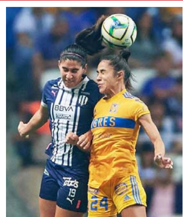
Coquetea otra final regia.

Por su parte, Monterrey dejó fuera a Pumas por global de 3-0 y ahora se verá las caras con las de la Bella Airoso con quien empataron a dos tantos en la temporada regular.