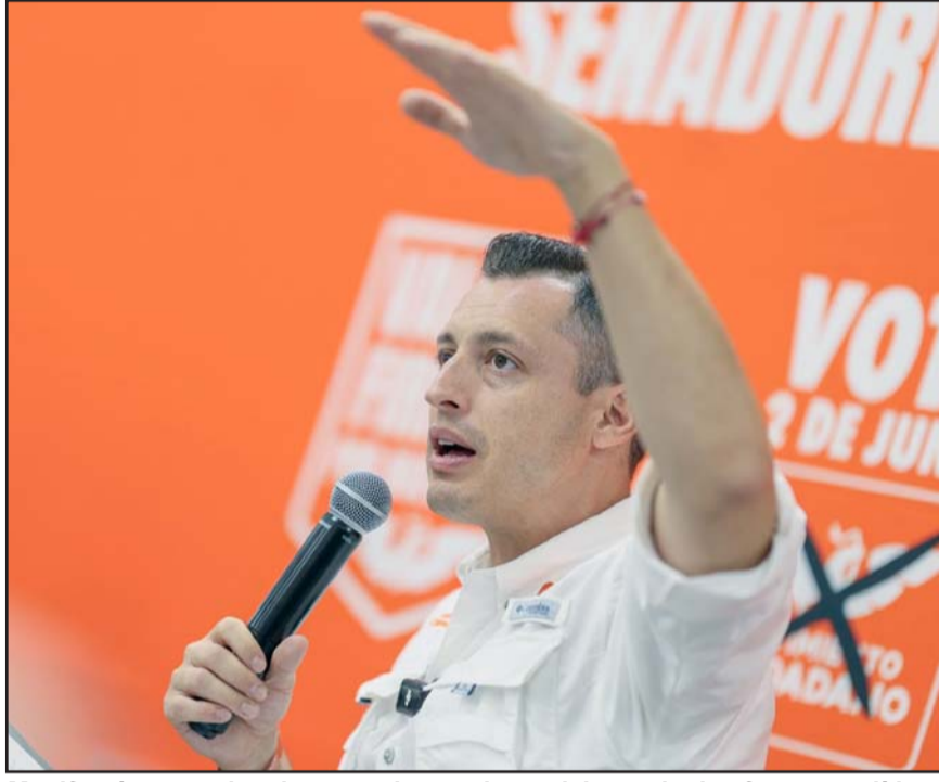
Manifestó que en las democracias maduras del mundo, las fuerzas políticas hacen acuerdos.

"Es hora de hacer política responsable, que ponga a la gente por encima de lo personal y dejar atrás la política de los caprichos, y de los revanchismos que sólo divide y que nada aporta".