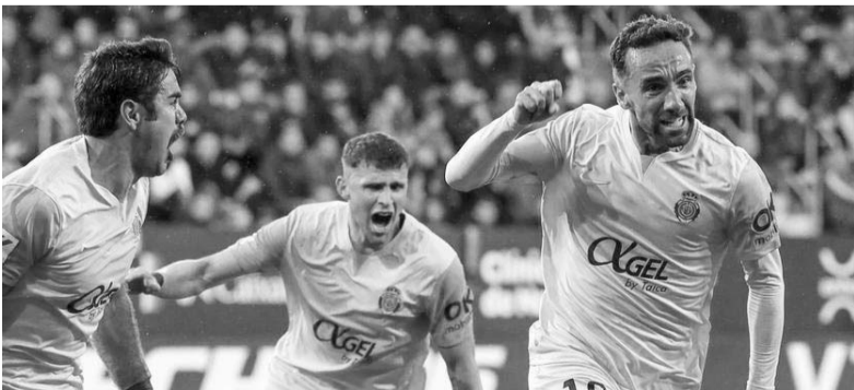
A Osasuna le faltó claridad en área rival.

Mallorca siguió buscando la victoria hasta que Hernández decretó el final.