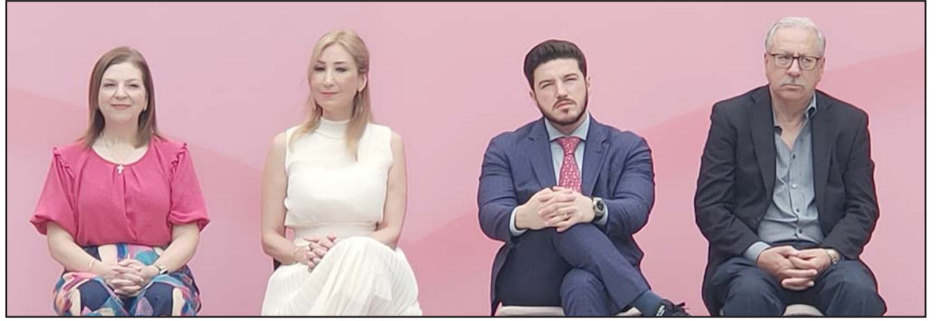
El mandatario dijo que será un lugar más grande y modernos para los niños y niñas.

Es de destacar que la administración estatal destinó en la adquisición de las nuevas unidades un monto total de 2 mil 244 millones 872 mil 033.52 pesos.