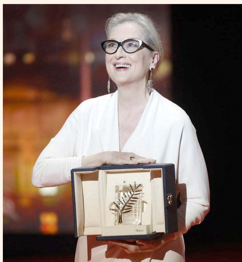
Meryl Streep recibe su reconocimiento en honor a su trayectoria, siendo el momento más importante de la inauguración del Festival.

Además de Gerwig, la directora libanesa Nadine Labaki, la actriz francesa Eva Green, el guionista turco Ebru Ceylan, el cineasta español Juan Antonio Bayona, el actor italiano Pierfrancesco Favino, el director japonés Kore-eda Hirokazu y el actor francés Omar Sy completan el equipo que decidirán qué película se hará con