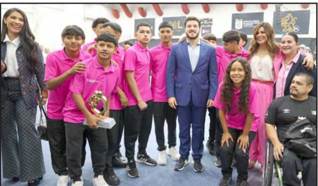
Se condecoró a 21 atletas, equipos y entrenadores con discapacidad, además de otros personajes deportivos