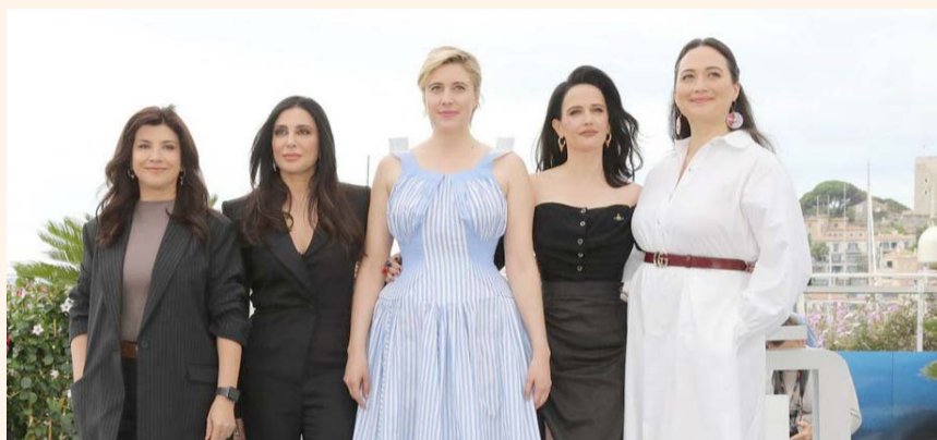
El jurado encabezado por Greta Gerwig posa en la alfombra roja.

terminada, no era una expectativa irreal para las actrices de esa época.