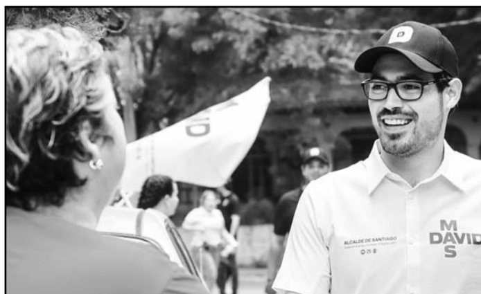
Lo primero es mantener un nivel óptimo en la presa La Boca

El político tricolor señaló que el embalse continuará recibiendo trabajos de limpieza y saneamiento para mantener un cuerpo de agua limpio y adecuado para el ecosistema de la zona.