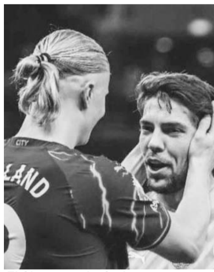
El City, a un triunfo de coronarse.