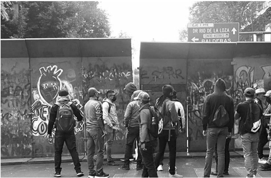
"Nos prometieron un diálogo hace 15 días y hoy llegamos por petición de ellos y nos encontramos con esto, no somos delincuentes".