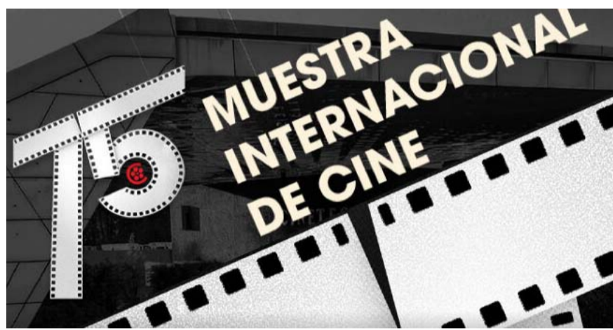
Se trata de una selección que ofrece un amplio panorama de cine internacional.

El destino lo unirá con un cineasta independiente que busca diversificarse, y con una actriz a quien éste intenta convencer de participar en su próximo