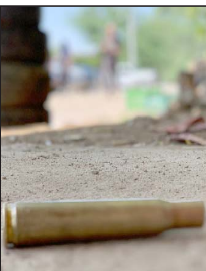
Cuatro días después de la masacre, la GN, el Ejército y los estatales ingresaron a Nueva Morelia.

Hace un año, comunidades cercanas a Nueva Morelia denunciaron la presencia de integrantes del crimen, que amenazaban con reactivar las operaciones en la Mina ampliación La Revancha, para extraer el sulfato de bario al 97% (barita).