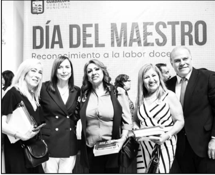
Se entregaron medallas por su dedicación y esfuerzo

Además, 58 docentes recibieron la Medalla “Profra. Martha Elva de León Treviño” por 40 años; y 13 maestros, la Presea “Prof. Serafin Peña” por 50 años; y acudieron 3 maestros a la celebración con más de 63 años de seguir labo-