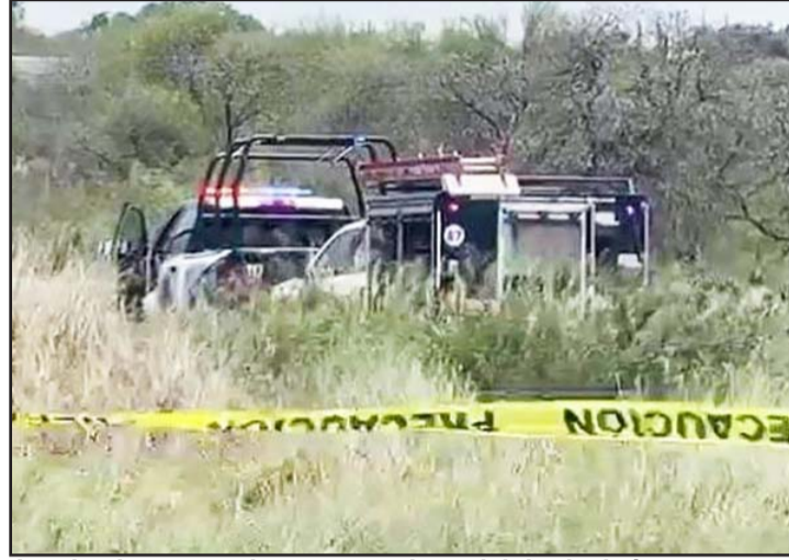
Los hechos se registraron en el municipio de Juárez.

En la revisión que se hizo del occiso se determinó que presentaba golpes en diferentes