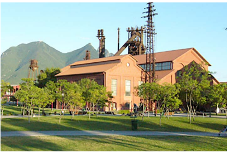
El programa abarca talleres, charlas, recorridos y más.

Ha sido galardonado con múltiples distinciones, entre las que destaca la Presea Nuevo León al Mérito Cívico en el área de investigación científica, el premio de la Asociación Nacional de Facultades y Escuelas de Ingeniería al Mérito Académico y el Premio de Ingeniería Civil otorgado por el Colegio de Ingenieros Civiles.