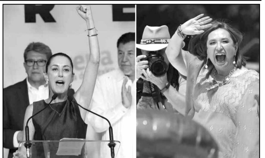
La calificadora Moody's dijo que el próximo gobierno deberá tener solvencia para mantener los programas sociales y la rentabilidad de Pemex.

Las propuestas de Claudia Sheinbaum sugieren una continuidad del dominio de la Comisión Federal de Electricidad (CFE) sobre el sector eléctrico mexicano, pero no hay planes específicos para expandir el suministro