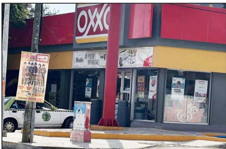
Los clientes desarmaron al delincuente.