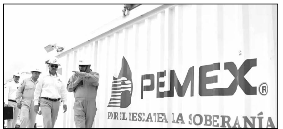
Aumenta el riesgo de degradación de la calificación crediticia de México,

En conferencia de prensa, explicó que con ello no se podrá reducir el déficit fiscal