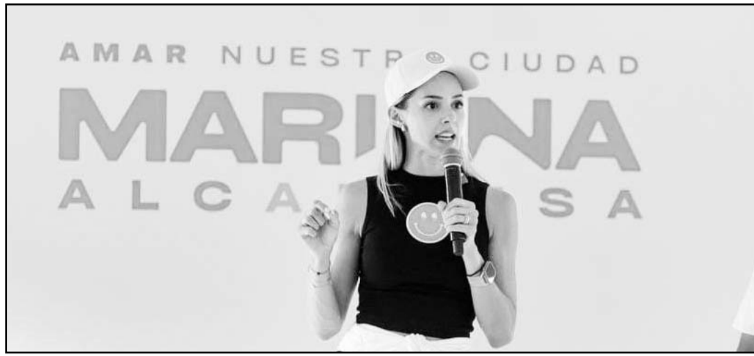
Dio por un hecho que los 10 grandes parques que hará tendrán internet.