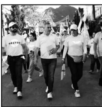
Presentó el proyecto.

El emecista explicó que el proyecto incluiría un sistema y bomba solar para que los espacios públicos reciban riego por goteo, explicó el aspirante de MC durante un recorrido casa por casa