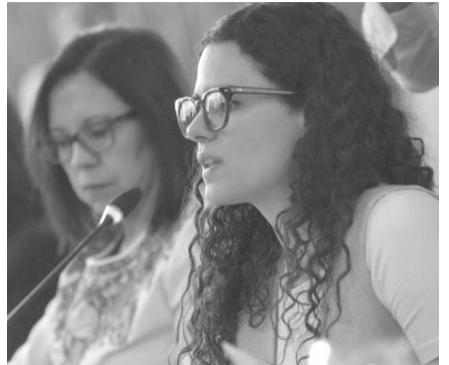
"Con respeto, hemos atendido las demandas de todas y todos y así lo seguiremos haciendo".