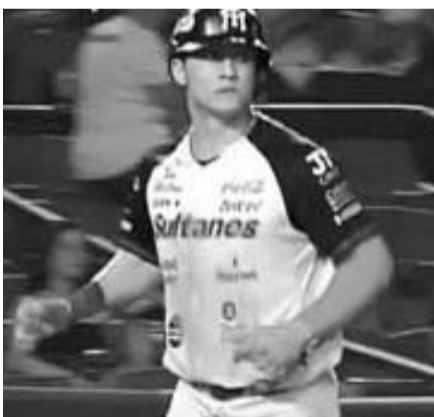
Sultanes cayó con Toros de Tijuana.