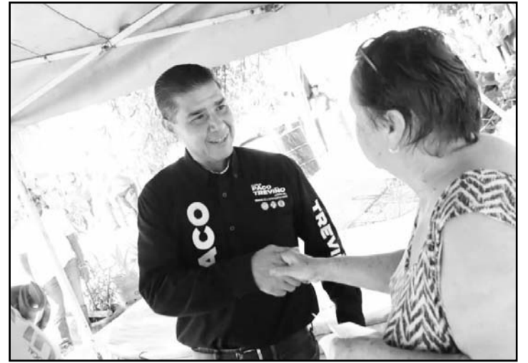
El candidato sigue con los recorridos por las calles.

"Hay que seguir con los programas sociales a través del DIF municipal, que les llegue de manera atinada a los adultos mayores que más lo necesiten, que más lo