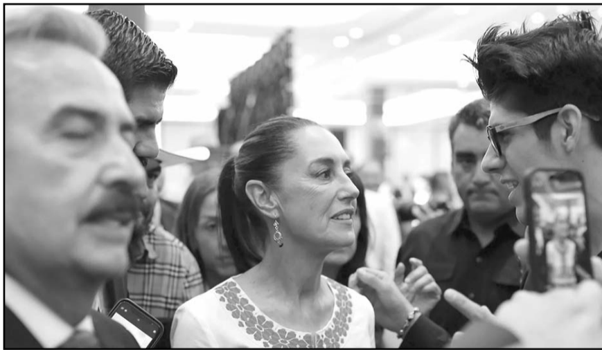
Ante empresarios aseguró que para los proyectos de la Cuarta Transformación se contempla capital privado.

"No le tenían amor a México, nosotros tenemos recursos naturales, historia, cultura y tenemos uno de los pueblos más trabajadores del mundo, que saca adelante la economía de la