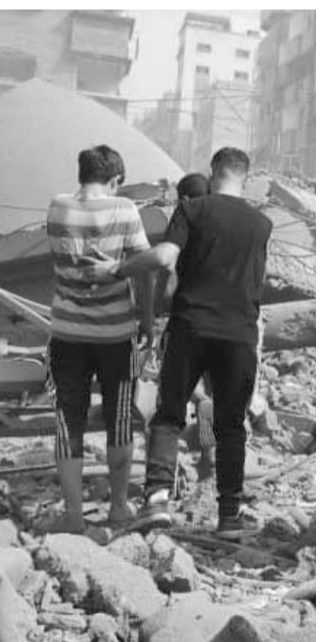
Siempre no retendrá el apoyo en armamento.

No obstante, el paquete global fue aprobado a pesar de la oposición de la izquierda, y el rival Partido Republicano apoyó casi unánimemente la venta de armas a Israel.