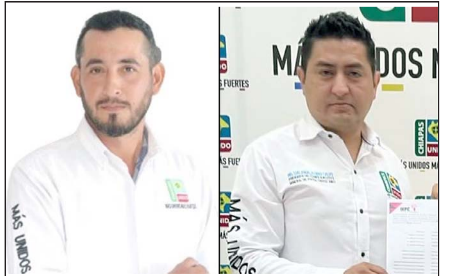
Los candidatos de Rayón y de Marqués de Comillas fueron atacados durante la noche del lunes y la madrugada del martes.

En medio de la espiral de violencia política - electoral el dirigente de Chiapas Unido pidió a los tres niveles de gobierno, a las autoridades electorales, así como a los dirigentes de los demás partidos que contribuyan a generar condiciones adecuadas para "que el ejercicio de la democracia se realice en plena libertad y en paz para que la ciudadanía acuda a las urnas".