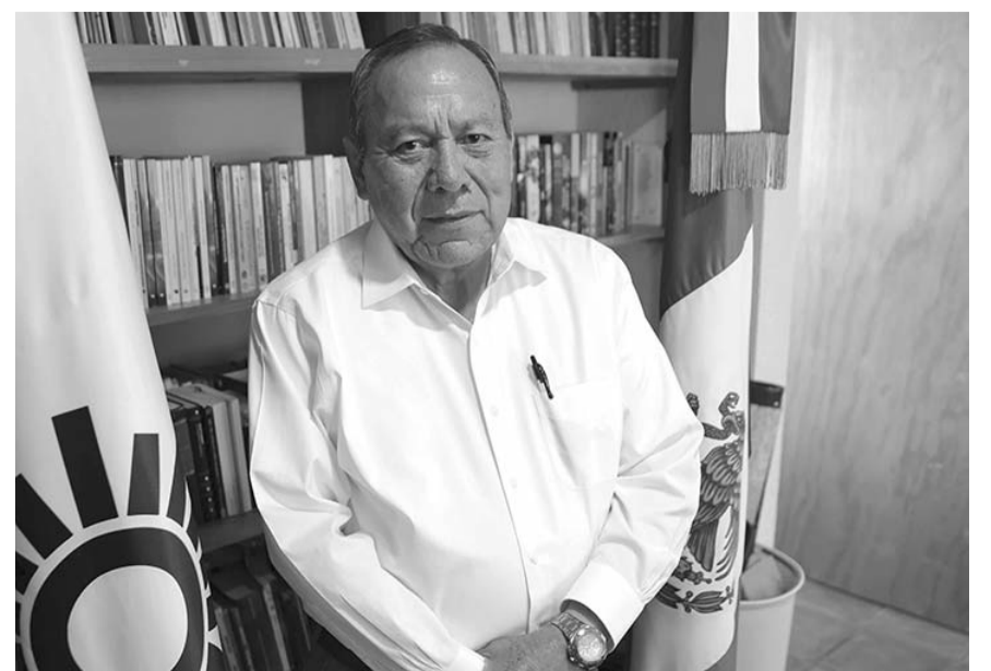
Las afirmaciones de que Jorge Álvarez Máynez está cada vez más cerca de Xóchitl Gálvez Ruiz son "absolutamente falsas".

—Preocupa la intervención de López Obrador y el aparato del Estado a favor de Sheinbaum para configurar la estrategia de una elección de Estado. Hay augurios muy preocupantes sobre cosas que se pudieran presentar, el de la violencia, queremos que se tomen todas las medidas de seguridad para que haya paz y tranquilidad. Puede haber apagones, lo hemos empezado a advertir, y ahora más con alguien que le conoce muy bien a esas cosas como Manuel Bartlett al frente de CFE, no hay que descartar nada.