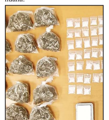
Parte de lo decomisado.

El presunto estaba sentado en las escaleras de un puente peatonal, cuando llegaron los elementos y pretendía darse a la fuga, momento en que fue interceptado, y al ser revisado le encontraron 60 bolsitas con hierba verde similar a la marihuana.