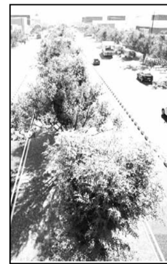
Presentó el proyecto.