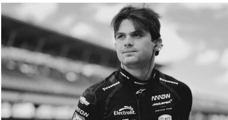
El mexicano fue el único integrante portador de un motor Chevrolet en el top 5 al cronometrar 224.993 mph.

Mayweather anticipó desde hace varias semanas vía redes sociales que tenía una sorpresa reservada para los fanáticos mexicanos este 15 de mayo con un gráfico en el que aparece 'Money' con los guantes calzados y el monumento al Ángel de la Independencia con la Ciudad de México de fondo.