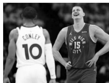
Denver aplastó a Minnesota.

Edwards se vio limitado a 18 puntos, al atinar cinco de 15 disparos. Karl-Anthony Towns lideró a los Wolves con 23 puntos, mientras que Rudy Gobert finalizó con 18. Con su primera racha de tres derrotas en la campaña, los Wolves disputarán el jueves un partido de vida o muerte en su casa del Target Center. Necesitan ganar para