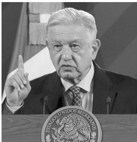
Se contará con todo lo necesario para los comicios.

"Precisamente con apagones, a la hora de que se empezaban a contar los votos, a las seis, siete, se apagaba la luz. Los mapaches de aquellos tiempos, que todavía ahí andan, tenían como práctica