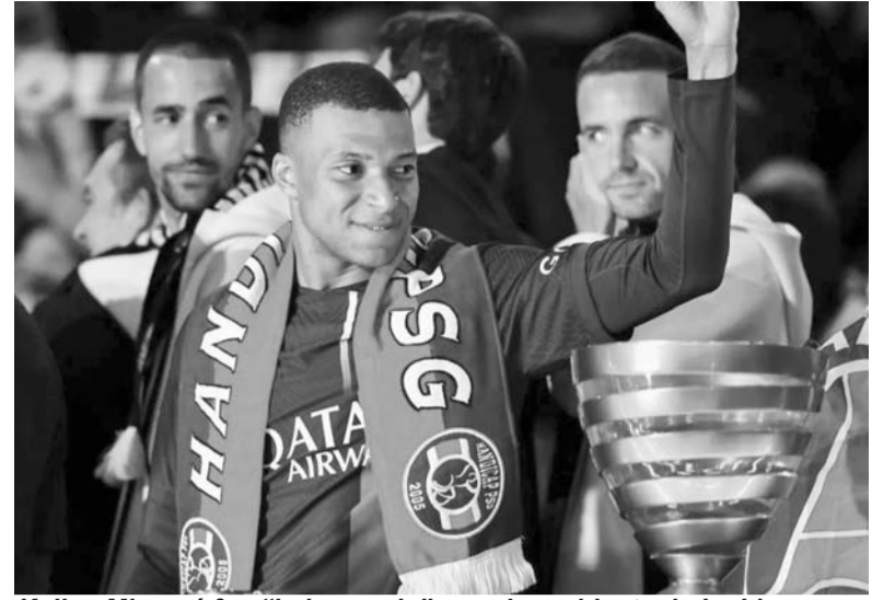
Kylian Mbappé fue "balconado" por el presidente de La Liga.