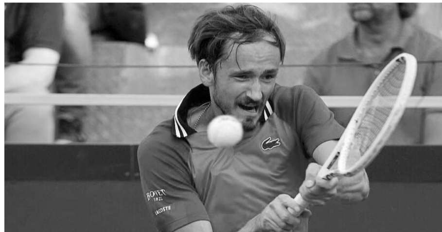
Daniil Medvedev, número cuatro del mundo.

"Creo que si Novak y Carlos juegan son grandes favoritos. Les gusta la superficie y ya ganaron Grand Slams. Pero