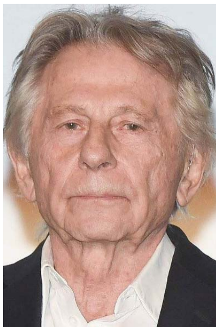
Su acusada se dijo decepcionada por el resultado y dijo que apelará.

El cineasta ha enfrentado otras acusaciones de agresión sexual a lo largo de décadas, incluido un caso notable de 1977 en el que fue acusado de violar a