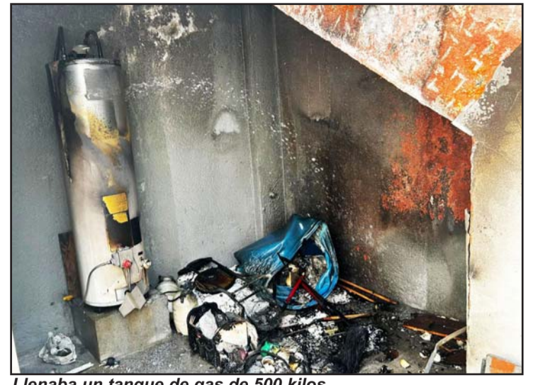
Llenaba un tanque de gas de 500 kilos.