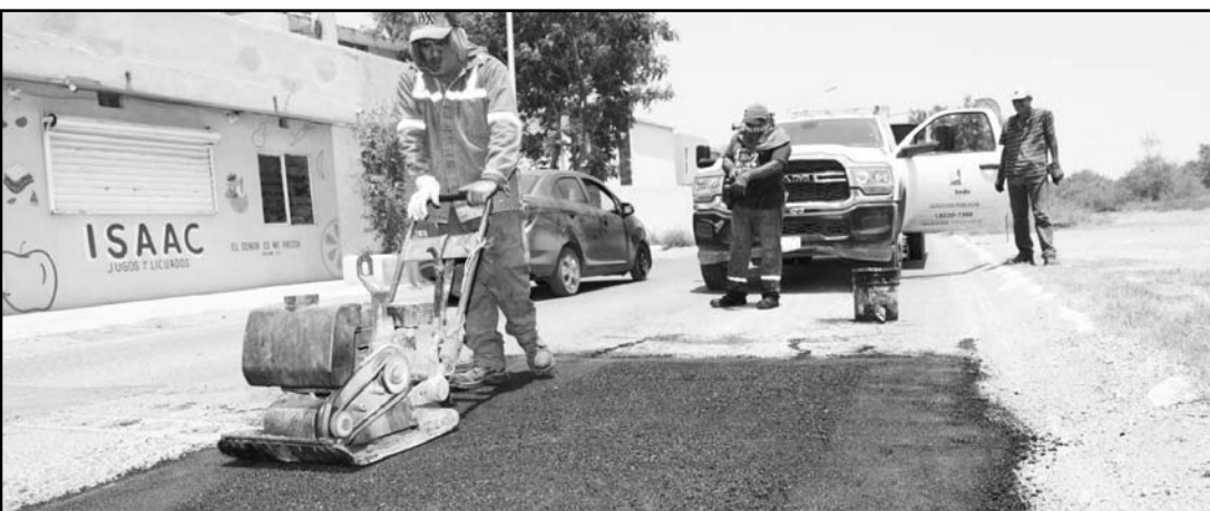
La idea es mejorar las condiciones en las que circulan los escobedenses.

El programa de bacheo es permanente y por ello la Secretaría de Servicios Públicos pone a disposición de la ciudadanía el teléfono 81 82 86 93 50, esto con la finalidad de que se realicen los reportes sobre desperfectos en la carpeta asfáltica y en beneficio de los automovilistas, y atenderlos a la brevedad.(CLR)