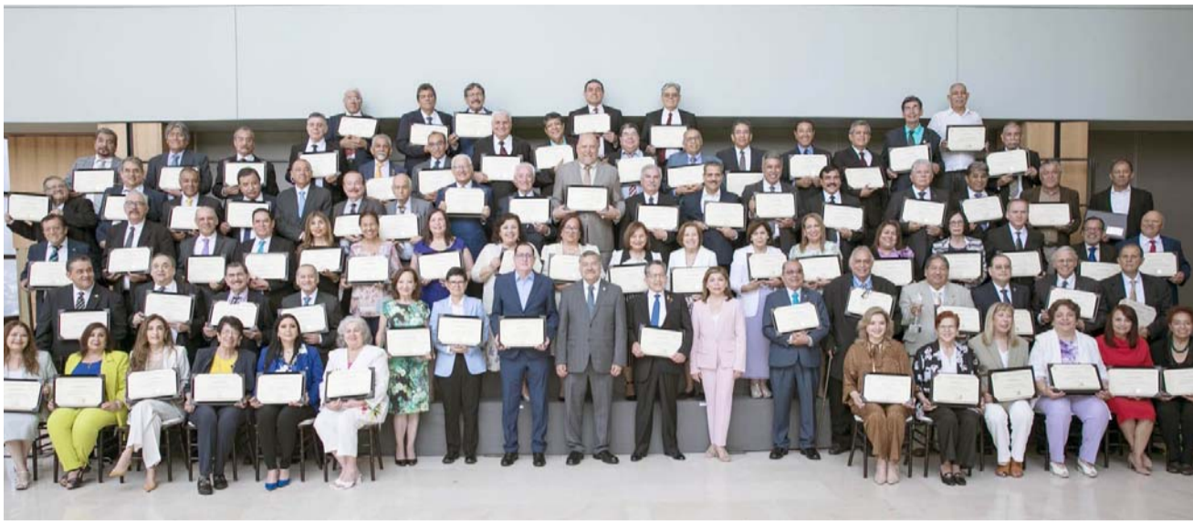
Un total de 101 catedráticos con 40, 45, 50 y 60 años de servicio, fueron reconocidos durante el evento.

“Gracias a la entrega y dedicación de todas y todos ustedes, nuestra Universidad ha podido seguir cumpliendo sus funciones sustantivas: la académica, investigación y la promo-