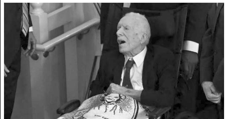
Carter se encuentra en un centro de cuidados paliativos.

Rosalynn Carter, quien murió en noviembre, unos seis meses después que la familia Carter revelara que padecía demencia, vivió sólo unos días bajo supervisión de un centro de cuidados paliativos.