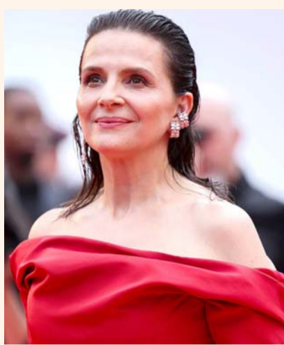
Juliette Binoche y Jane Fonda, a su arribo a Cannes.

"Cuando estuve aquí por primera vez ya era madre de tres hijos, estaba por cumplir los 40 y pensé que mi carrera estaba