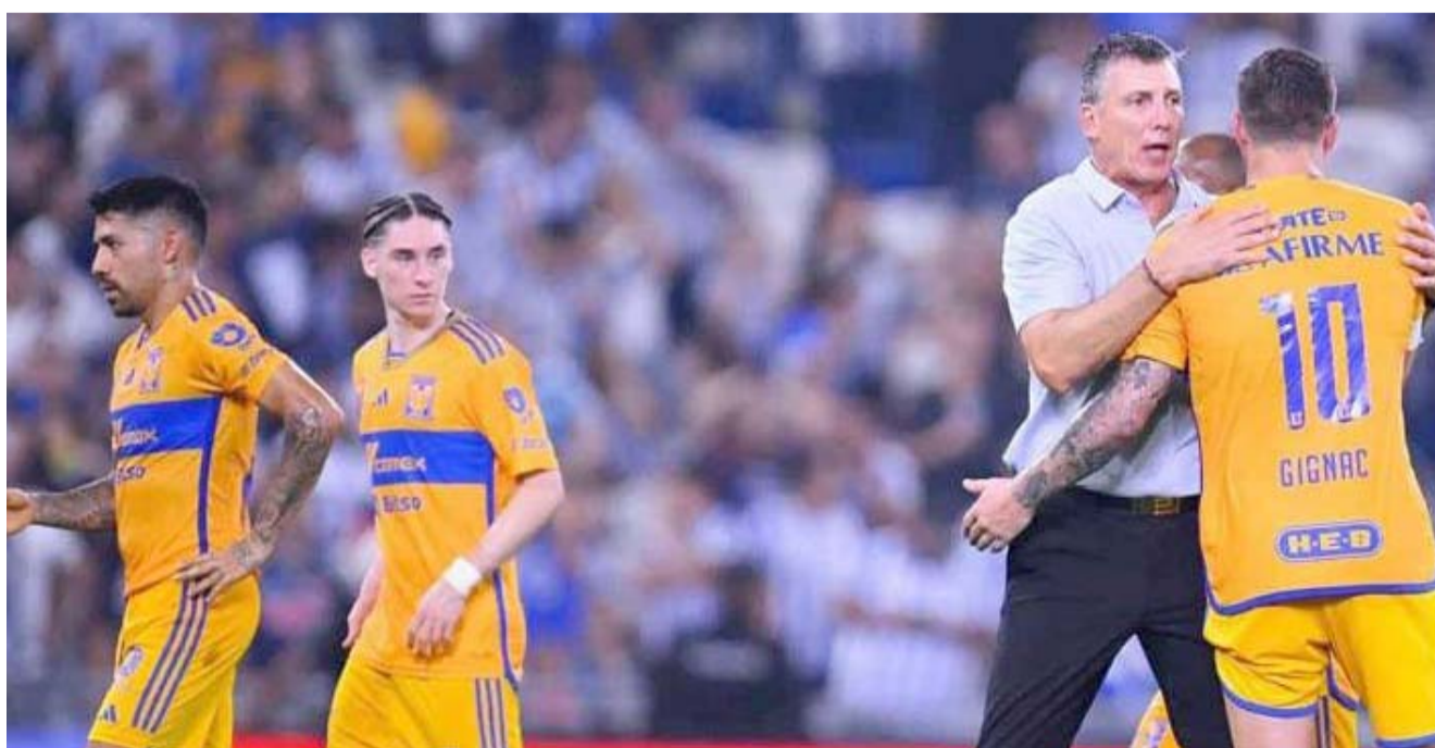
Tigres tendrá tres semanas de vacaciones.

La vuelta se llevará a cabo el domingo en el Estadio Ciudad de los Deportes, inmueble donde los albiazules le ganaron una Liga MX a la Máquina en el Apertura 2009 además de buscar llegar a otra instancia final, pues desde el Apertura 2019 que no llegan a una.