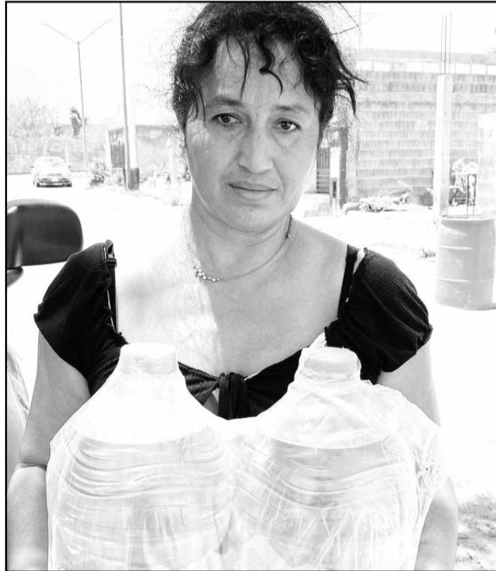
Los apoyos se entregaron del 9 al 13 del presente mes

Asimismo, las colonias Infonavit Huasteca, Lomas del Poniente, Cumbres de Santa Catarina, Indeco La Fama, Trabajadores, Centro de Santa Catarina, Privadas del Parque, La Conquista y Paseo de las Minas.