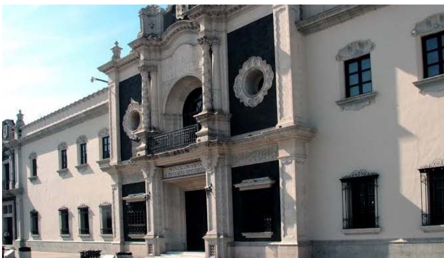
Son eventos para todas las audiencias, sin costo.

Finalmente, la Escuela Adolfo Prieto presenta la cápsula informativa Día Internacional de los Museos, con el objetivo de dar a conocer el tema de este año “Museos por la educación y la investigación”, en el que se subraya el papel fundamental de estas instituciones culturales.