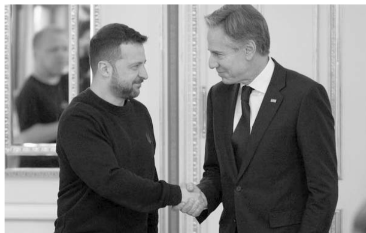
La ayuda viene en camino, dijo Blinken.