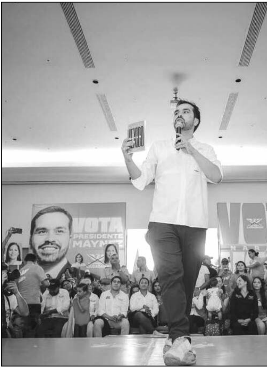
Reiteró su respuesta al dirigente nacional del PRI, Alejandro Moreno, sobre su declinación a favor de la llamada "marea rosa", e insistió en que no dejará su candidatura.

"Candidata: Basta de mentir. Más allá de sus encuestas pagadas, ustedes saben que el único que puede derrotar a Morena soy yo"