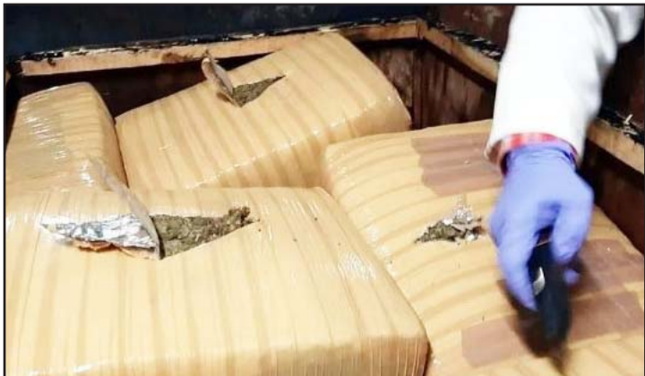
Se registró en una empresa de paquetería.

Además, fijó un plazo de un mes para cierre de investigación complementaria.