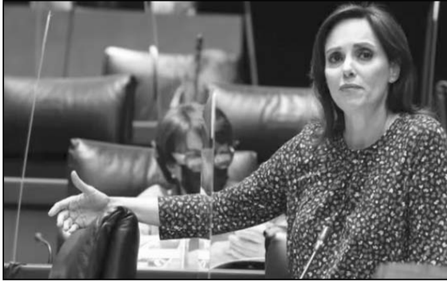
¿No fue AMLO el que le dijo 'cállate chachalaca' a Fox o algo similar? Pues ahora yo le digo a AMLO 'cállate pejelagarto'.

Por su parte, Kenia López Rabadán, jefa de la oficina de la candidata a la presidencia Xóchitl Gálvez, también expresó su solidaridad a través de su cuenta de X: "Querida Lilly Téllez, mi solidaridad y felicitación, lo estás haciendo tan bien que tienes a Morena siguiendo tus pasos y programas. En el INE deben entender que en elecciones se debe maximizar el derecho a la libertad de expresión en el debate público".