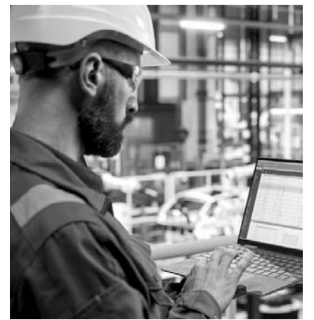
La inversión subió

Las cifras de la Secretaría de Economía señalan que 42% de la inversión registrada se concentra en el sector manufacturero, destacando las industrias de equipo de transporte.