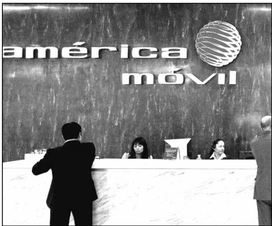
Las empresas de Carlos Slim recibieron multas de reguladores estadounidenses, ya que no solicitaron las aprobaciones adecuadas para sus operaciones.

"Los cables submarinos nos mantienen globalmente conectados y son una parte esencial de la economía