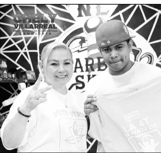
Ofrece una administración con cero corrupción