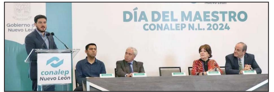
Hizo el anuncio de cara a la potencialización del nearshoring

Como era de esperarse, esta resolución fue impugnada y el miércoles la Sala Regional revocó la resolución y determinó que Guidi Kawas tenía que pedir licencia para dejar el cargo como diputada si quiere seguir como candidata a la alcaldía por el municipio de Linares.