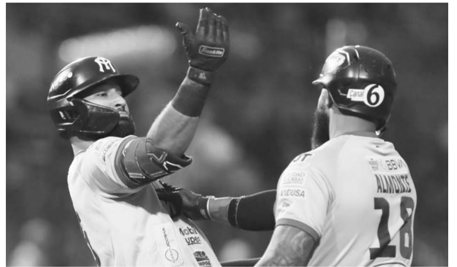
Los regios vencieron anoche a Tijuana 4-2.

Mientras tanto, los Sultanes de Monterrey van a tener este viernes, además de mañana y el próximo domingo, una serie de tres juegos en casa ante los Charros de Jalisco.