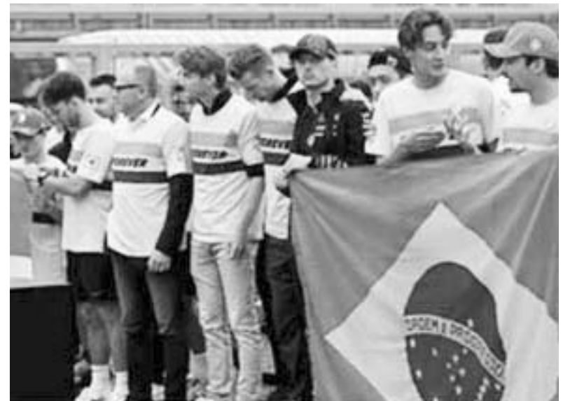
El homenaje fue emotivo en Imola.

Cabe señalar que Ayrton es un histórico para la Fórmula 1 ya que ganó un total de tres Mundiales de Pilotos, siendo estos con Williams y McLaren en los años 80s y 90s.