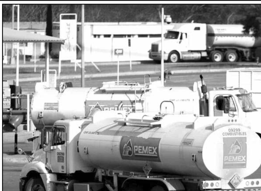
El flujo de caja de la compañía es una de las causas del problema, luego de un primer trimestre de 2024 en el cual se redujeron sus ganancias en 92%