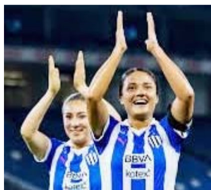
Monterrey, a aprovechar localía.

De conseguir una ventaja en esta semifinal de ida, las Rayadas se irían más tranquilas al duelo de vuelta del próximo lunes, que será en el estadio Hidalgo de Pachuca, donde buscarían instalarse a la disputa de la corona y todo esto ya sea en contra de Tigres o América.