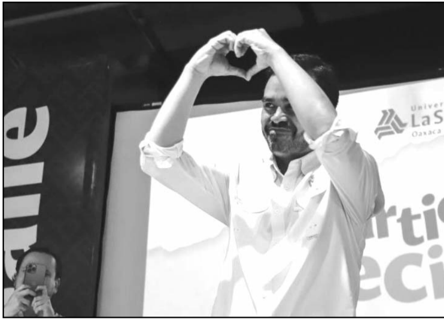
Jorge Álvarez Máynez llamó a los jóvenes a salir a votar el próximo 2 de junio.

Durante la charla, los jóvenes cuestionaron al candidato de Movimiento Ciudadano (MC) sobre por qué deberían votar por él y no por sus contendientes, a lo que el zacatecano