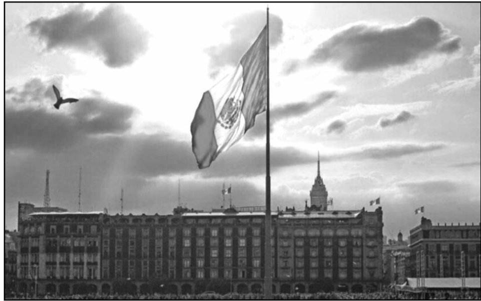
"Y no hay mala intención, no hay mala fe. La Bandera es de todos los mexicanos, nada más que tenemos que cuidarla porque es nuestro símbolo".

El presidente López Obrador confirmó que las vallas metálicas de casi tres metros que protegen Palacio Nacional permanecerán hasta pasadas las elecciones del próximo 2 de junio, pues acusó que "hay mucho provocador extremista".