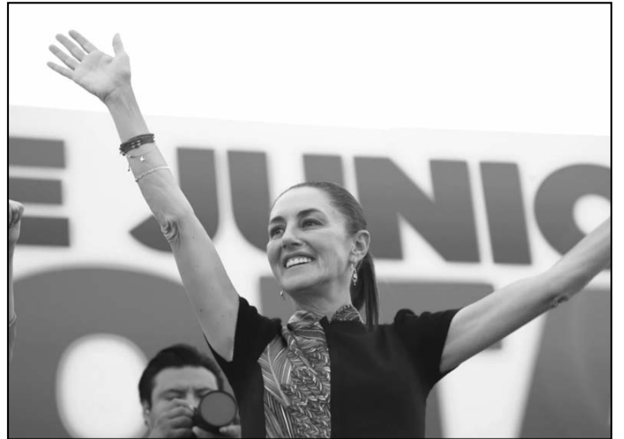
Claudia Sheinbaum, aseguró que ya ganaron la campaña y los debates, por lo que pidió a la ciudadanía "abarrotar" las urnas de votos en favor de los partidos Morena, PT y PVEM..

Aseguró que la agenda que representa la "defenderemos entre todos porque se va a necesitar, porque no se van a quedar cruzados de brazos quienes representan los privilegios o intereses que están detrás de esos problemas de México.