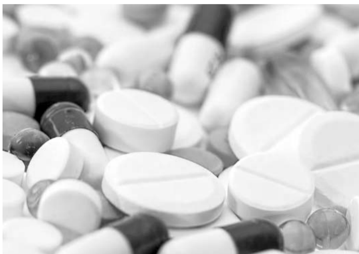
Se involucraron en tráfico de fentanilo, metanfetamina y cocaína.

En un comunicado de la Oficina de Asuntos Públicos, del Departamento de Justicia, se informó que el agente encubierto tam-