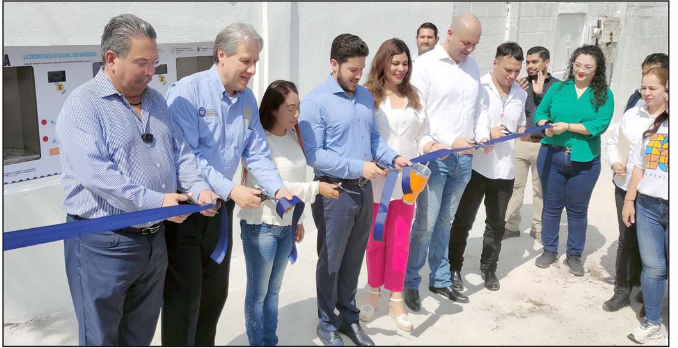
Se cortó el listón inaugural del primero ubicado en Fomerrey 35 de donde se dispondrán 5 mil garrafones diarios

“La vez pasada salí diciéndolo enojado, y ahora lo voy a decir contento, porque ellos son los malos, y los buenos siempre ganamos, en todas las películas siempre ganamos los buenos”, aseveró.