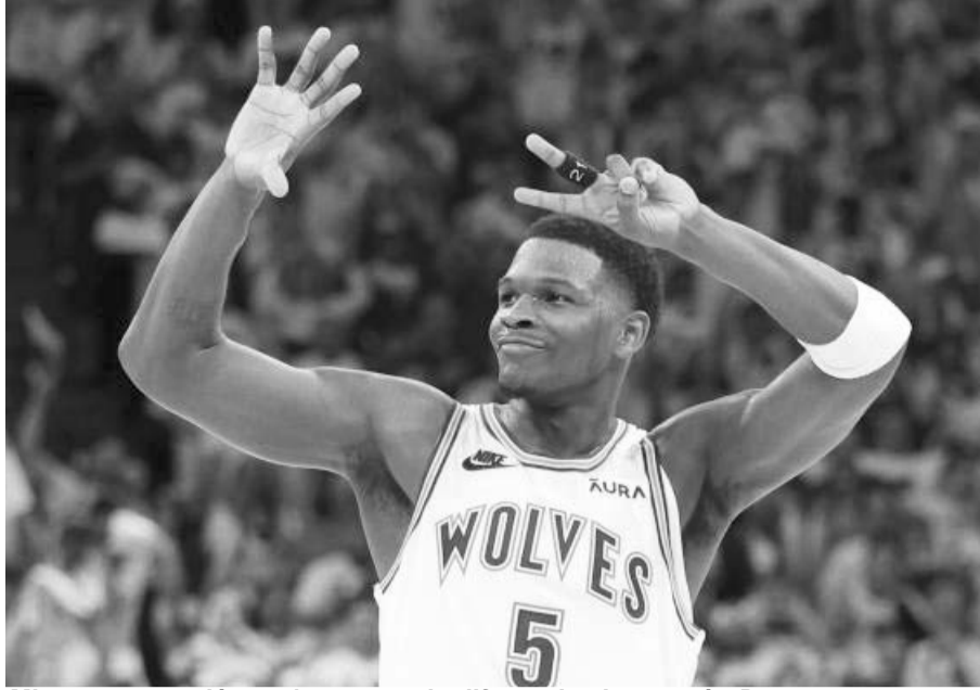
Minnesota venció por 45 puntos de diferencia al campeón Denver.

El encuentro decisivo por el pasaje a la final de la Conferencia Oeste está pausado para el domingo en Denver.