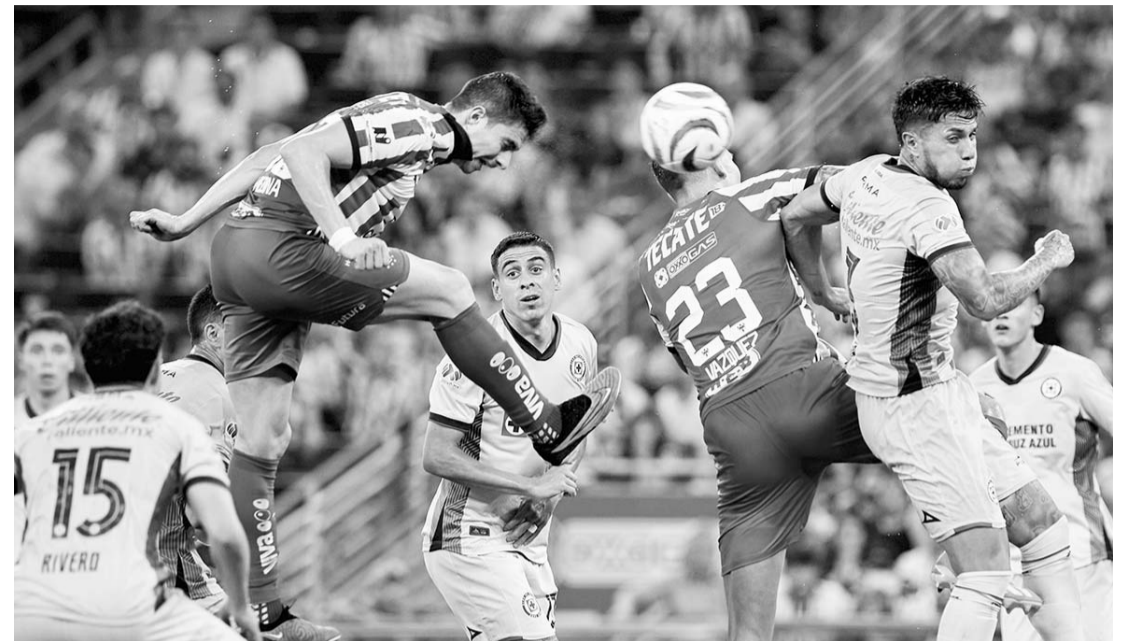
Rayados careció de contundencia en su ataque.