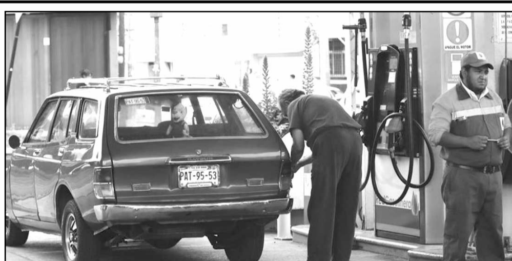
La Cofece multó con 58 millones de pesos a seis empresas que venden gasolina y diésel en el país.