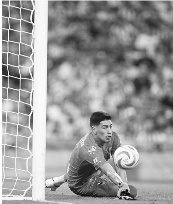
Atajadón de Andrada para evitar el 2-0 de La Máquina.

"En el primer tiempo no estuvimos a la altura de jugar una semifinal", expresó el técnico argentino en rueda de prensa.