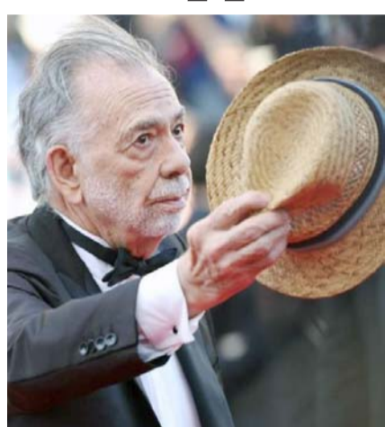
Megalopolis, la cinta más esperada del festival.

"La conversación" (1974) y "Apocalypse Now" (1979) le valieron dos Palmas de Oro, y "Megalópolis" concursa de nuevo en esta edición.