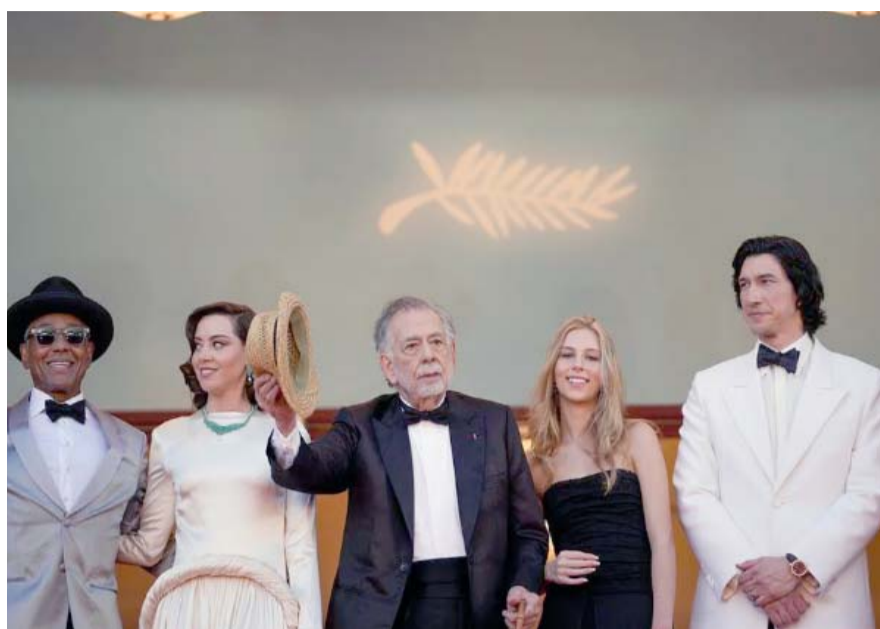
La película ha sido gestada durante cuatro décadas.

Acude a la premier de la cinta "Megalopolis"