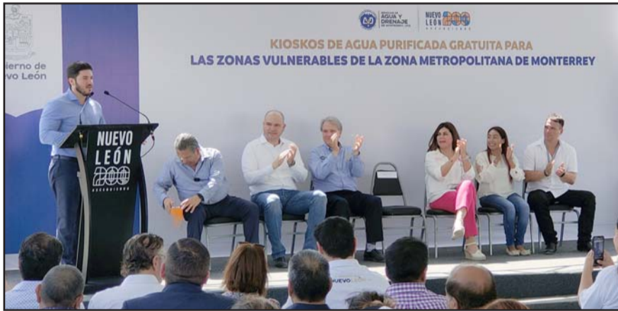
En su mensaje durante la inauguración de un kiosko de agua purificada, el gobernador pidió a la gente no hacerle caso a sus retractores.

Junto a Caintra, instalaron ya 22 sistemas de captación de agua pluvial para el uso doméstico en los Centros Comunitarios.