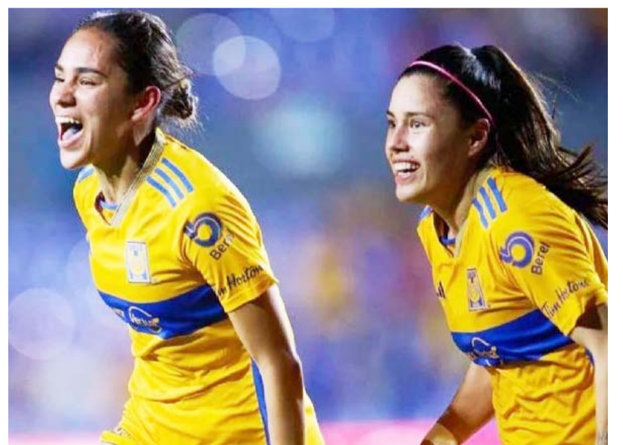
Tigres busca traerse del Azteca una ventaja.

fútbol para traerse un marcador favorable para el duelo de vuelta del próximo lunes que será en el estadio Universitario de San Nicolás, lugar