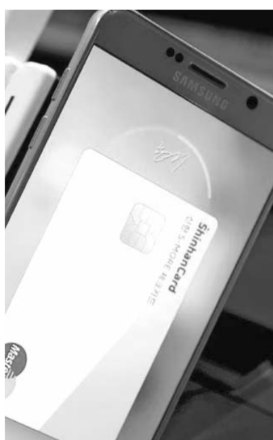
Conllevan riesgos cibernéticos.

Alertó que, al no estar limitados por la infraestructura heredada, el uso de ciertas tecnologías por parte