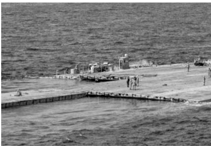
Se busca llevar alimento, agua y medicinas a Gaza.

"Creo que vamos a movilizar unas 500 toneladas en un par de días, estimamos que entre 500 y 600 toneladas", declaró el vicealmirante Brad Cooper, quien detalló la entrega de la ayuda a