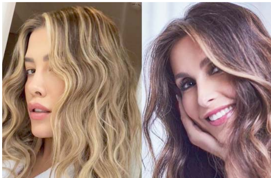
Es frecuente que la primogénita del Sol acompañe a la pareja a sus giras y a cenar en reconocidos restaurantes alrededor del mundo.

"Queremos adentrarnos en esas partes de su viaje que no pudimos cubrir en las películas anteriores (...)".