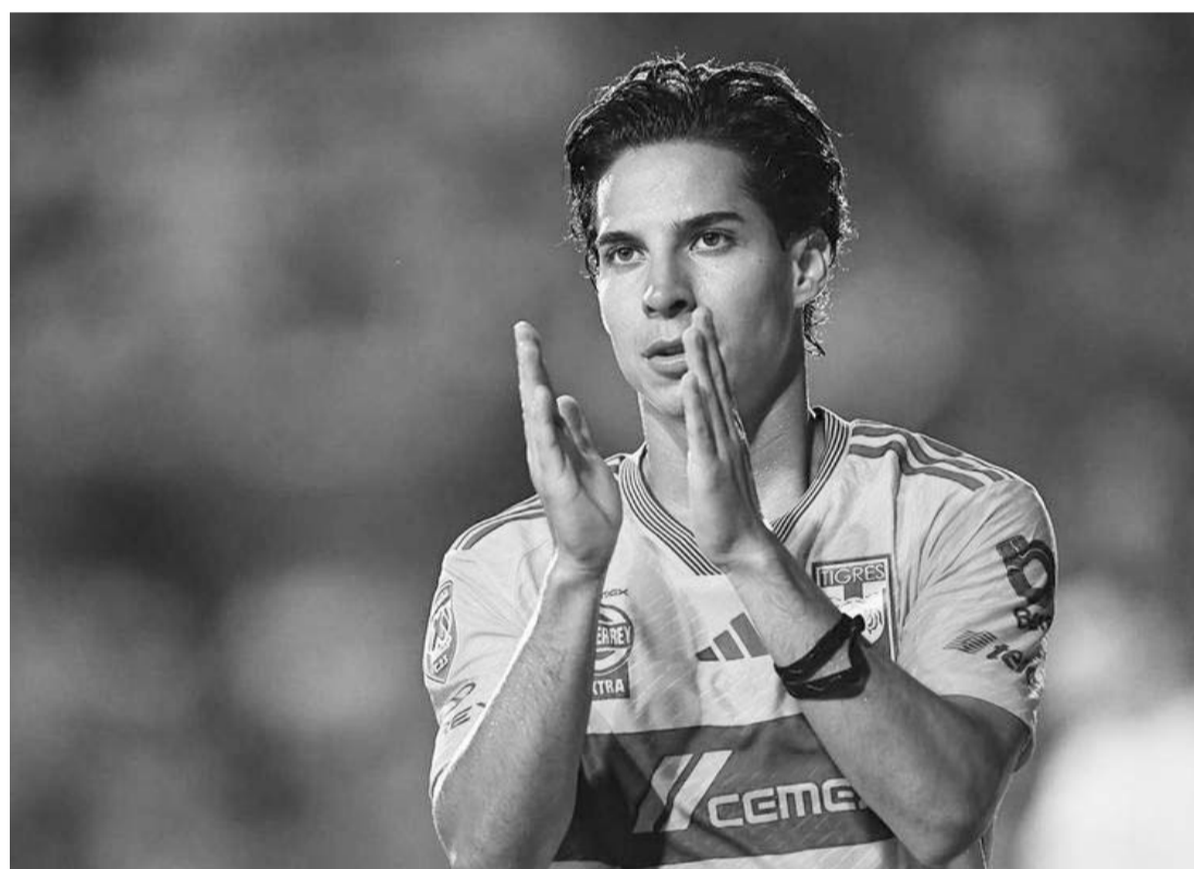
Los Tigres le sufrieron en el primer semestre del año.

Otro momento que marcó a los universitarios fue la eliminación en los cuartos de final de vuelta contra Columbus Crew el 9 de abril, cuando empataron 1-1 en el segundo partido que fue en el