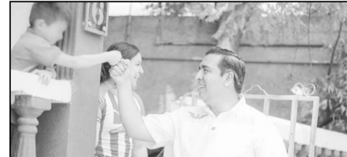
Con eso busca dar un apoyo directo a la educación infantil.

de su agenda al estar nuevamente al frente del gobierno municipal los estudiantes con-