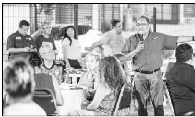
Tuvo una reunión con vecinos y explicó su proyecto.

"Vamos a traer inversiones que detonarán a la Ciudad como un punto comercial por exce-