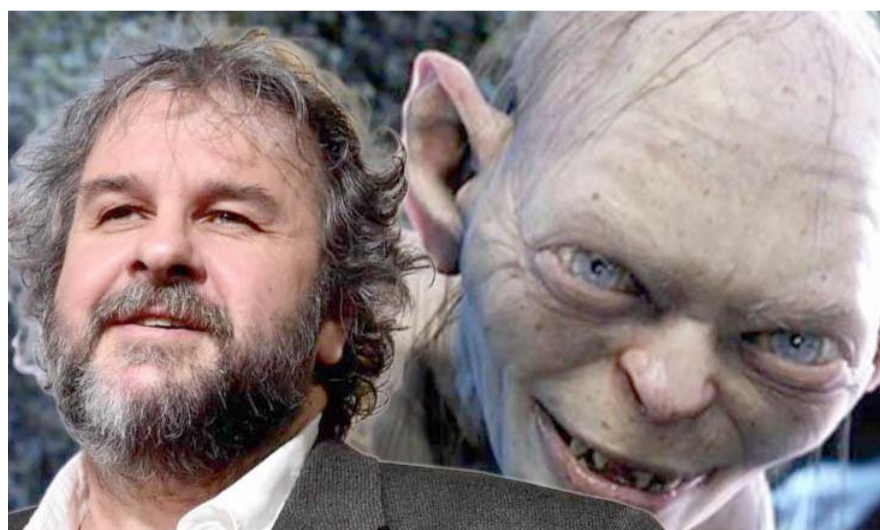
La cinta se estrena en 2026.