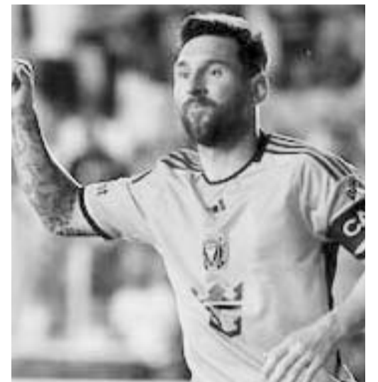
El argentino es el que más gana en la MLS.

Previo a la Liguilla del Torneo Clausura de este año, los Rayados no se imponían a Tigres en una Liguilla desde los cuartos de final del Clausura 2016, situación por la cual ya finalizaron con esa racha luego de eliminarlos en la presente fiesta grande del fútbol mexicano. (AC)