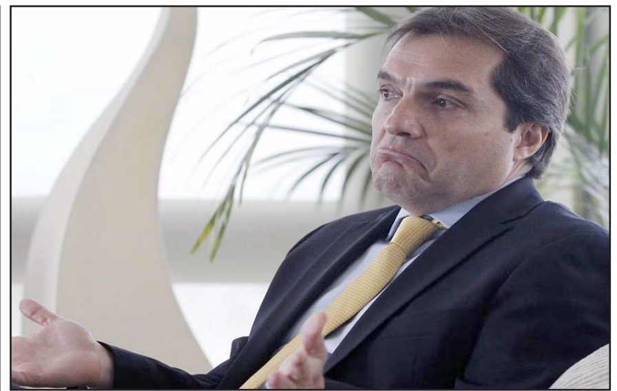
El sábado pasado, el Servicio Nacional de Migración de Panamá informó que deportó a Ahumada a Paraguay por una alerta roja.

Por lo que, anunció que el martes se reunirá con "una comitiva" del gobierno del presidente estadounidense, Joe Biden.