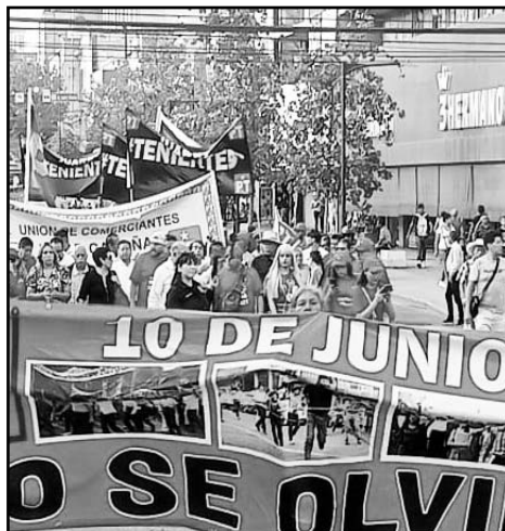
Recorrieron las calles de la ciudad.

Es de decir que la primera marcha después de la matanza estudiantil del 2 de