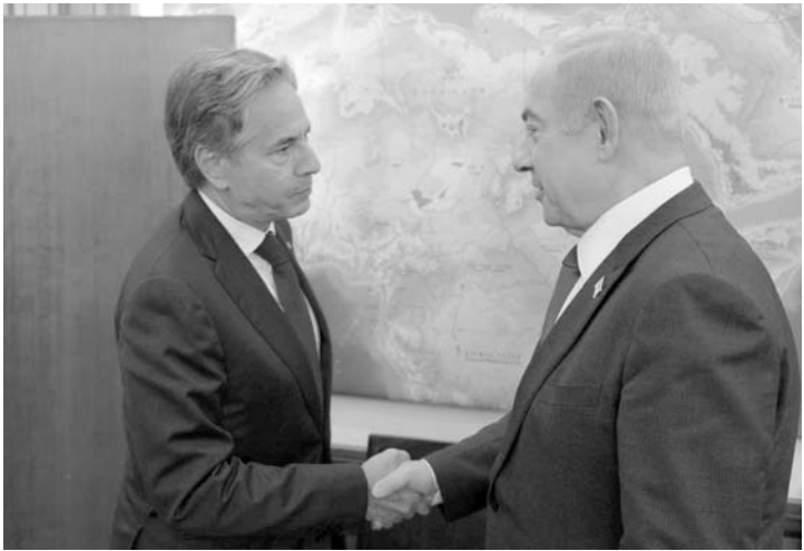
Se reúne con Netanyahu y otros dirigentes de Tel Aviv.

Blinken también actualizó a Netanyahu sobre los esfuerzos para planificar el "día después" de la guerra, algo que el primer ministro se ha mostrado reacio a hacer públicamente por temor a enemistarse con sus socios de coalición de izquierda derecha. El presidente de Unidad Nacional, Benny Gantz, citó la falta de planificación de posguerra como una de las razones de su salida del lunes del gobierno de