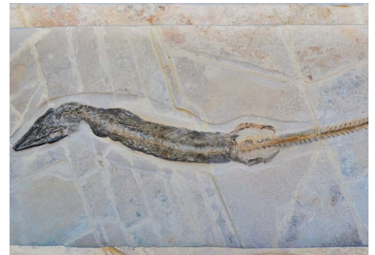
Durante el periodo Mesozoico prevalecieron reptiles marinos como cocodrilos, ictiosaurios, plesiosaurios y tortugas.

Por último, consideró que el estudio de los reptiles marinos mesozoicos en el noreste del país lleva un avance considerable, todos ellos siendo una clara muestra de la gran diversidad de estos grupos en nuestro país.