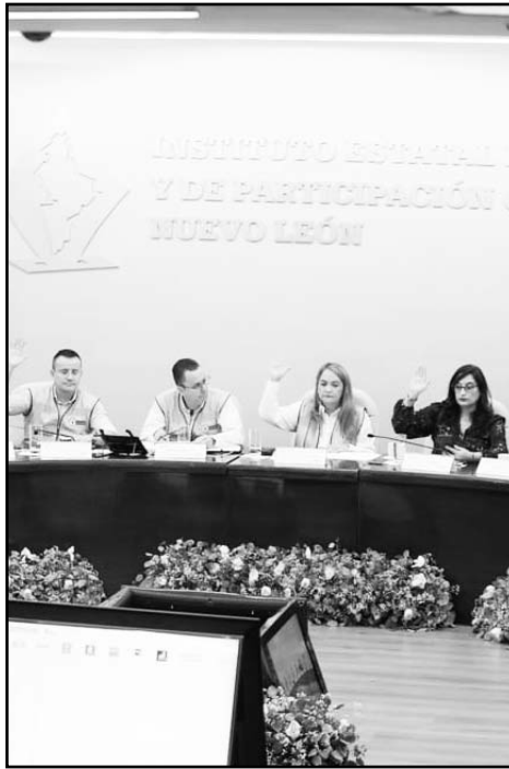
Se iniciará con el levantamiento de actas.

Asimismo, aprobaron un receso para continuar con la Sesión Permanente este martes 11 de junio a las 13:00 horas, para realizar la declaratoria de validez de dicha elección, determinar la integración del Congreso del Estado y la asignación de las curules por el principio de representación proporcional. (CLR)