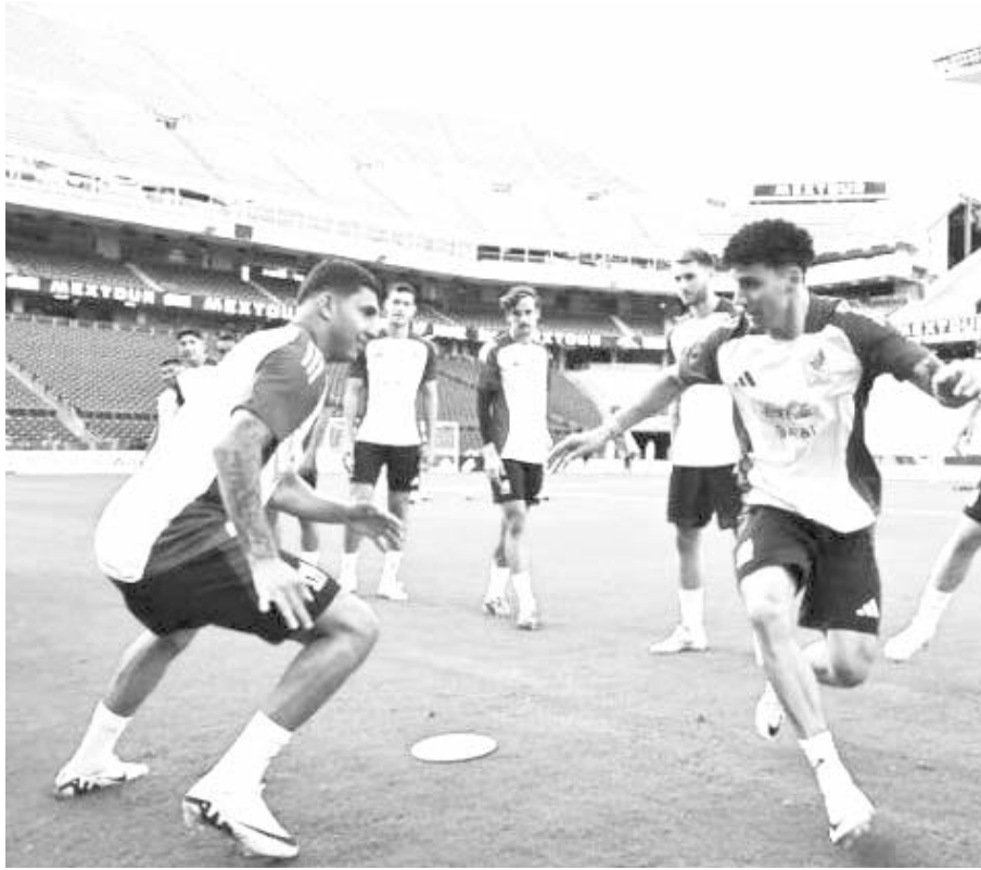
México, casi listo para la Copa América.

qué condiciones están los defensas y si alguno causará baja. Este escenario plantearía un "problema menos" para el