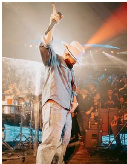
Recurre a géneros como el country.

El nombre de Carín León estará mayormente relacionado con el regional mexicano; sin embargo, al hablar con él surgen nombres como el de la banda británica de rock Coldplay, los brasileños intérpretes de "power metal" Angra, o el popero español Alejandro Sanz y hasta The Stones.