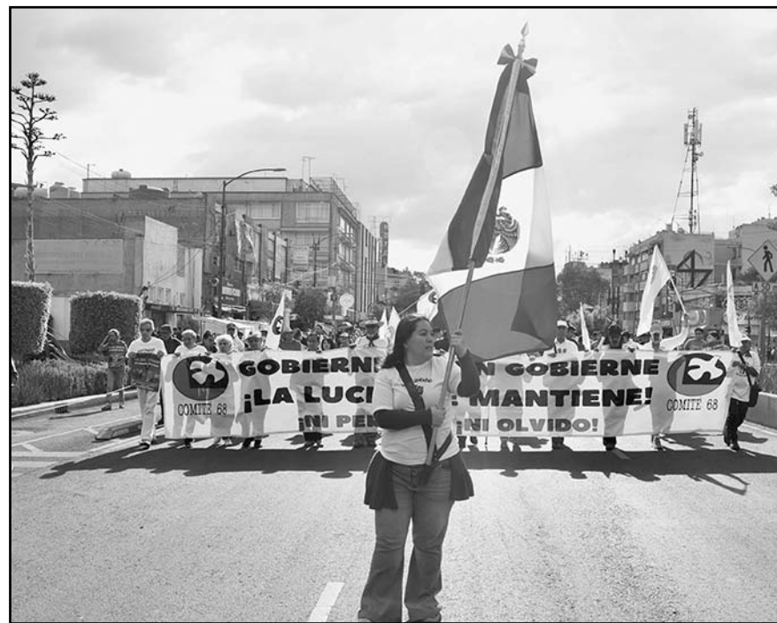
Los manifestantes demandaron acceso a la justicia y castigo a los responsables por la matanza del Jueves de Corpus, del 10 de junio de 1971.