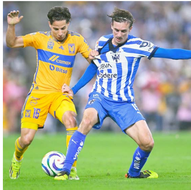
Será un Clásico de otoño.