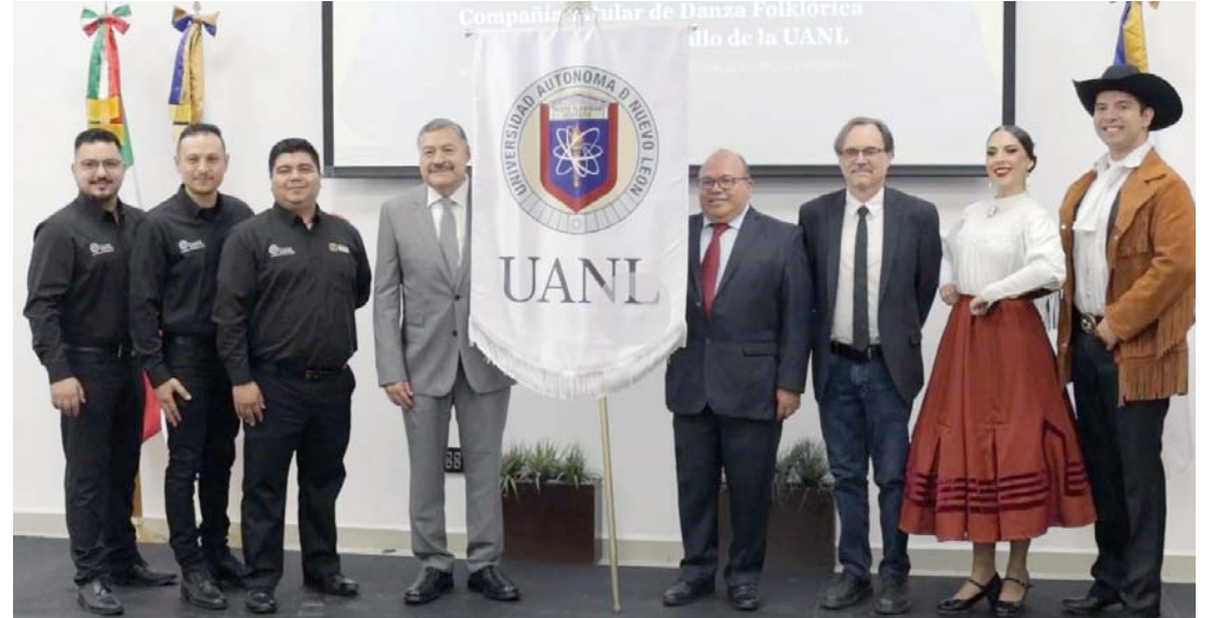
Desde su nacimiento en 2010, la compañía ha hecho presencia en festivales de al menos trece países.

Desde sus inicios la Compañía Titular de Danza Folklórica de la UANL ha formado parte del