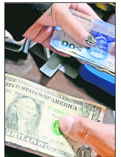
La semana pasada, el peso perdió 8.1%, su mayor caída semanal desde el 20 de marzo de 2020.

Siller añadió que además de los factores internos, hay factores externos que amenazan con causar una mayor volatilidad.