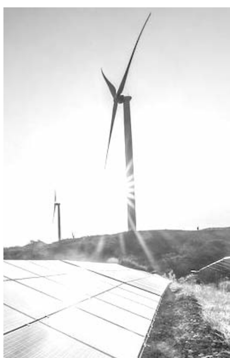
"En México costó muchos años y mucha labor política para llegar a la reforma energética de 2013"

Esa reforma abrió las puertas a jugadores del sector privado en diversas áreas de los sectores de electricidad e hidrocarburos, lo que fue ampliamente criticado por AMLO, argumentando que las dos empresas del