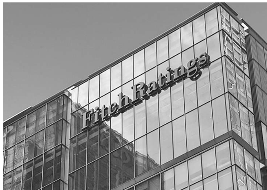
Fitch Ratings recordó que el desempeño de los bancos mexicanos suele estar más impulsado por la economía en general que por las campañas de los partidos políticos o los períodos electorales.

como la pandemia de Covid-19, que debilitaron el entorno económico, también presionaron materialmente el desempeño bancario. Los eventos macroeconómicos adversos generalmente afectan negativamente la inversión fija bruta de los sectores público y privado, el consumo privado interno, la inclusión financiera, las tasas de interés y/o la inflación, todos los cuales son factores clave del desempeño financiero y el crecimiento del crédito de los bancos mexicanos", dijo.