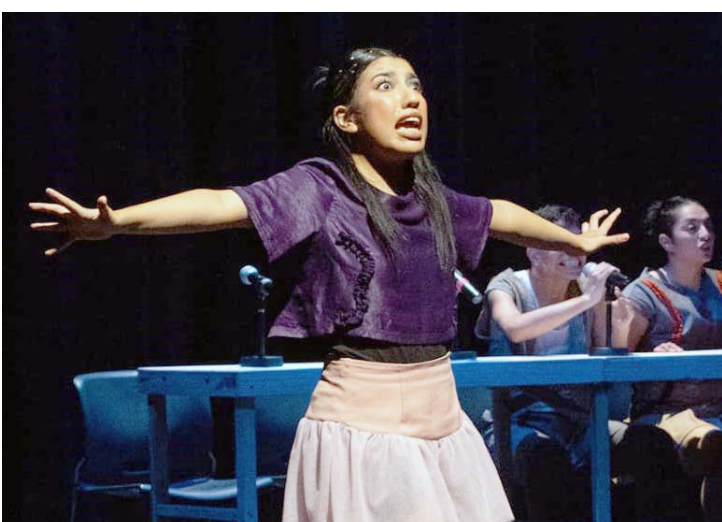
El encuentro propicia la reflexión, la crítica social y permite a los artistas expresar sus ideas y emociones.