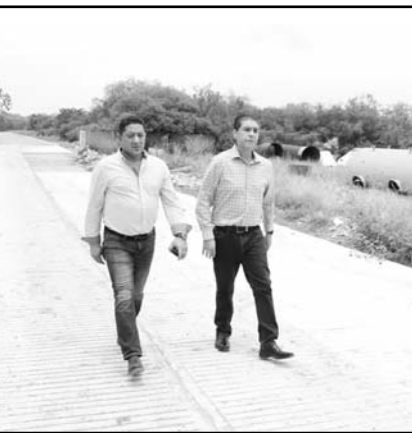
Paco Treviño supervisa las obras.

Por lo que en una jornada de supervisión de obras y trabajos de mantenimiento a parques en el municipio de Juárez, el Alcalde Francisco Treviño acudió a la Colonia Arboledas de San Roque, donde se realizan labores de pavimentación que llevan un avance del 85 por ciento.