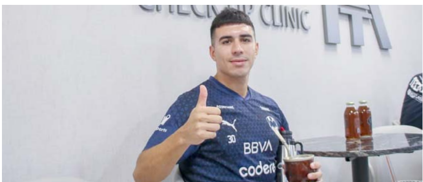
El equipo albiazul reportó ayer a exámenes.

Monterrey iniciará el Apertura 2024 el domingo 7 de julio ante Pachuca en el Estadio Hidalgo.