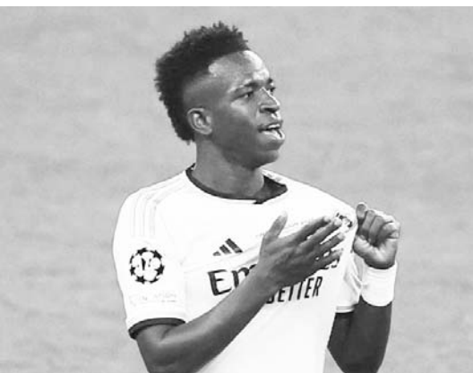
Vinicius alzó la voz por los de color.