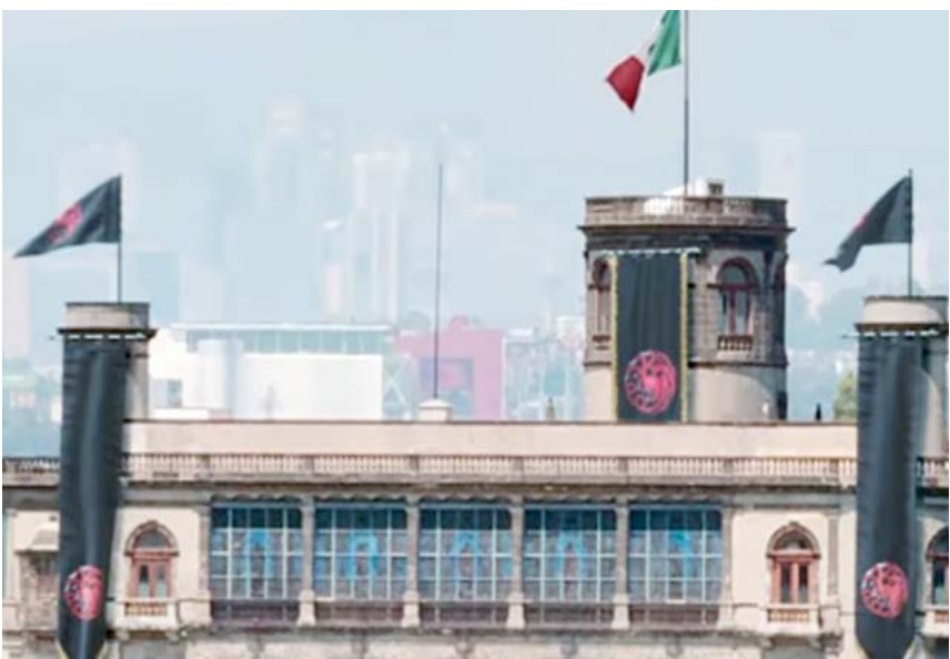
La plataforma Max difundió una campaña para promover la segunda temporada de este "spin-off".