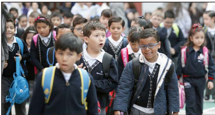
El ciclo escolar para las escuelas de Educación Básica comenzará el lunes 26 de agosto y finalizará el miércoles 16 de julio de 2025.

En 2004, Ahumada se dio a conocer por videoescándalos, que fueron difundidos por el periodista Víctor Trujillo y se mostró al empresario sobornando a servidores públicos, que ocasionó acusaciones y detenciones.