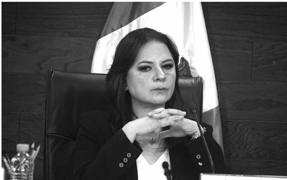
Norma Julieta del Río, comisionada del Instituto Nacional de Transparencia, Acceso a la Información y Protección de Datos Personales.

"Lo que más les preocupa aquí es la desaparición de estos dos derechos, más allá de cómo quieran ponerle al instituto, de cómo quieran llamarlo, pintarlo de un color, no importa, lo más importante es que estos