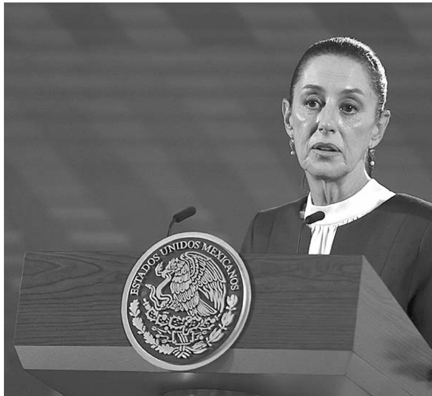
La exjefa de Gobierno capitalino obtuvo más de 60% de los votos en 19 estados, por encima del promedio que logró a nivel nacional.

Álvarez Máynez logra mayor respaldo en NL y Campeche Jorge Álvarez Máynez, candidato de MC que terminó en el tercer lugar de la contienda presidencial, logró mantener los bastiones del partido, mismos en donde se reflejó su votación más alta.