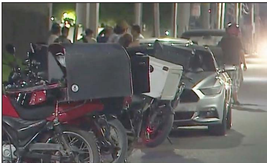
Llevaba puesto el casco de seguridad.

Una mujer de la tercera edad murió por causas naturales, después de que llegara al estacionamiento de una notaría ubicada en el centro de