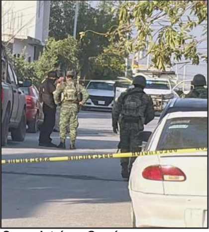
Se registró en García.