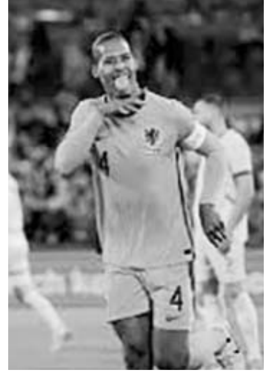
Parece llegar en buena forma a la 'Euro'.

"Mis palabras acerca del Mundial de Clubes de la FIFA no han sido interpretadas de la manera que yo pretendía. Nada más lejos de mi interés que rechazar la posibilidad de disputar un torneo que considero que puede ser una gran oportunidad para seguir peleando por grandes títulos con el Real Madrid", publicó en su cuenta de X.