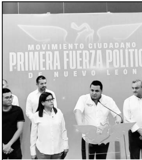
Se hizo un repaso de los todos los logros obtenidos por los naranjas

"Aunque el PRIAN insista en que los resultados fueron más favorables para ellos, esto es una tremenda mentira.