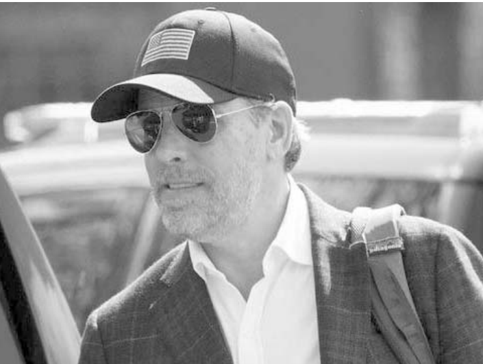
Está acusado de tres delitos graves.

Los miembros del jurado deliberaron por menos de una hora antes de dar por finalizada la jornada.