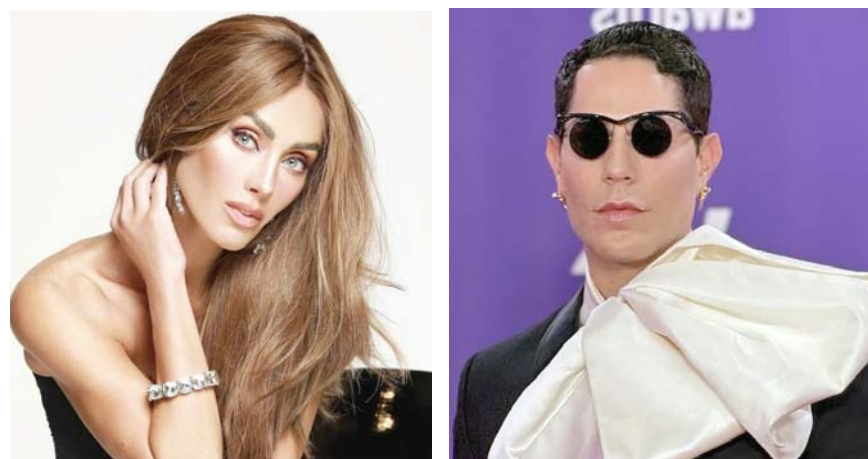
A la cantante no le gustaron las declaraciones de su ex compañero.