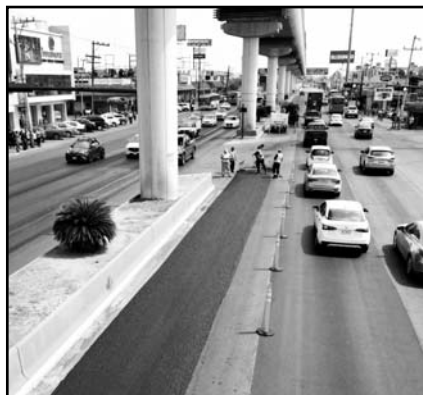
Será de Juárez a Sendero.

“Es parte del programa de repavimentación, bacheo y mantenimiento de vialidades, es parte de los compromisos que hicimos en las pasadas elecciones, y que nos comprometimos arrancarlos de manera inmediata, con trabajos de mantenimiento menor y mayor, y esta avenida Universidad que ya habíamos avanzado con la rehabilitación de la circulación Norte-Sur, hoy comenzamos la primera etapa del cuerpo Sur-Norte y las conexiones con Sendero y las carreteras a