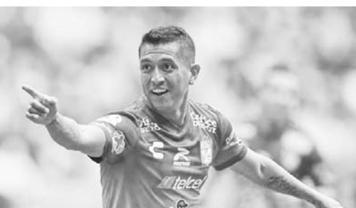
No entro más en los planes de León.

Galindo adelantó vía penal, pero algunas desconcentraciones de la zaga mexicana hicieron que Argentina empatara por conducto de Gabriel Batistuta. Fue al minuto 74 que otra vez apareció Batistuta y dejó los cartones 2-1 y así los sudamericanos levantaron el trofeo, pero México dio una de sus mejores actuaciones, siendo una sorpresa muy agradable a los ojos sudamericanos y el mundo.