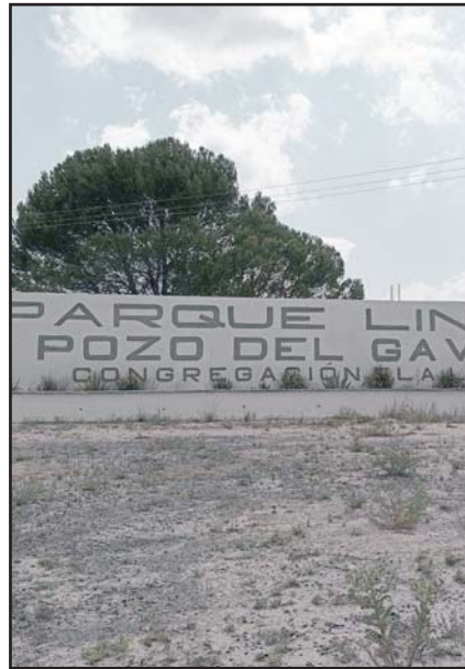
Ocurrió en Galeana.

De esta forma Erick N., de 19 años, quien portaba el arma en su cintura y Luis Gerardo N., de 20, que manejaba la máquina, quedaron detenidos por la portación prohibida de arma de fuego y fueron puestos a disposición del Ministerio Público de la FGR.