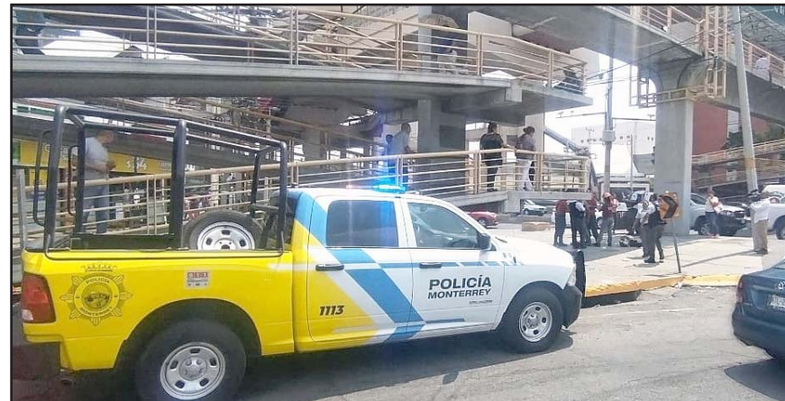
Presumen que fue por viejas rencillas.

Los uniformados se acercaron hasta él y ahí observaron que había una persona lesionada con un arma blanca en el brazo derecho y en la espalda.