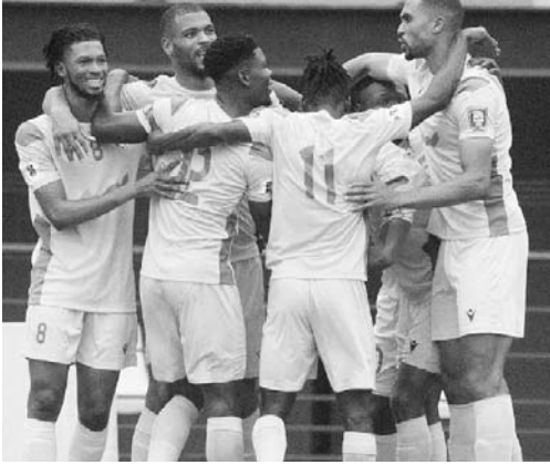
Son líderes de su grupo con siete puntos.