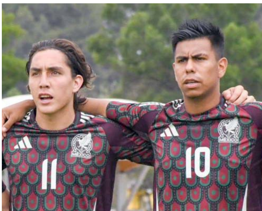
Los juveniles van con todo por la victoria esta mañana.