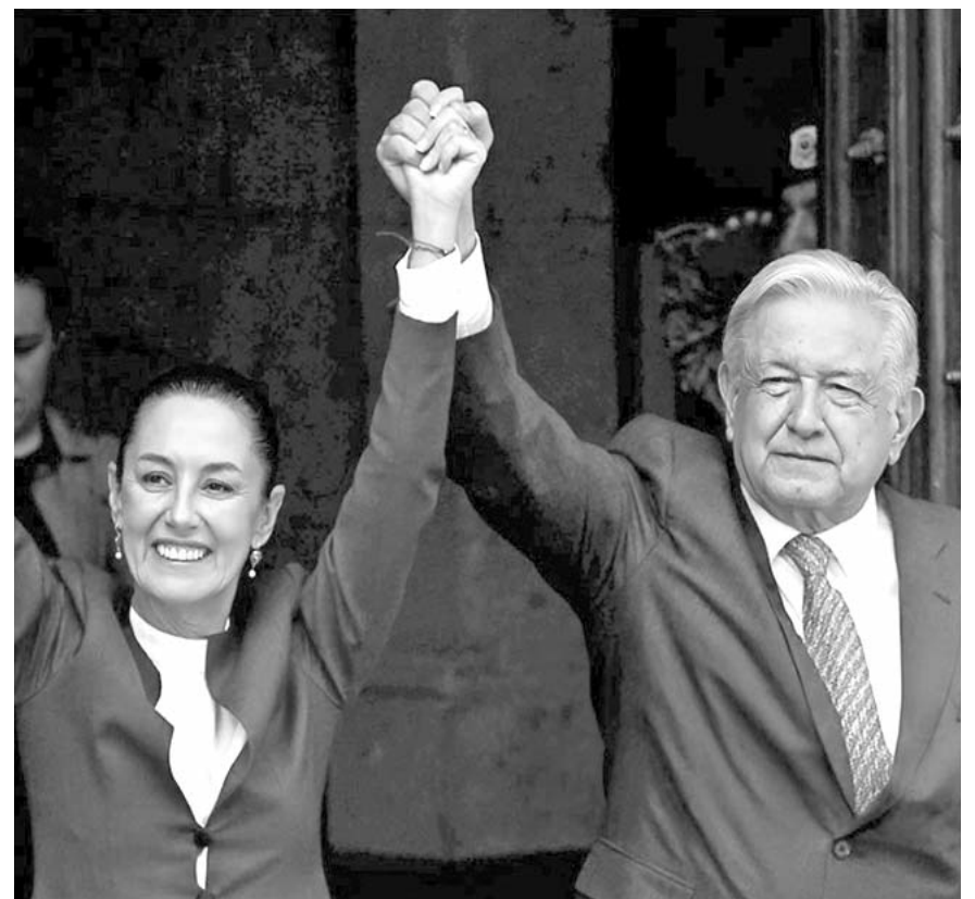
Citibanamex resaltó que los mercados financieros siguen reaccionando negativamente al aumento del riesgo político.

"Las posibles implicaciones se harán más evidentes una vez que la presidenta electa Claudia Sheinbaum proporcione más claridad sobre su agenda de política económica y las autoridades electorales confirmen la composición final del Congreso", comentó.