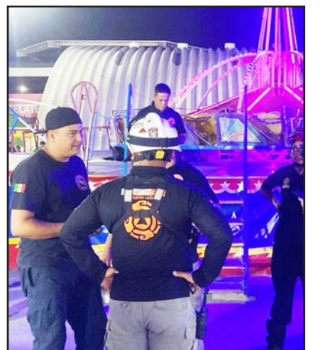
No hubo lesionados.

Elementos de Protección Civil actuaron de inmediato, ayudando en el desalojo de las personas atrapadas, donde no reportan lesionados, solo el susto vivido.