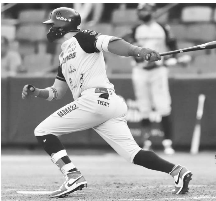
Sultanes, a la capital del Acero.

El próximo jueves 13 de junio para el tercer y último enfrentamiento de la