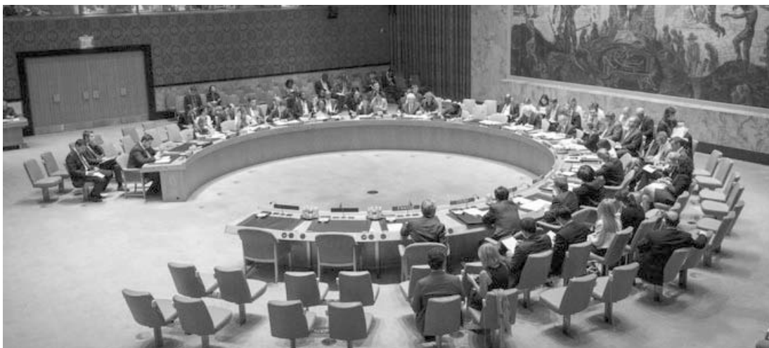
La resolución insta a Israel y Hamás al cese de hostilidades.

Aún está en duda si Israel y Hamas están de acuerdo en seguir adelante con el plan, pero el fuerte apoyo de la resolución en el organismo más poderoso de la ONU ejerce presión adicional sobre ambas partes para que aprueben la propuesta.