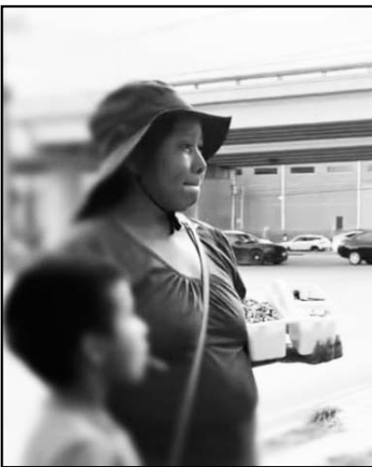
Se dan diversas pláticas

Prueba de lo anterior, es la implementación del Programa de Atención y Prevención del Trabajo Infantil,