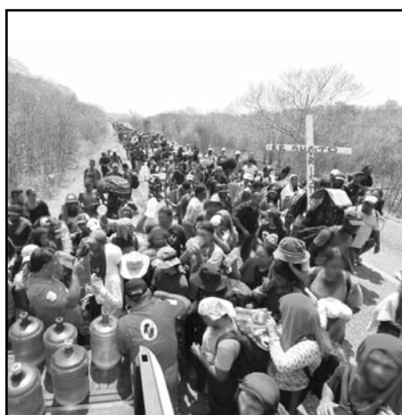
Las personas rescatadas provenían de Guatemala, Honduras y El Salvador, como la prestación de primeros auxilios en carreteras, atención primaria a mujeres embarazadas, asistencia médica, entrega de agua y alimentos.

Las atenciones de "los betas" contemplan rescates en zonas de alto peligro como desiertos, montañas y ríos, así