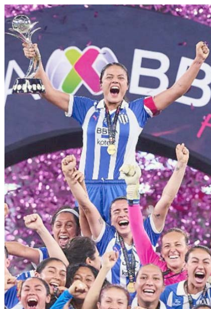
La finalísima será el 1 de junio en el Universitario.