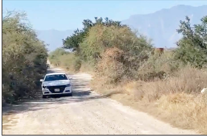
Las dos víctimas mortales eran menores de 30 años.

Por su parte los agentes ministeriales interrogaron a los lugareños, para