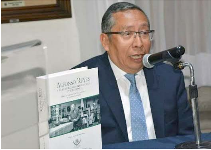
Ha dedicado 25 años a investigar la obra del regiomontano universal.