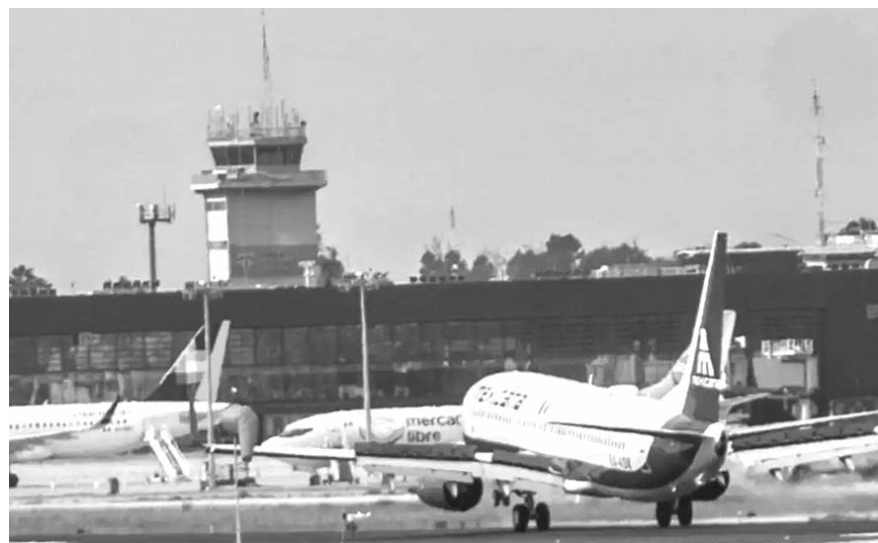
La AFAC detalló que la preocupación de la OACI se resolvió un mes antes del plazo impuesto por el organismo internacional.

destacando que no se han generado quejas por los usuarios finales, sobre desviaciones de rumbo o errores de marcación en los sistemas", agregó la AFAC.