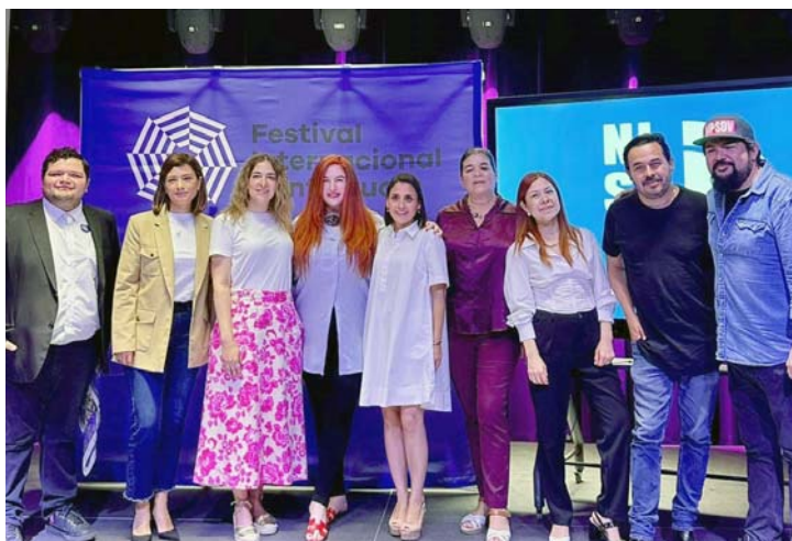
Se reconocerán las mejores recetas tradicionales dulces y saladas, muy de esta región del país.

cultural, informó que podrán participar todas las personas aficionadas y amantes de la cocina sin importar su profesión u oficio con un platillo y en una sola modali-