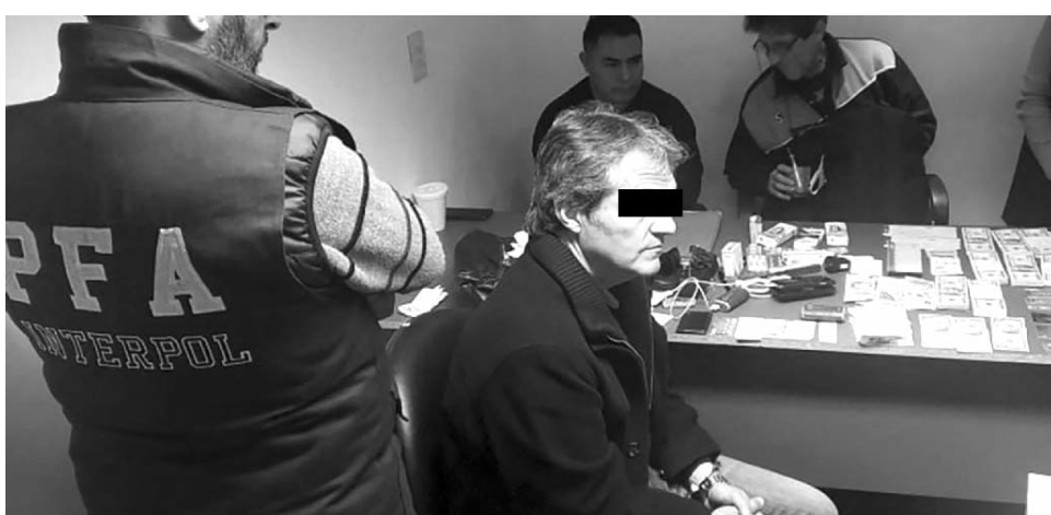
"Un juez federal le otorgó a esa persona, un amparo contra la orden de aprehensión pendiente de cumplimiento, lo cual impide momentáneamente acción alguna al respecto".