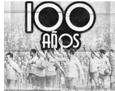
Los charrúa ganaron el oro en los Juegos Olímpicos de París 1924.

Fue un 9 de junio, en Colombes cuando el conjunto charrúa superó con un contundente 3-0 a Suiza en la Final del certamen para lograr su primera estrella.