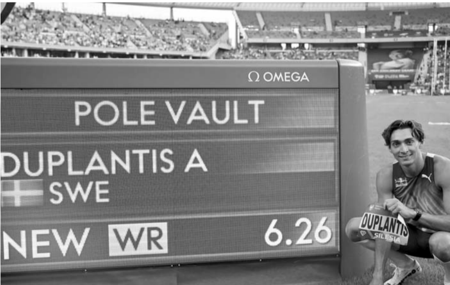
Armando Duplantis, de Suecia.

Armando Duplantis, atleta de origen sueco, logró un nuevo récord mundial en el atletismo, en el salto de altura.