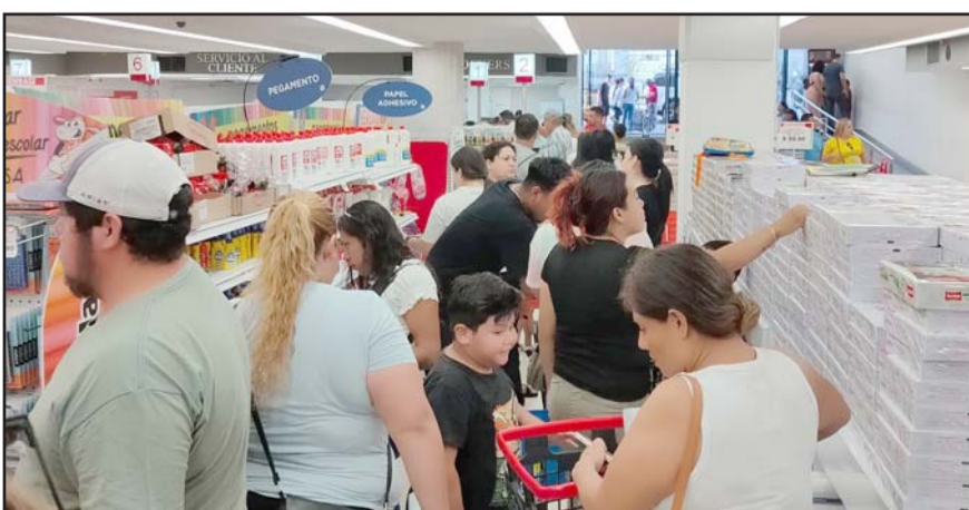
Se hicieron compras de último momento en las tiendas del primer cuadro de la ciudad

Diferentes establecimientos lucieron prácticamente atiborrados, sin que hubiera un solo espacio para caminar por sus pasillos.