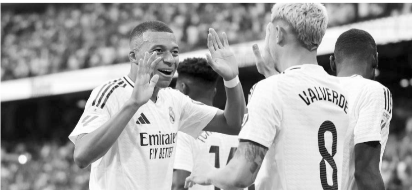
Real Madrid se impuso 3-0 al Valladolid.

Real Madrid goleó 3-0 al Valladolid y con ello lograron su primera victoria en la Liga de España.