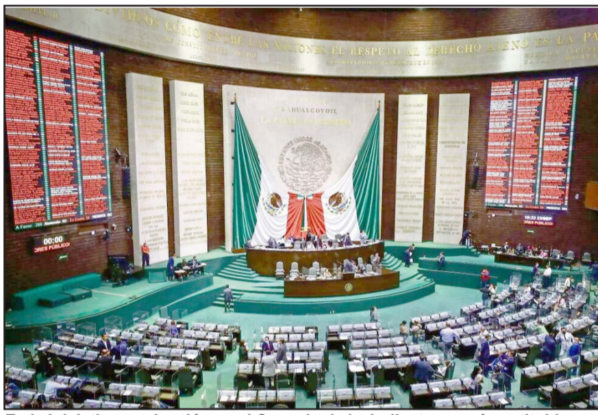
En la iniciativa se abordó que el Consejo de la Judicatura será sustituido por un Tribunal de Disciplina Judicial.

existen en el máximo tribunal serían eliminadas, con lo que las sesiones se llevarían a cabo únicamente en el pleno.