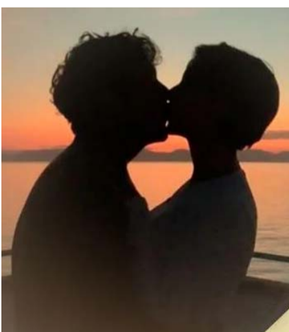
Ángela Aguilar y Christian Nodal.