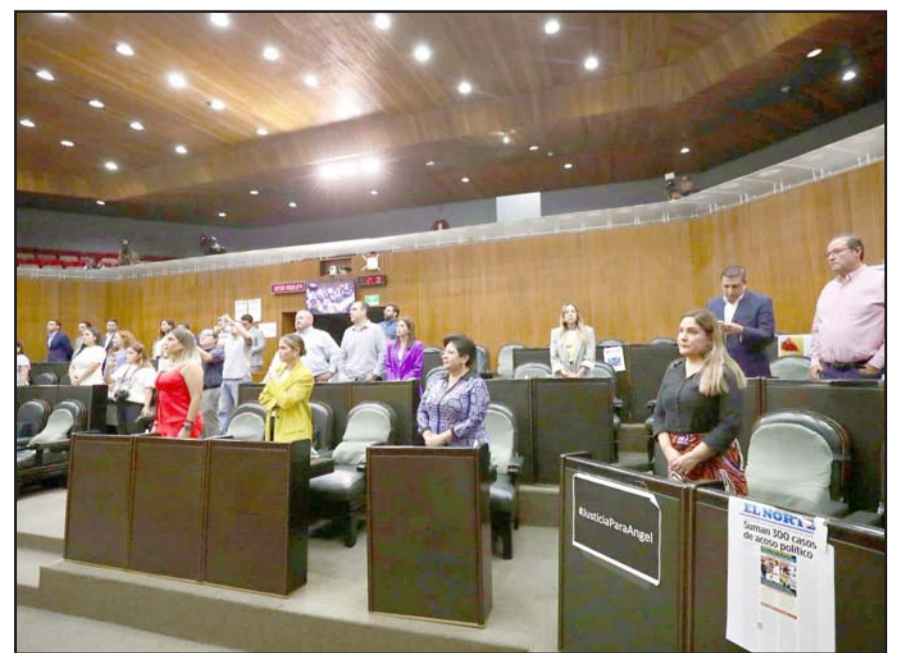
Entre lo que se presumió fue una reforma a la Constitución local.

Asimismo, puntualizaron que prácticamente lo más costoso fueron las libretas y los uniformes.