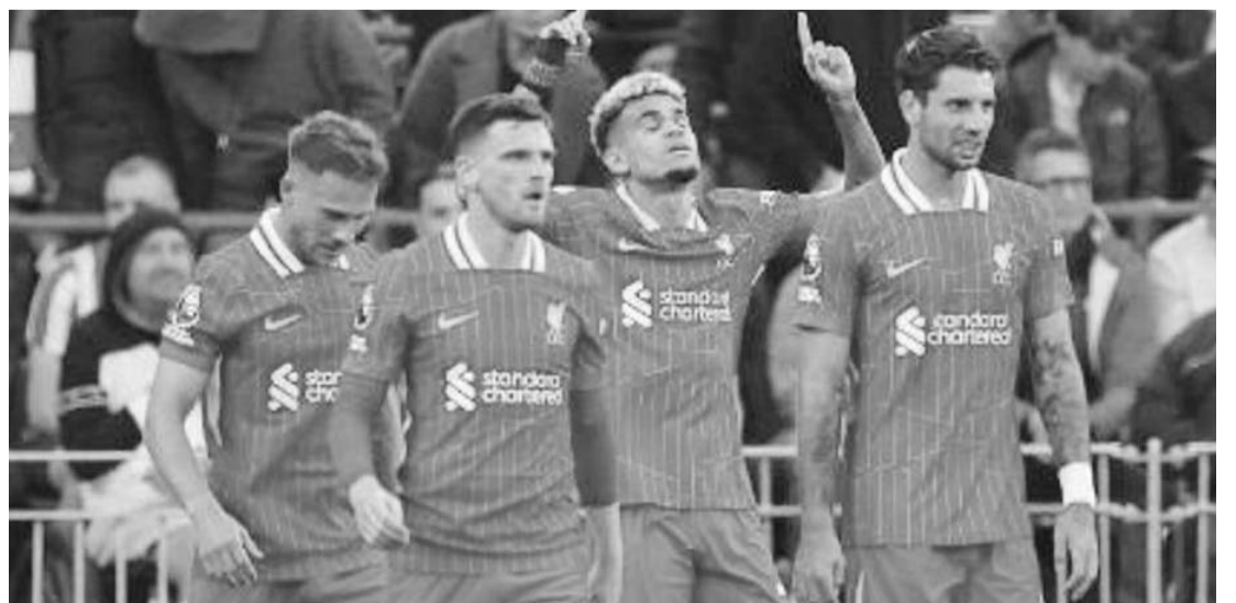
Liverpool ahora venció al Brentford 2-0.

Por su parte, pero en la actividad en la Liga de Portugal, el cuadro del Braga superó 3-1 al Moirense.