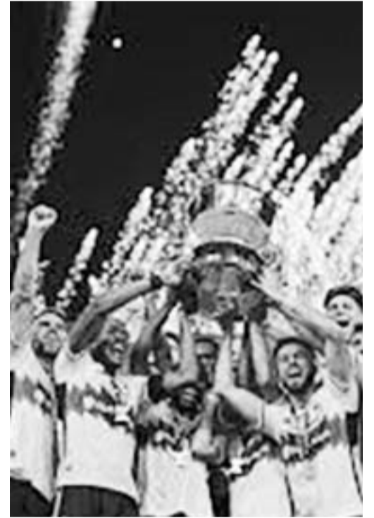
Columbus Crew, el campeón.