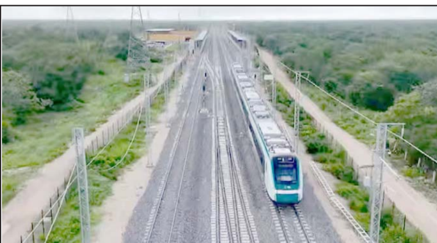
Activistas medioambientales denuncian que llevan un año encontrando restos de diésel y cemento en el agua por las obras del tren.

Afirmó que el Humanismo Mexicano ha dado resultado pues señaló que la economía de México está mejor que en todo el periodo neoliberal "y eso es gracias a que se apoya a los de abajo, a los que históricamente habían sido olvidados".