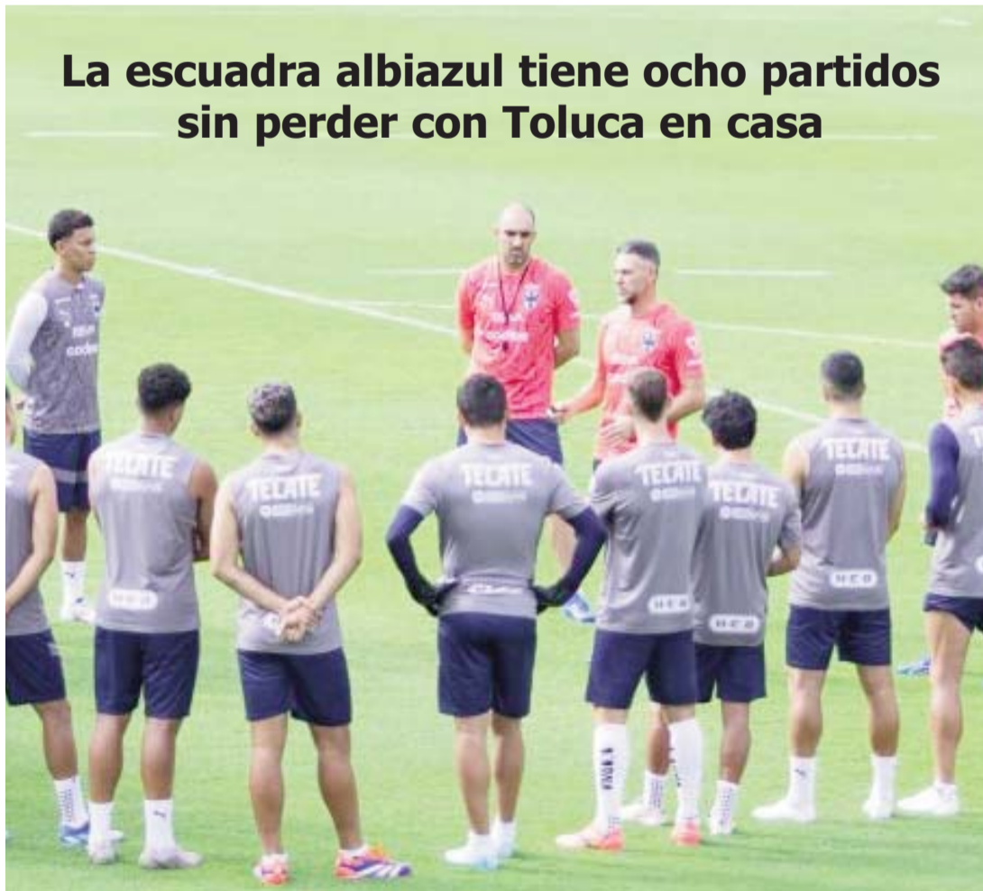
Los Rayados buscarán aprovechar su localía ante los Diablos el próximo sábado.