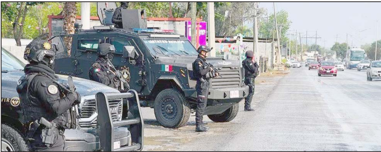
Al darse por concluido se dieron a conocer las estadísticas finales de lo que se presentó durante las vacaciones.

Señaló que por estas arterias circulan 250 mil carros al día, por lo que al cerrar