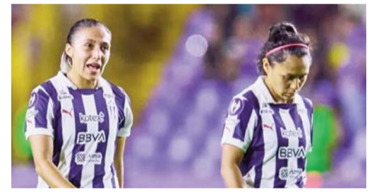
Las albiazules, a levantar la cara.