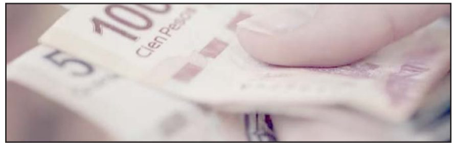
Monterrey y San Nicolás de los Garza se encuentran entre los municipios más endeudados del país.

El documento señala que, en este periodo, las entidades federativas que presentaron un mayor nivel de endeudamiento per cápita respecto del total fueron: Nuevo León, con 17 mil 549.9 mdp; Chihuahua, 13, mil 717.6 mdp; Coahuila, 11 mil 500.7 mdp; Quintana Roo, con 11 mil 212.4 mdp; la Ciudad de México, con 10 mil 736.5; y Sonora, con 10 mil 308.4 millones de pesos.