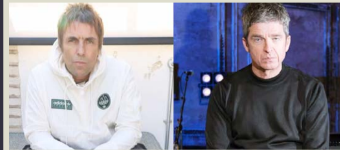
Los Gallagher están planeando una serie de conciertos

Lo que ha llamado la atención es que el anuncio se daría a tan solo un día de que se cumplieran 15 años de su desintegración, lo que daría un nuevo contexto a esta fecha.