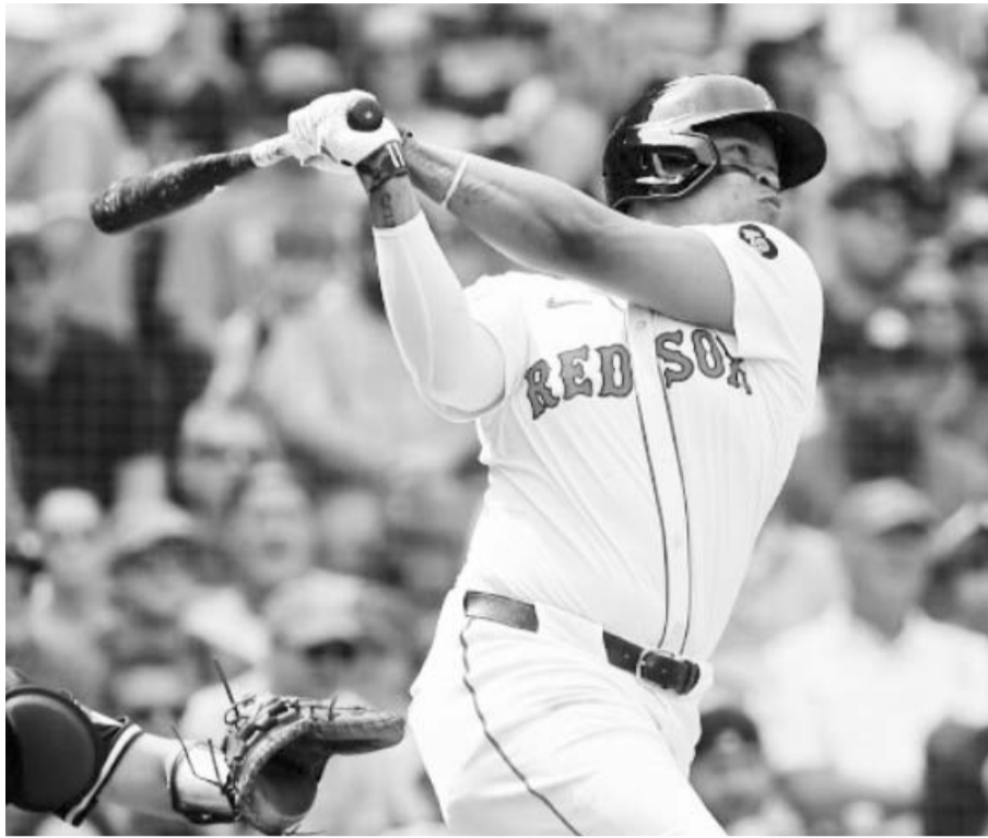
Rafael Devers salvó la triste noche de los Medias Rojas.

La derrota por 7-5 dejó un sabor agri dulce a los seguidores de los Medias Rojas, quienes aplaudieron de pie a su héroe, conscientes de que, a pesar del resultado adverso, fueron testigos de un momento que quedará grabado en la historia del equipo