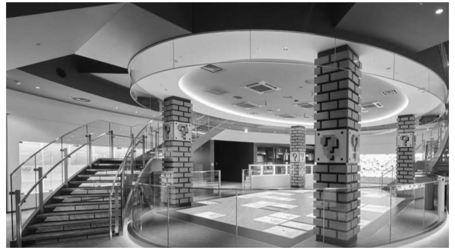
El museo estará conformado por dos pisos. En el segundo encontrarán una exhibición que recorre la historia de Nintendo.

Asimismo, no pueden faltar el sistema de entretenimiento de Nintendo (NES, por sus siglas en inglés) en