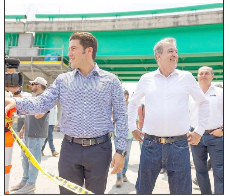
El gobernador personalmente abrió la circulación.