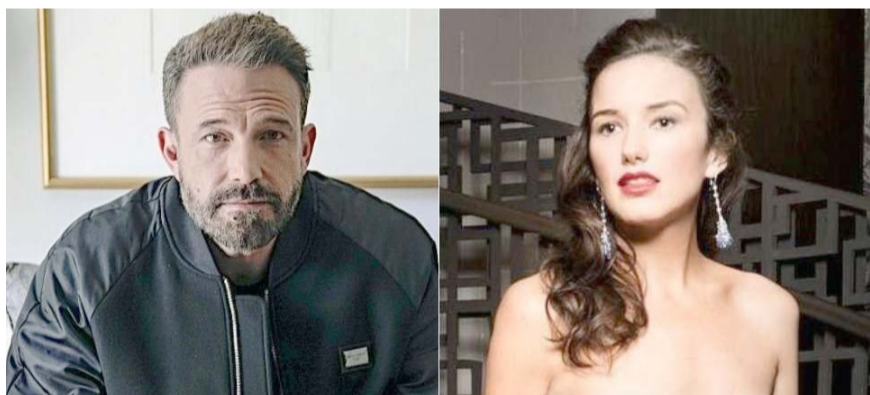
El actor de 52 años y la socialité de 36 llevarían ya varias citas formales.