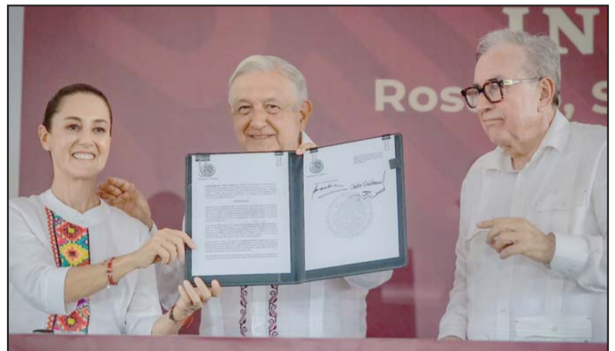
Ante cientos de personas, el mandatario federal se comprometió a regresar con Claudia a Sinaloa antes de que concluya su gobierno.

La iniciativa judicial busca, entre otros objetivos, garantizar una justicia más expedita, estableciendo plazos máximos para la resolución de asuntos fiscales y penales, con el fin de agilizar los procesos y mejorar la eficiencia en la impartición de justicia en México.