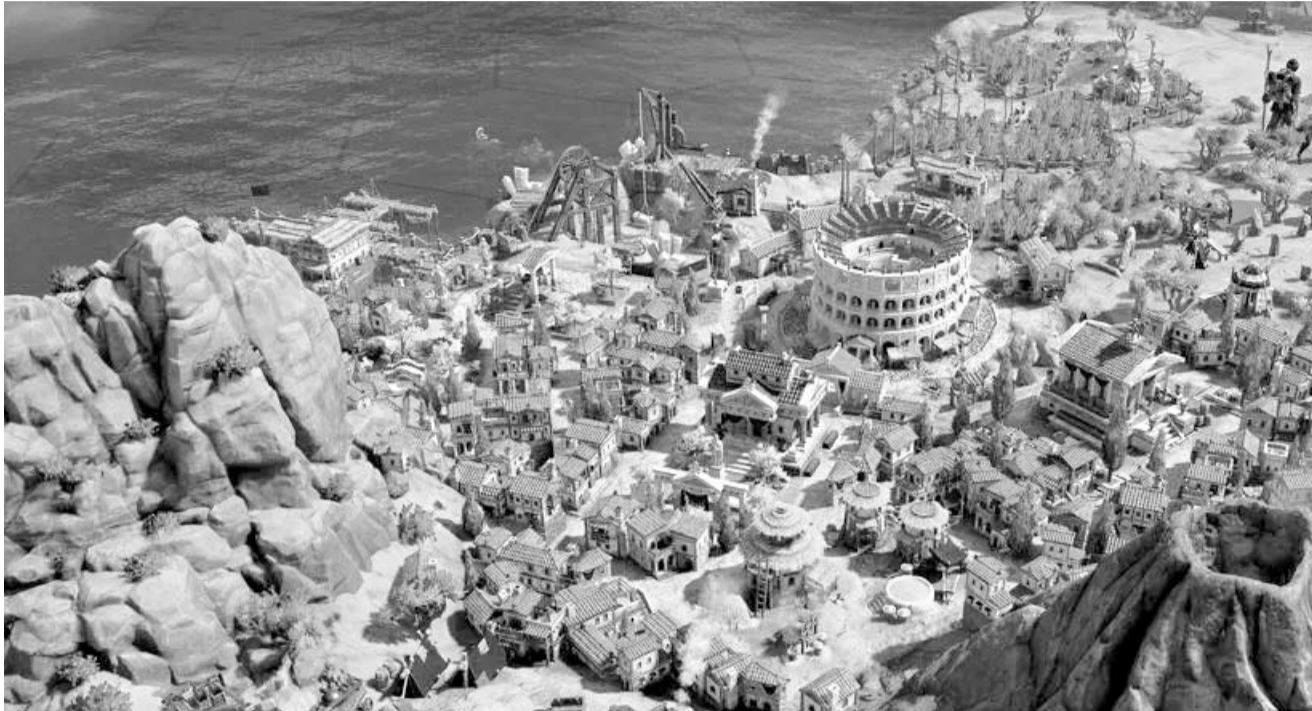
Firaxis Game ha mostrado algunos minutos del juego durante la feria Gamescom de Colonia y uno de los grandes cambios de la nueva entrega es el apartado gráfico.

Firaxis game anuncia Civilization VII, que traerá varios cambios para la popular saga de estrategia por turnos