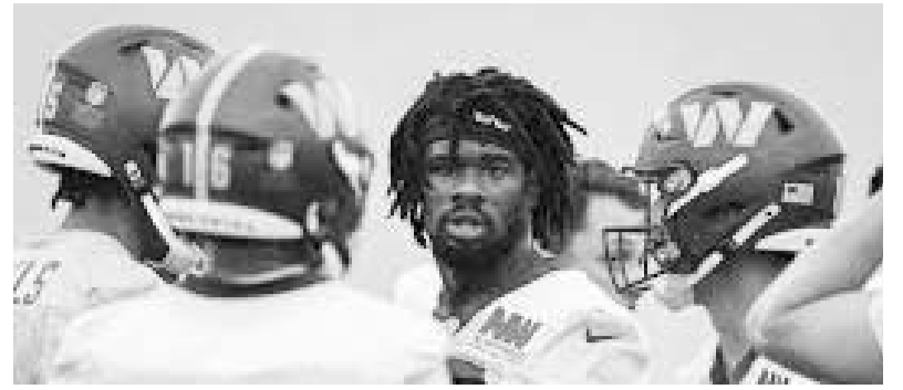
Los Comandantes de Washington y los Patriotas de Nueva Inglaterra cerraron la pretemporada.