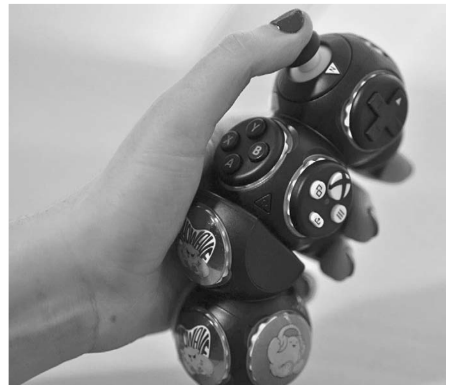
Proteus, diseñado por ByoWave, ofrece un mando con elementos que pueden quitarse y ponerse.

Junto a estos accesorios, Xbox ha compartido en Xbox Design Lab una serie de archivos gratuitos para imprimir en 3D seis adornos para 'joysticks' adaptables. También ha anunciado