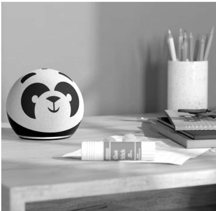
Los pequeños pueden hacer uso de Alexa para realizar tareas, asignaciones escolares o resolver dudas sobre sus materias.

La nueva entrega devolverá al juego también un tono más realista, parecido al que ofrecía Civilization V, aunque evidentemente actualizado. El salto a gráficos más saturados y caricaturesco de Civilization VI fue uno de los cambios más criticados en su momento por los fans de la saga, que se cuentan por millones y tiene ya una nueva fecha marcada en el calendario.