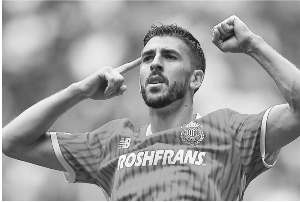
Los Diablos están en el tercer lugar del torneo.

El antes mencionado tiene contrato con Tigres hasta diciembre de este año y aún está lejos la posibilidad de que pueda renovar con el equipo. (AC)