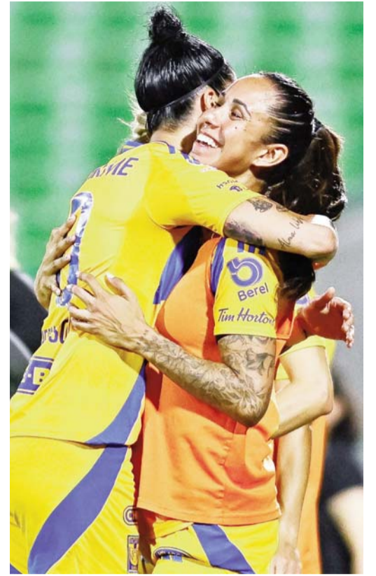
Las felinas siguen en plan contundente.

Tras esta situación, en Rayados tendrán que trabajar a marchas forzadas y Martín Demichelis deberá de buscar la manera de mejorar el aparato defensivo de los regios, buscando así un equipo más sólido y que no sufra tanto a la hora de tener que cerrar un partido como así ya les pasó con anterioridad en este año futbolístico.