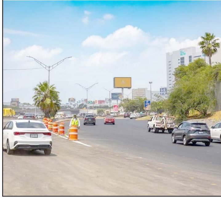
Fue en el boulevard Miguel de la Madrid y Bonifacio Salinas