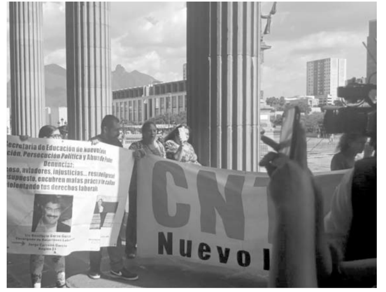
Buscan diálogo con las autoridades de Educación en NL.