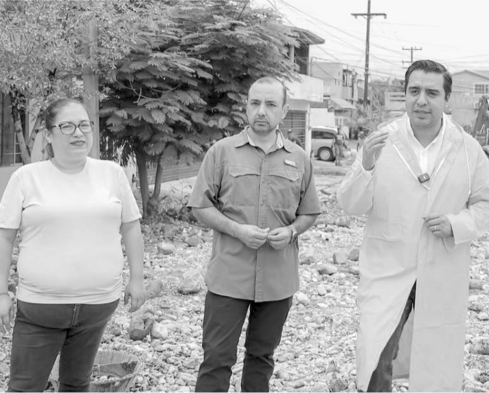
Asegura dejará solo un rezago de 5 kilómetros del tendido, para la siguiente administración de Santa Catarina.