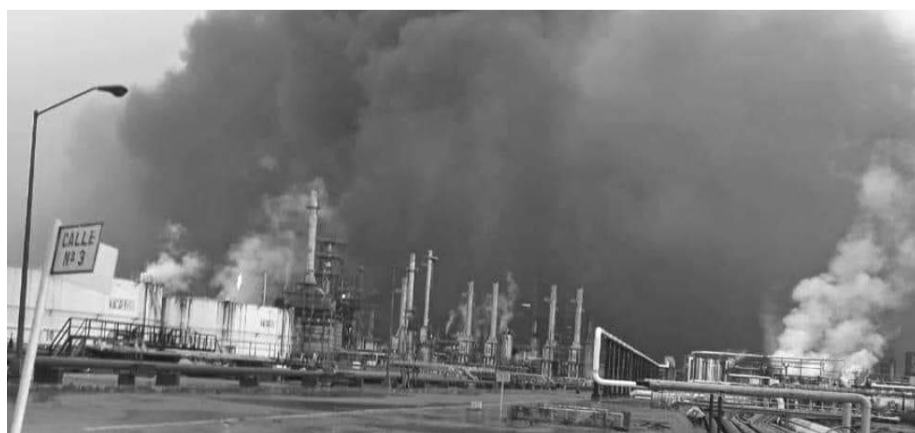
En imágenes difundidas por usuarios de redes sociales se pueden ver las llamas que salen de un ducto

dadanía que siga las recomendaciones y se mantenga actualizada mediante los canales oficiales y redes sociales para obtener la información más reciente.