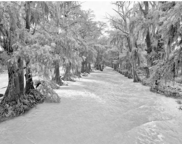
Las lluvias han permitido recuperar estampas dignas de disfrutar y visitar en los diferentes municipios.