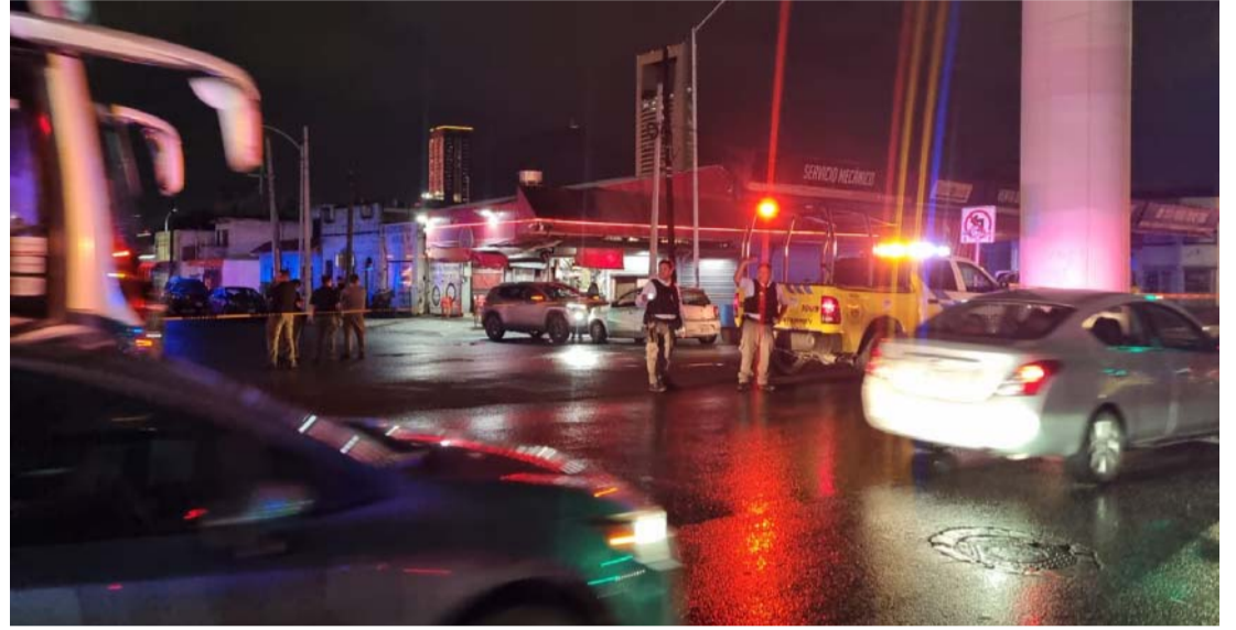
En el sitio, se levantaron casquillos de armas cortas y largas.

Salazar y Félix U. Gómez, descendió de la camioneta con la finalidad de ponerse a salvo, siendo alcanzado por los gatilleros que utilizaron armas largas y cortas.