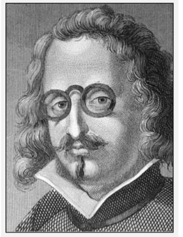
Francisco de Quevedo

Le agradecí al excompañero que me hubiera contado la anécdota. “Eres perfecto”, me dijo. “De ninguna manera”, respondí y recordando su afinidad religiosa, le dije, casi citando al pie de la letra: “No se te olvide: La riqueza de su gracia hizo sobreabundar para con nosotros el misterio de su voluntad, según su beneplácito”. (Efesios 1: 7-8). “Te refieres a El Amado”, me dijo sorprendido. Y le respondí: “Entre la fornicación, la inmudicia y la avaricia, elijo la primera. Renuncio, por tanto, a ser Santo. Más también elijo la herencia en el Reino de Cristo y de Dios, pues pago el precio: Renuncio a toda idolatría. (Efesios 5: 3-5).