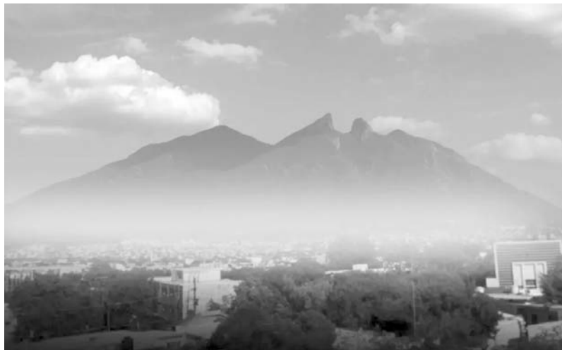
El sector privado, la sociedad civil y el gobierno hacen sinergia para generar una mejor calidad del aire metropolitano.

Los puntos clave acordados en la Audiencia Pública incluyen, entre otros puntos, la formación de mesas de traba-