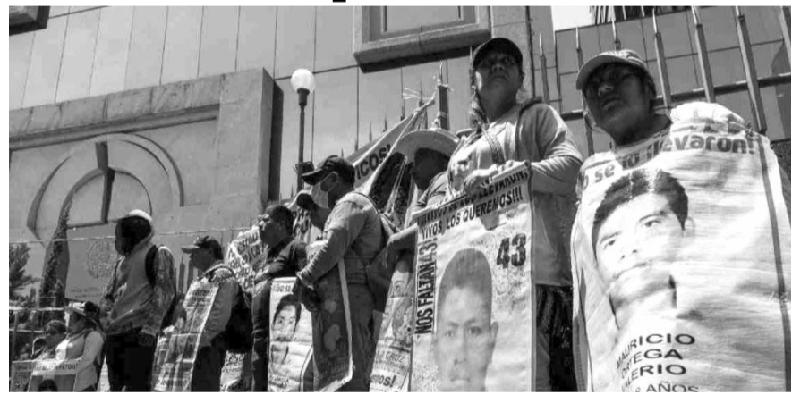
El Estado está siendo omiso en velar por la seguridad de sus ciudadanos

Agregó que "quedó que aclararía lo qué ocurrió con los desaparecidos de Ayotzinapa, prometió a las madres reunirse cada tres meses con ellas; la última vez que fuimos nos recibió con