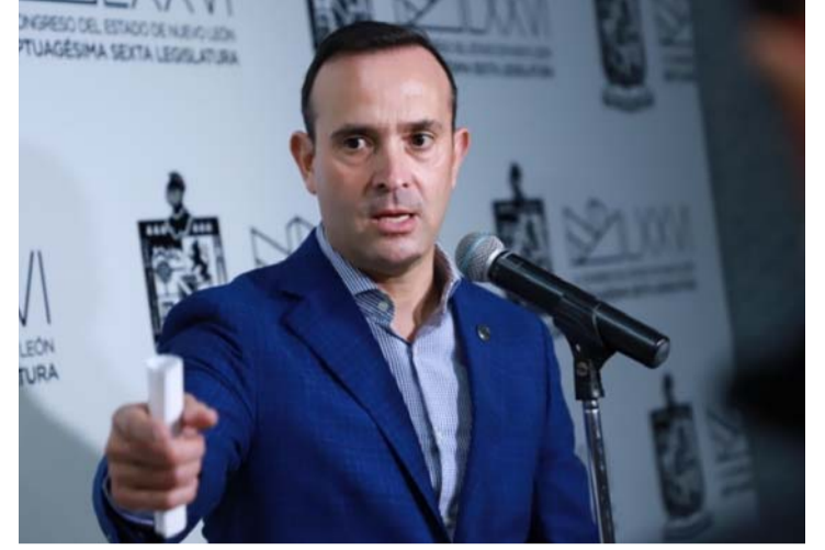
Que el mandatario no enviara el Paquete Fiscal se traduce en obras inconclusas, caos vial y más inseguridad: De la Fuente.

Personal de la Secretaría de Obras Públicas se dio cita en el lugar, durante el sábado con la finalidad de retirar las luminarias, buscando evitar un incidente.