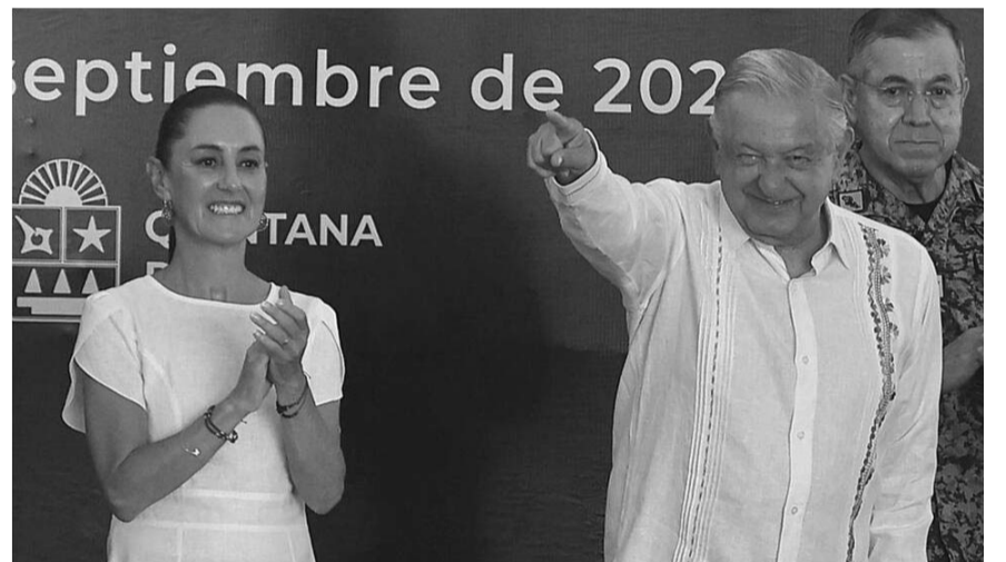
Claudia Sheinbaum Pardo, presidenta electa, afirmó este sábado que con sus "logros maravillosos" el presidente Andrés Manuel López Obrador ha rescatado la dignidad del pueblo mexicano.

"Cuando llegó la intervención francesa, Benito Juárez salió de la Ciudad de México y llevaba en su cartera pues los documentos de la nación y dice el presidente en el libro ('¡Gracias!') Benito Juárez llevaba más