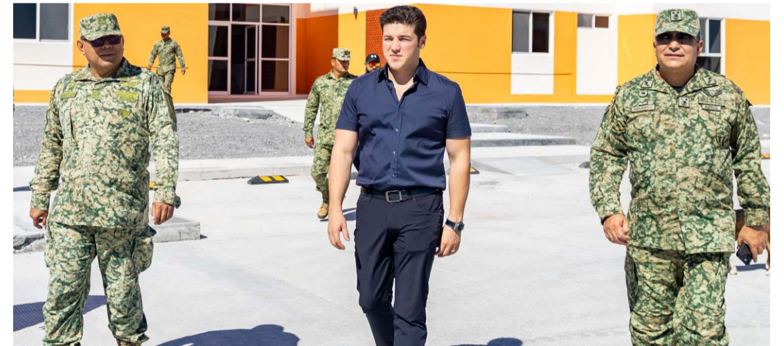
El espacio de la Caballería Motorizada de la Policía Militar cuenta con una capacidad de 600 elementos, explicó el mandatario estatal.