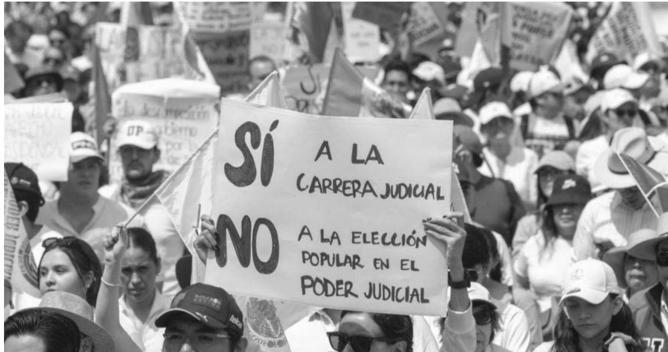
Estudiantes, trabajadores del Poder Judicial y la sociedad civil se concentrarán en la Cámara de Senadores para exigir que no se apruebe la reforma judicial

Las manifestaciones en contra de la reforma al Poder Judicial continuarán durante este fin de semana en todo el país, teniendo una mayor actividad el domingo, así lo han informado diversas organizaciones civiles, estudiantes y los trabajadores del Poder Judicial.