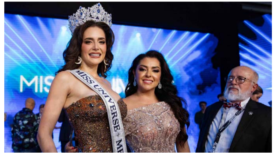
La representante de Sinaloa celebró con un mensaje de empoderamiento y su deseo de combatir el bullying.

Mercadotecnia y Comunicación, no solo destacó por su preparación académica, sino también por su elegancia y seguridad en el escenario.