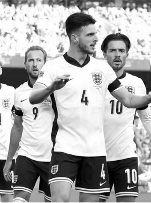
Los ingleses vencieron 2-0 a Irlanda.