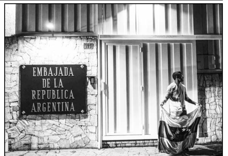
La situación escaló después de que Argentina solicitara a la Corte Penal Internacional la detención de Nicolás Maduro.

En un comunicado, Brasil reafirmó su compromiso de mantener la custodia y defensa de los intereses argentinos hasta que Argentina decida lo contrario.