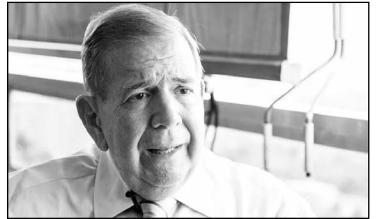
El excandidato presidencial opositor fue asilado en España tras recibir salvoconducto.

Harris ha mostrado coraje para defender a los más vulnerables y ha demostrado que está dispuesta a hacer lo necesario para proteger nuestros derechos".