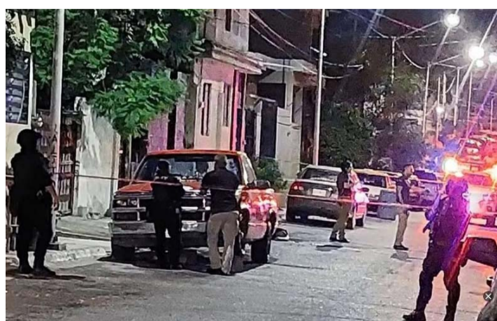
El sitio se considera punto de venta de enervantes.

Desafortunadamente no pudieron identificarlo debido a que cubrían sus rostros con los cascos de protección.