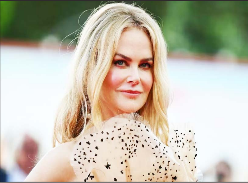
La actriz ganó el Premio a Mejor Actriz en Venecia por su interpretación en "Baby Girl," pero no pudo recibir el galardón en persona.