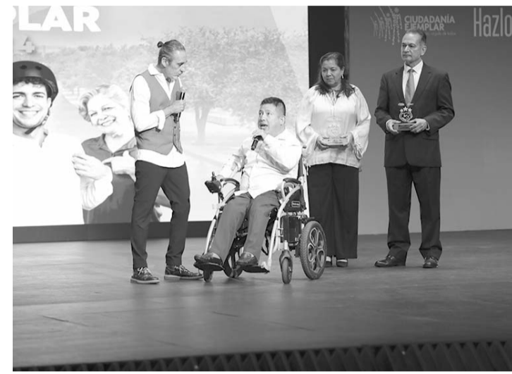
Este evento tuvo lugar en el marco de la Semana de la Participación Ciudadana 2024.

Dentro de la categoría Inclusión Social, Solidaridad y Derechos