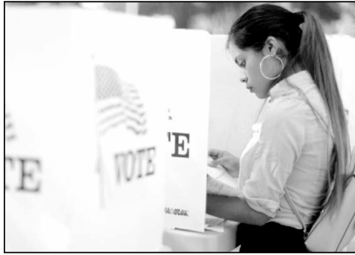
Se espera que alrededor de 4.3 millones de nuevos votantes latinos participen por primera vez en las elecciones de EU.

Asimismo, una encuesta del diario The New York Times/Siena College, publicada en julio, muestra que Harris supera a Trump con 19 puntos de ventaja, 57% versus