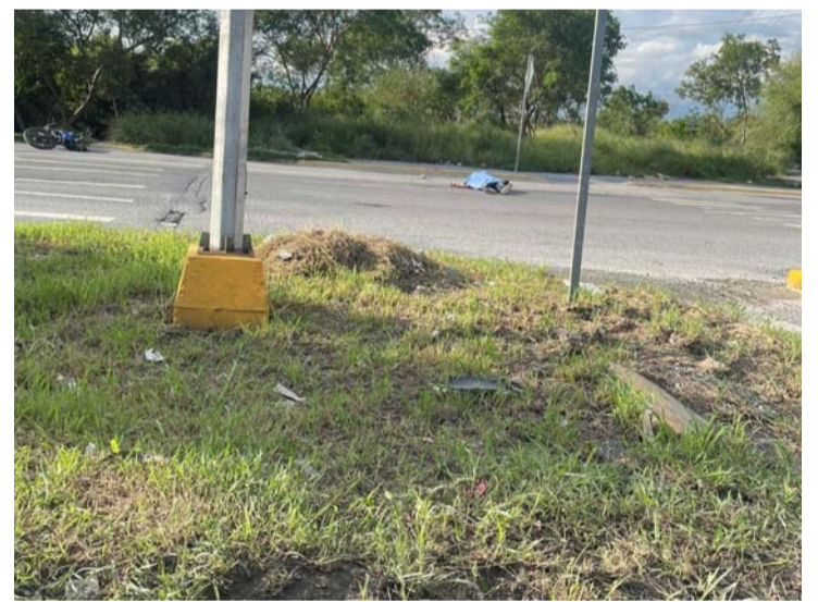
El casco de protección no fue suficiente.

Elementos de la Agencia Estatal de Investigaciones iniciaron las pesquisas de los hechos.