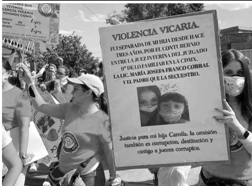
Denunciaron que en los últimos años han vivido en un entorno de impunidad y corrupción

El domingo, a la 1:00 de la tarde, las comisiones unidas de Puntos Constitucionales y Estudios Legislativos comenzarán la discusión del dictamen.