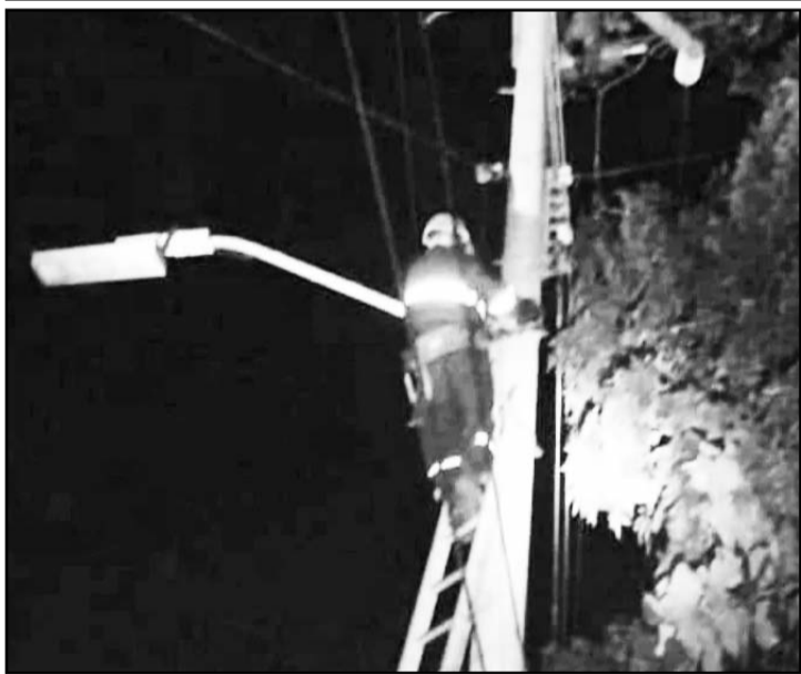
Las interrupciones en el suministro eléctrico han aumentado en los últimos días, afectando hasta un tercio del país.

Machado desde el año pasado protagonizó un fenómeno político que se comparó con el obtenido por Hugo Chávez en 1998, su primera victoria electoral, y que, según los cómputos de las actas que la oposición tiene en su poder, logró imponerse en los comicios del 28 de julio con el candidato Edmundo González Urrutia.