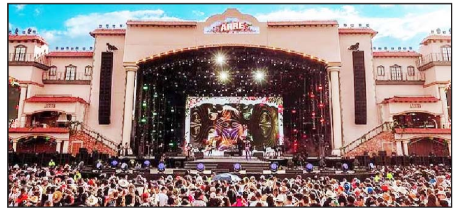
A pesar de la lluvia los asistentes disfrutaron de la música popera y norteña.

La disposición de los escenarios permitió que todos los fanáticos que acudieron a la celebración disfrutaran, muchos con sombrero, botas, y distintivos característicos de la música tradicional, disfrutando del festival iniciando con la pre-