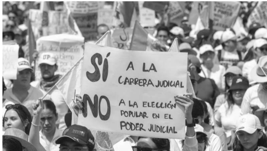
Marcha en contra de la reforma judicial se va a unificar; estudiantes, trabajadores y Frente Cívico

Guadalupe Acosta Naranjo, integrante del Frente Cívico Nacional adelantó a este diario, que la manifestación en contra de la reforma Judicial se va a unificar, la cual partirá del Ángel de la Independencia hacia el Senado, desde las 10 am.