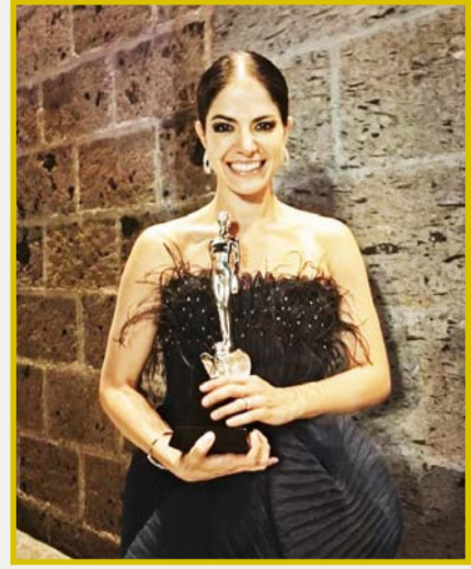
Adriana Llabrés se llevó la estatuilla por Mejor Actriz en 'Todo el silencio'.