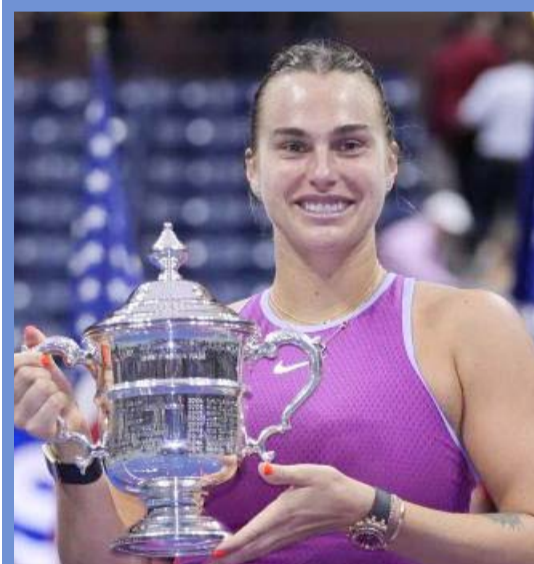
Aryna Sabalenka ganó su tercer grande.

La tenista rusa Aryna Sabalenka se coronó ayer en el Abierto de Estados Unidos tras vencer a la estadounidense Jessica Pegula por parciales de 7-5 y 7-5.