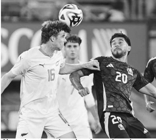
No quiere tres de seis, sino seis goles.