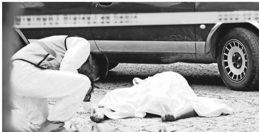
El pasado jueves es al momento el día más violento del mes con 81 víctimas de homicidio doloso

Apenas el pasado jueves, la ministra presidenta de la Corte, Norma Piña acudió a la manifestación de los trabajadores del Poder Judicial para mostrar que está en contra de la reforma, que será discutida este domingo en el Senado.