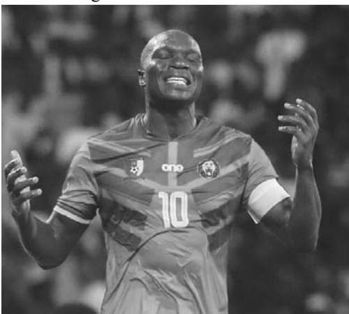
Camerún venció a Namibia por la mínima.

Nigeria superó en casa 3-0 a Benin y esto fue tras los tantos de Lookman al 47' y 83', además del gol de Osimhen al 78'.