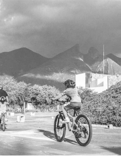
Un mejor entorno en la ciudad, el compromiso universitario.

De septiembre a octubre realizarán más jornadas del voluntariado en Sonora, Chihuahua, y Baja California, con la meta de plantar más de 11 mil 500 árboles durante 2024.