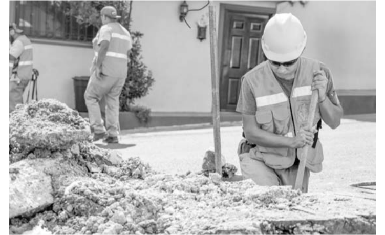
Habrà de esperar a que pasen las lluvias.