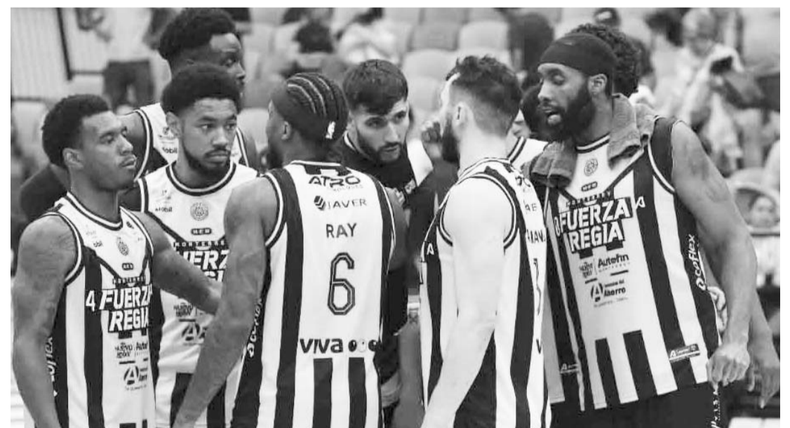
Los regios tienen hoy el segundo de la serie.

El juego dos de esta serie entre Fuerza Regia y Freseros de Irapuato será hoy, a las 16:00 horas y en el gimnasio Nuevo León Unido.