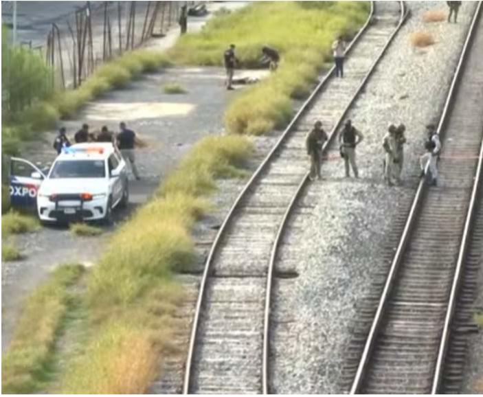
La ahora occisa no portaba alguna identificación entre sus pertenencias.