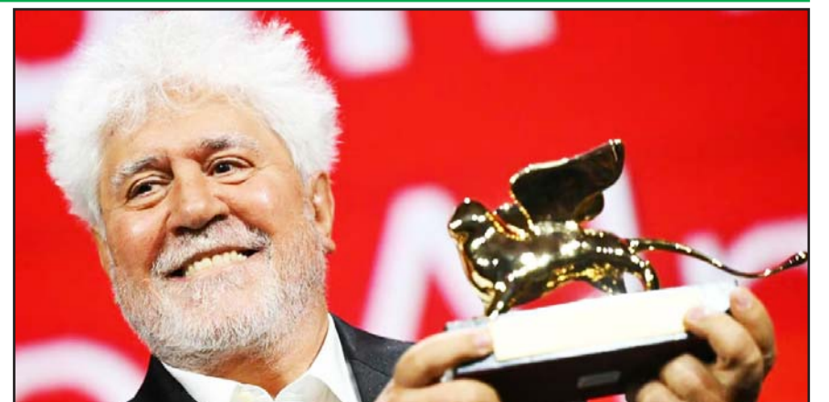
El cineasta español se llevó el premio en la 81 Muestra Internacional de Arte Cinematográfico por su película 'La habitación de al lado'.

El director aprovechó para reiterar su postura política, al declararse "optimista" porque cree que "lo peor que puede ocurrir es que la ultraderecha y el neoliberalismo vayan juntos y pidió estar atento a las próximas elecciones de EU.