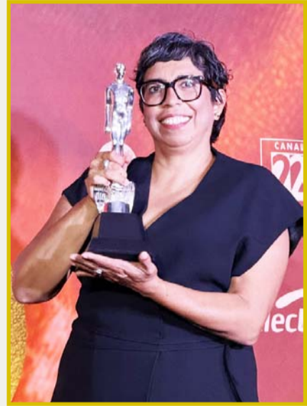
Tatiana Huezo recibió el Ariel por Mejor Largometraje Documental.