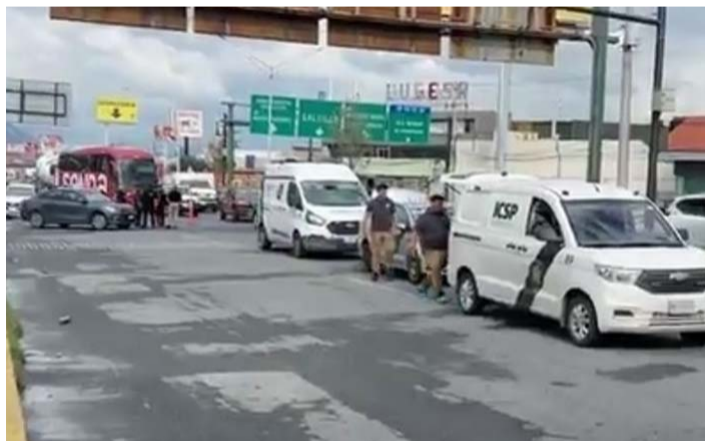
Aunque está identificado, se evitó revelar el nombre del agresor.

do cerca de las 05:00 horas de este sábado en el Boulevard Gustavo Díaz Ordaz, a la altura de la calle Padre Mier, en La Fama.