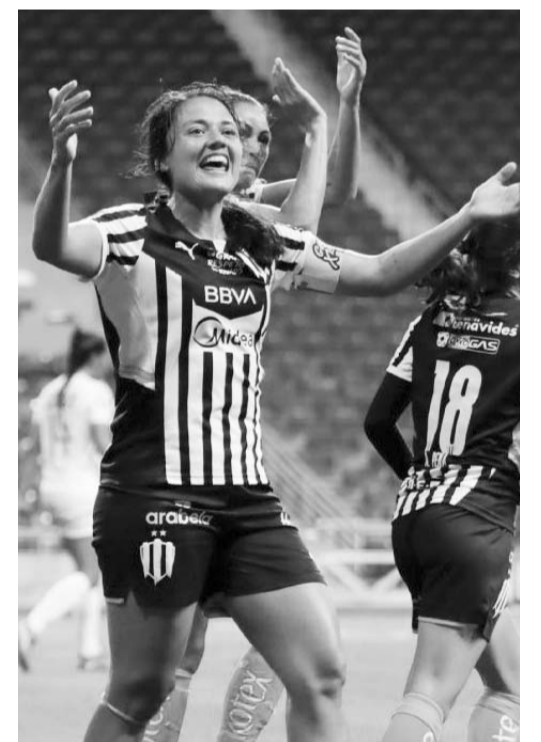
Monterrey recibe al Cruz Azul.