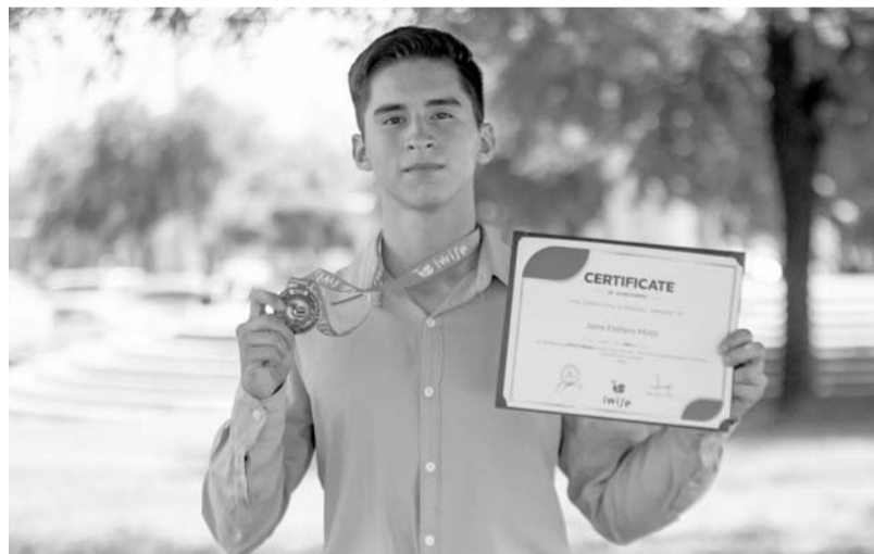
La competencia congregó a más de 200 participantes de todo el mundo

El estudiante de Ingeniería en Aeronáutica señaló sus deseos de trasladar este proyecto al mundo real. Indicó que, además de ser eficiente en el ahorro del combustible, este modelo ayu-