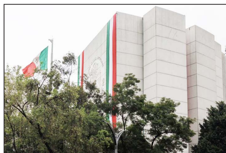
Las comisiones unidas del Senado convocaron para debatir la reforma al poder judicial.

número de ministros de la Suprema Corte de Justicia de la Nación (SCJN) y que su encargo pase de los 15 a los 12 años, además de dos elecciones para renovar los cargos del Poder Judicial, la primera de ellas extraordinaria, en junio de 2025 y una segunda en 2027.