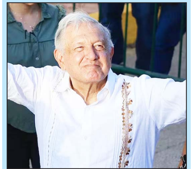
El presidente defendió el proyecto como un paso crucial para limpiar la corrupción.

Agregó que el llamado plan C no tiene una base de datos certera para lograr un fortalecimiento del Poder Judicial. Calificó la reforma como inconstitucional, pues no es procedente la elección de jueces por voto popular. "Lo mejor para el Estado mexicano es cómo ha funcionado desde 1994, donde se ha privilegiado el conocimiento con base a la carrera judicial. ¿Qué es la carrera judicial? Es prepararse, escalar a través del conocimiento", externó.