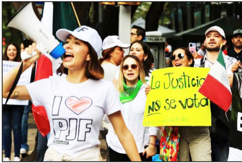
Empleados del PJF junto a ministros preparan marchas y protestas en las arterias principales de la Ciudad de México.

Dado que las comisiones unidas de Puntos Constitucionales y Estudios