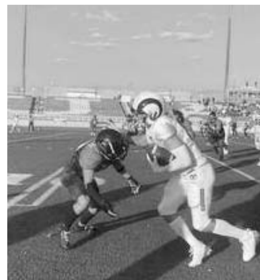
Borregos se impuso a la UACH.

Ahora la escuadra regia volverá a la actividad en la temporada regular de la Liga Mayor de la Onefa cuando el próximo 21 de septiembre sean visitantes ante las Águilas Blancas.