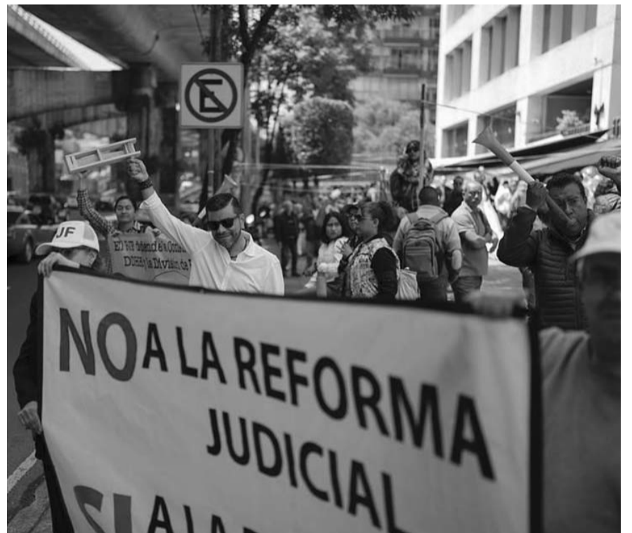
Aunque sí habrá manifestaciones, los trabajadores del Poder Judicial de la Federación (PJF) no entorpecerán las actividades legislativas.