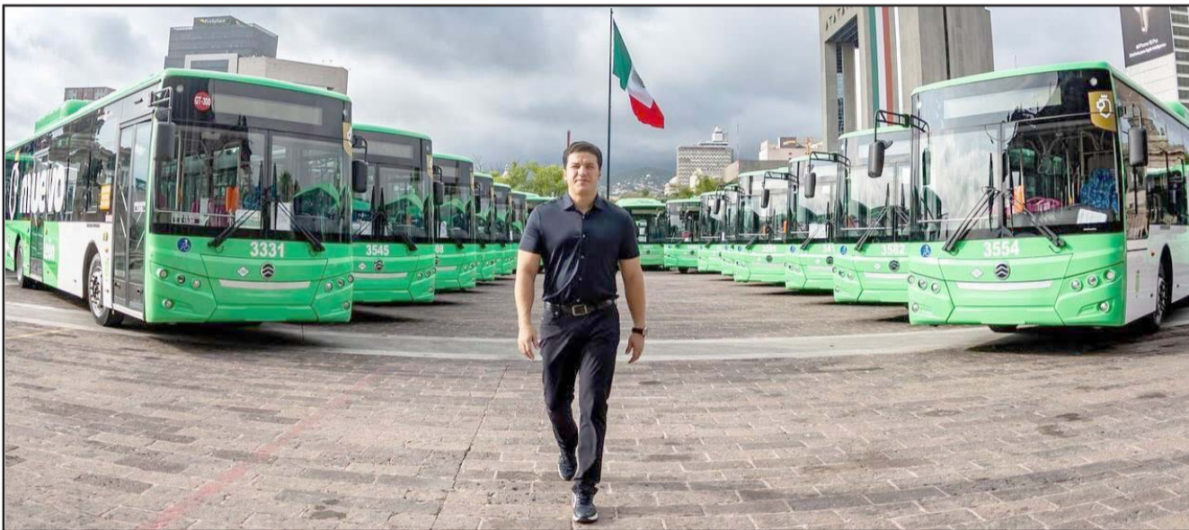
El gobernador mencionó que van por una cantidad similar para llegar a las 5 mil unidades de transporte público.

Una vez que el Túnel de la Loma Larga sea reabierto en su totalidad, las autoridades esperan que la vialidad vuelva a la normalidad.