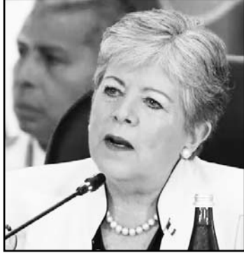
La canciller intervendrá en paneles del Foro Económico Mundial.

El presidente la vio y dio un paso a su izquierda, junto al gobernador de Veracruz mientras la botella caía al piso; el incidente no pasó a mayores.