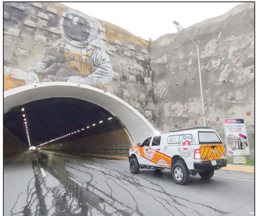
Hasta el momento están habilitados cinco de los seis carriles existentes.

Los desperfectos orillaron a las autoridades a realizar una ardua investigación y se determinó que aparentemente la humedad en el techo debido a las últimas lluvias registradas