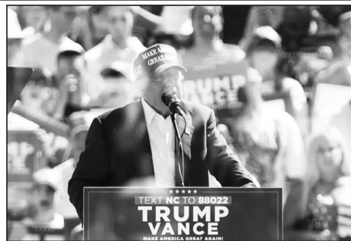
El republicano afirmó en una entrevista que no planea volver a postularse en caso de perder las elecciones presidenciales.

A pesar de estas limitaciones, algunos diplomáticos consideran que el Pacto para el Futuro es una oportunidad para reafirmar el compromiso con el multilateralismo en un contexto geopolítico complejo.