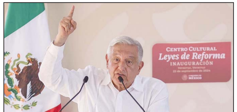
El mandatario saliente, aconsejó a sus compañeros de partido evitar la corrupción, el nepotismo y la soberbia.

"Concluye la primera etapa de la Cuarta Transformación y el presidente López Obrador va confiado a Palenque, a su merecido descanso y a seguir luchando, ahora, desde la escritura. Se va a Palenque tranquilo del deber cumplido y confiado que en el relevo generacional del movimiento está en manos de la Presidenta electa. Él no le falló al pueblo de México, nosotros tampoco podemos fallarle", dijo.