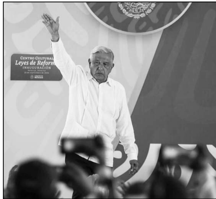
El jefe del Ejecutivo se despidió de los jarochos, elogiando Sheinbaum como la "mejor presidenta del mundo".

En su mensaje, el Presidente también se despidió de sus adversarios los conservadores, porque la oposición a su gobierno no ha pasado de calumnias, mentiras, guerra sucia e insultos, "hasta ahí