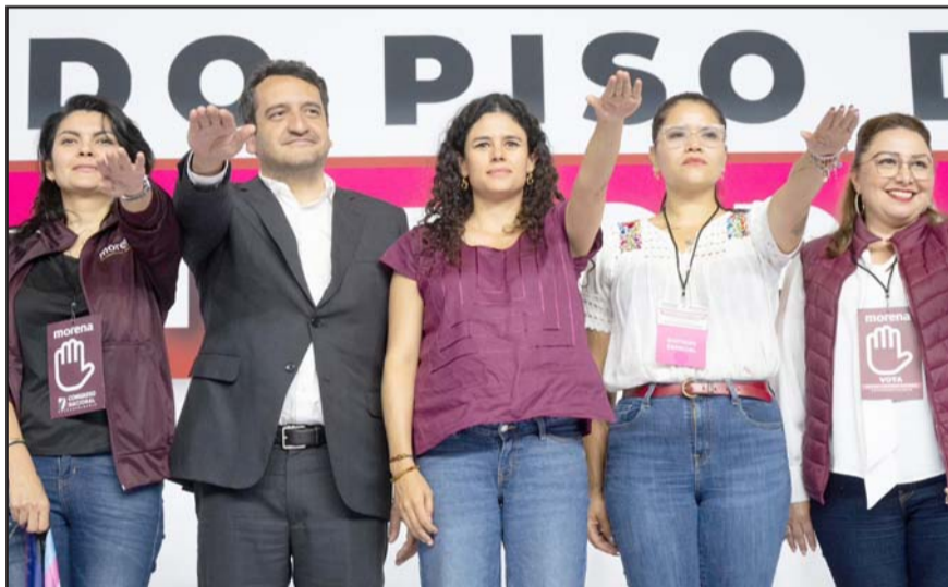
Al evento acudió la presidenta electa, así como gobernadores, diputados, senadores y otros integrantes de Morena.

Por lo que de acuerdo con los Estatutos de Morena, Andrés Manuel López Beltrán estará a cargo del Padrón Nacional de Protagonistas del Cambio Verdadero, constituido con las afiliaciones de los militantes; él deberá organizar, resguardar y depurar el mismo.