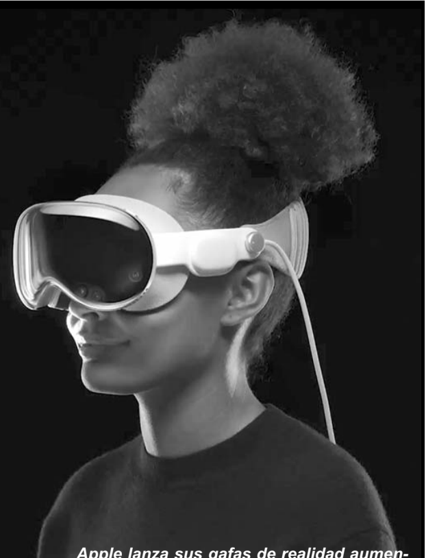
Apple lanza sus gafas de realidad aumentada, su primer gran proyecto desde 2014

Esta nueva generación de Spectacles, sin embargo, no saldrá a la venta. Snapchat las ofrecerá sólo a desarrolladores de aplicaciones de realidad aumentada, que podrán alquilarlas durante un año por unos 99 euros al mes. La idea es que los desarrolladores comiencen a desarrollar las aplicaciones y experiencias que será posible disfrutar en modelos comerciales que llegarán al mercado en los próximos años.