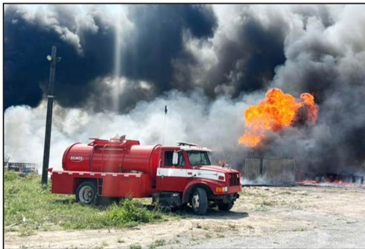
La columna de humo era visible a decenas de kilómetros.

Los efectivos se trasladaron a General Terán entrevistando a los familiares.