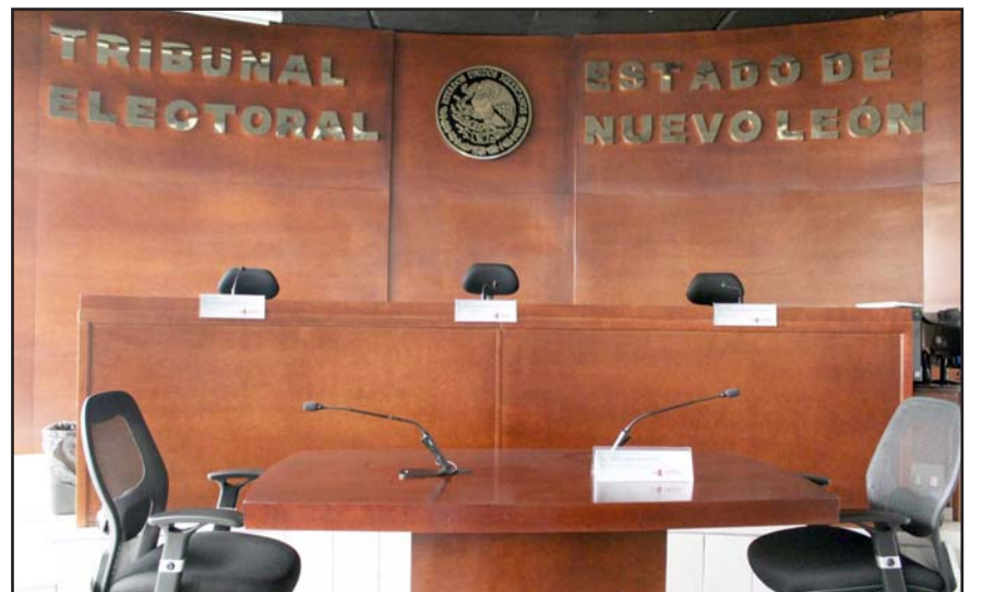
El motivo que dieron es por su intervención en temas de índole electoral.

Conforme a lo anterior, el Tribunal Electoral exhortó a las autoridades a que se conduzcan con apego a la Constitución Política de los Estados Unidos Mexicanos y a la Constitución Política del Estado Libre y Soberano de Nuevo León, a fin de evitar lesionar el estado de derecho y la credibilidad de las instituciones públicas.