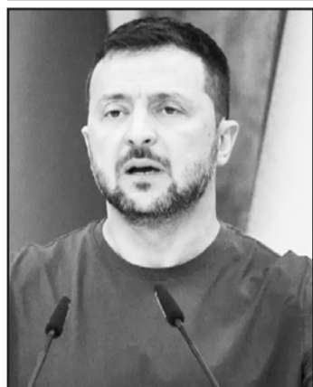
El mandatario ucraniano confía en que las acciones cambiarían el rumbo de la guerra.

Aunque muchos republicanos se han vuelto escépticos sobre las vacunas, Trump defendió su importancia y declaró que continuarán los estudios para garantizar su seguridad.