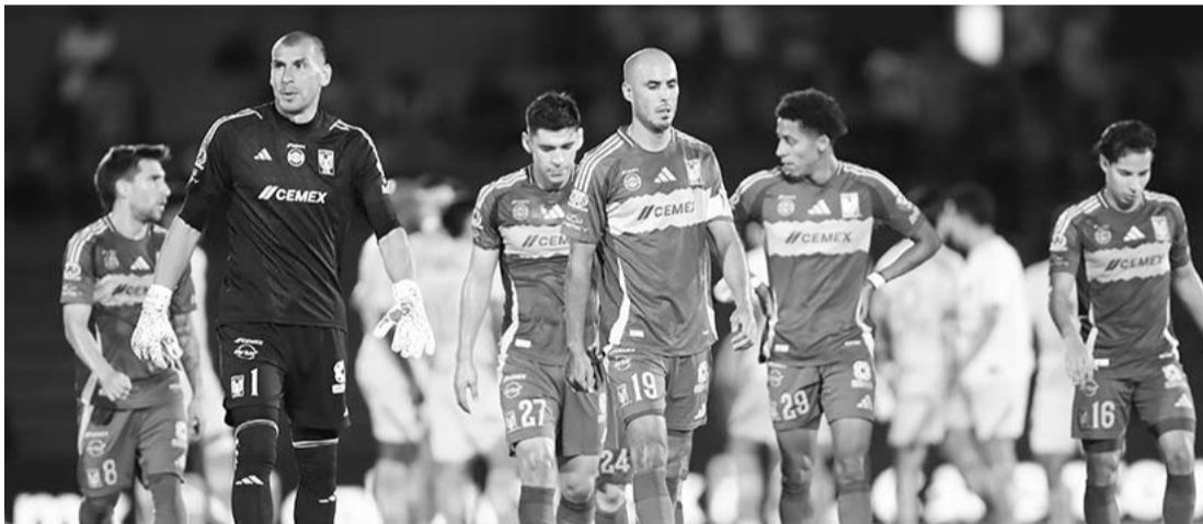
Los Tigres erraron algunas oportunidades que no dejaron contento a su estratega.