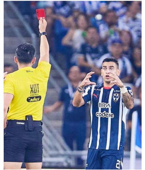
Vegas no daba crédito a lo sucedido.