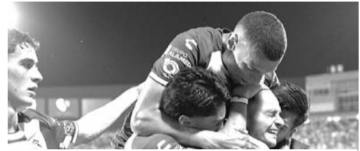
Toluca se quedó en las 18 unidades.

Santos dio la sorpresa y venció 2-0 en casa al cuadro del Toluca, en lo que fue uno de los últimos partidos de la fecha nueve en el Torneo Apertura 2024.