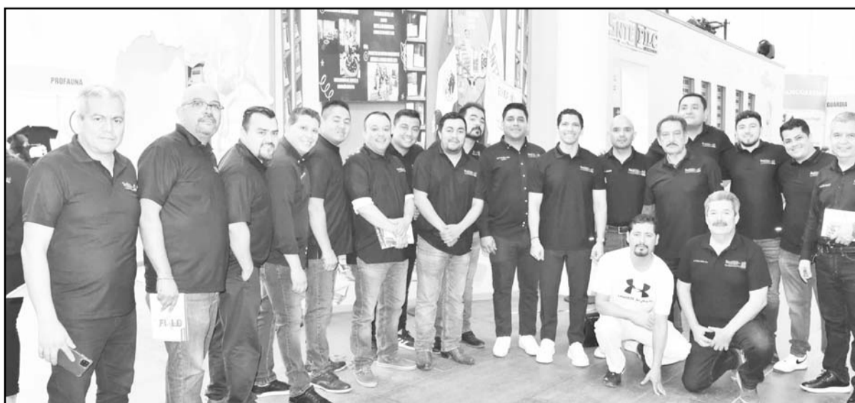
En esta ocasión le tocó a la escuela primaria ‘General Francisco Naranjo’ de la Región 12.

Esto lo dijo al llevar a cabo el pronunciamiento oficial cuando se entregaron los trabajos de remodelación de la cancha de fútbol de la mencionada escuela, con lo que se benefician decenas de