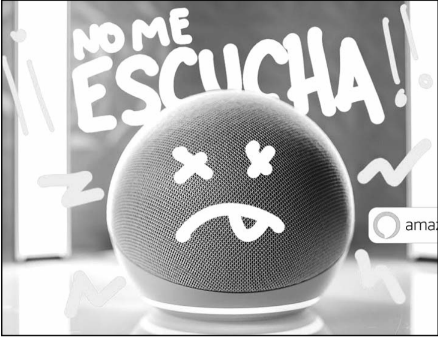
Una mala conexión a internet o la falta de actualizaciones son de los principales motivos que generan errores en los comandos de Alexa