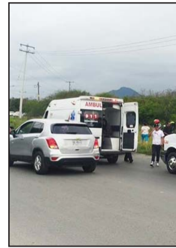
Desconocen cómo murió.

Indicaron que el desconocido estaba envuelto en una cobija tipo cobertor color azul marino, que se cree la utilizaba para protegerse de las inclemencias del clima.