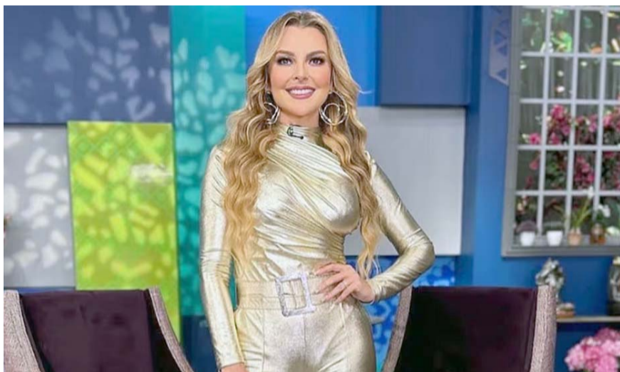
La operación tuvo lugar en la ciudad de Barranquilla, Colombia, donde pasó 16 días en plena recuperación.

"Hace unos meses decidí hacer esto, la verdad es de las mejores decisiones que pude tomar por mi salud, sentía mucho miedo", expresó la actriz en sus redes sociales.