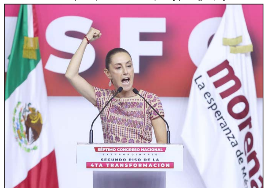
La presidenta electa, Claudia Sheinbaum hizo 10 peticiones a la nueva dirigencia de Morena.

"Recientemente, nuestros legisladores aprobaron la reforma judicial, que representa la construcción de un México más democrático y con acceso a la justicia, la separación del poder económico del poder de la justicia; está por aprobarse el reconocimiento pleno de los pueblos indígenas y afromexicanos; la Guardia Nacional y otras reformas que implican dejar atrás, muy atrás, el régimen de corrupción y privilegios", dijo.