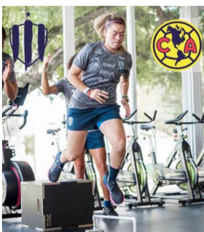
Monterrey debe ganar hoy.

Mientras tanto, las Águilas llegarán al duelo de hoy con un registro de cinco victorias, cuatro empates y una derrota para tener 19 unidades cosechadas luego de 10 cotejos.