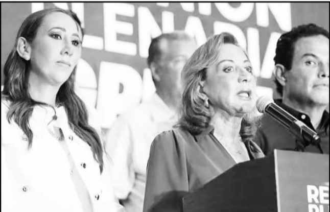
El partido criticó como irregular el cambio de sede durante la discusión en la Cámara de Diputados.

Además, sostendrá un encuentro con Antonio Guterres, secretario general de la ONU, donde abordará el tema sobre el cambio climático, el desarrollo sostenible y migración, dicho encuentro se llevará a cabo el próximo viernes.