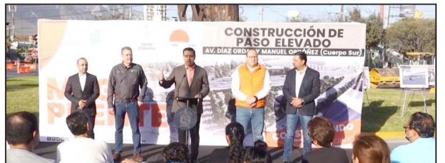
Su primera gestión terminará también con el ejercicio de mil mdp en obra pública.

Asimismo, Noah Itech (China) con 100 millones de dólares; Vertiv (Estados Unidos) con 100 millones de dólares; FAW CMM Master, con 25 millones de pesos.