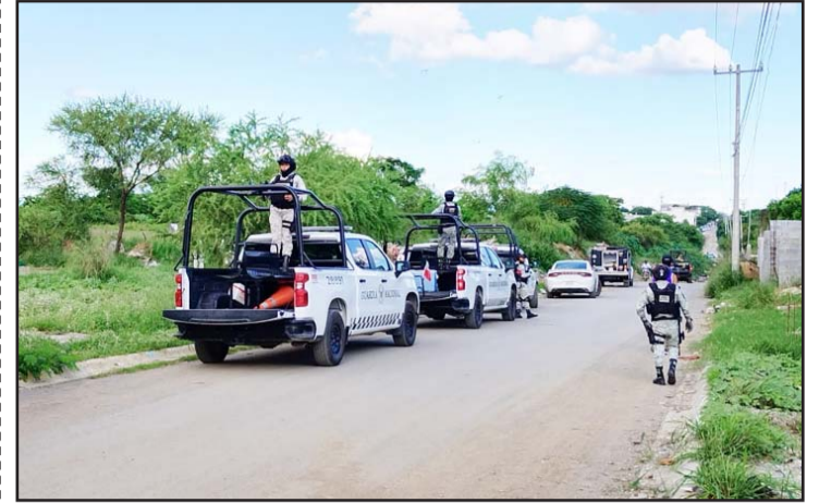
Se registró en el municipio de Juárez.

Cabe mencionar que en redes sociales mencionaron, que a la persona fallecida y que no ha sido identificado por las autoridades, ya habían pretendido ejecutarlo.