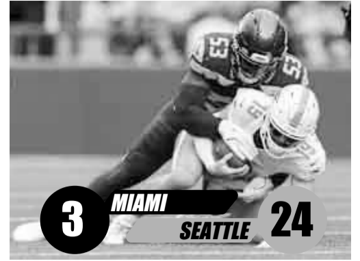
Los Delfines parecen dirigirse a una mala temporada.