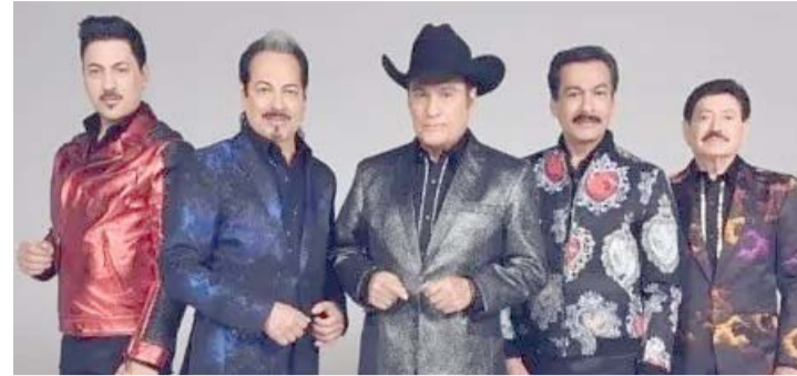
Ofrecieron una serie de conciertos en Colombia.