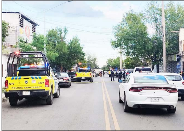
Ocurrió en un taller habilitado como templo cristiano.

Mientras que la mujer con heridas de bala fue llevada en una ambulancia a un hospital de