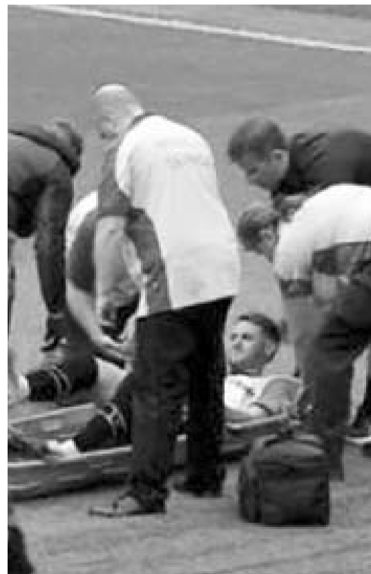
El jugador mexicano así dejó el juego.

Tras esta situación se espera que el mexicano vuelva pronto al país e imparta justicia en algún encuentro de la fecha 10 del Torneo Apertura 2024 que iniciará el próximo viernes.