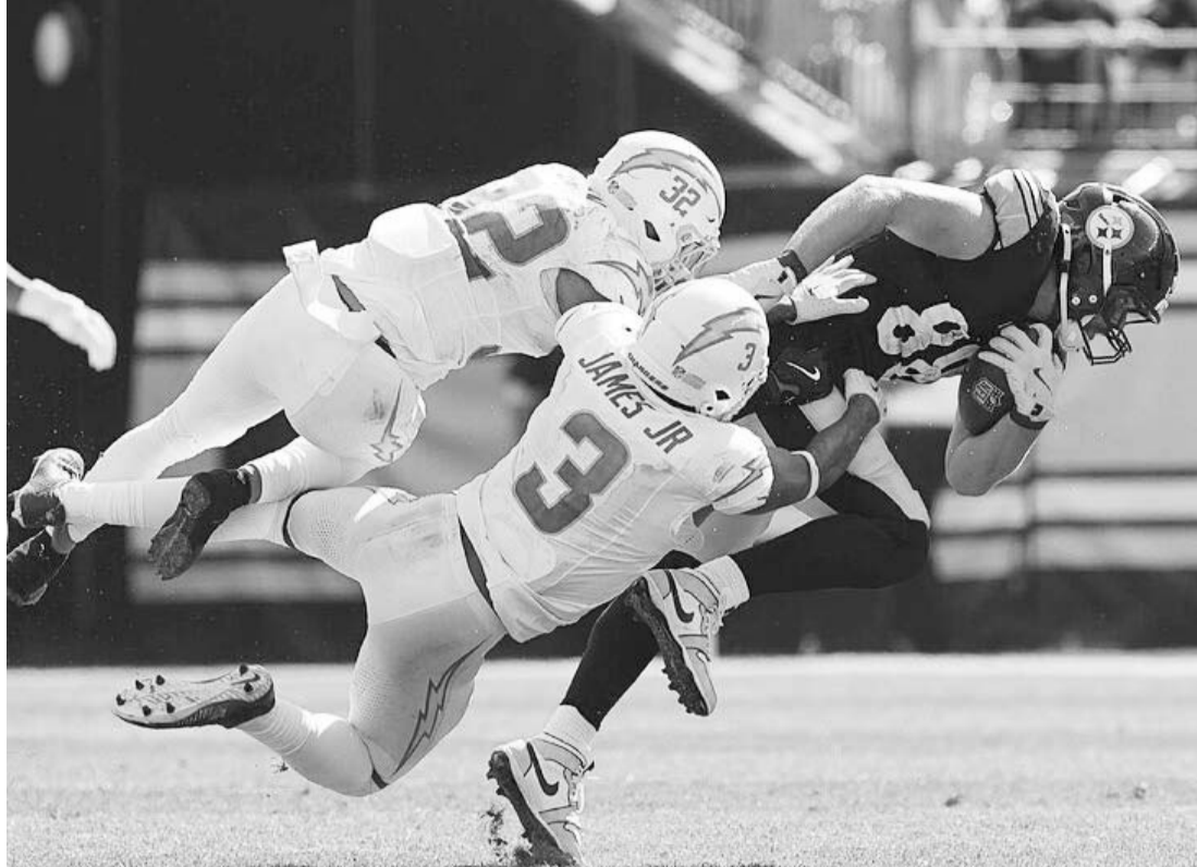
Espectacular el juego de los Acereros ayer ante Cargadores.

Por su parte, los Cargadores de Los Ángeles ahora tienen un récord de dos ganados por un perdido.