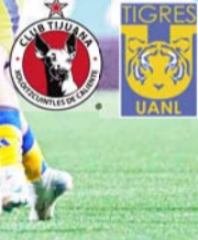
Las felinas ganaron en Tijuana.