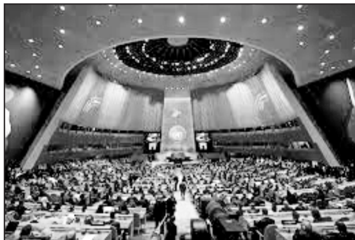
El Pacto contempla 56 acciones dirigidas a enfrentar problemas como la arquitectura financiera global.

El viceministro ruso, Serguéi Vershinin, expresó su descontento,