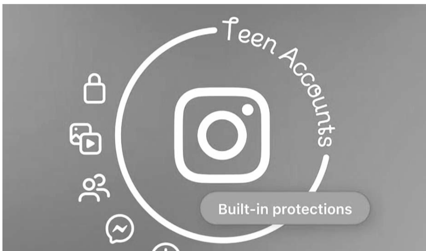
"Tienen protecciones integradas que limitan quién puede ponerse en contacto con ellos y el contenido que ven"

Para el resto del mundo, la iniciativa comenzará en enero del siguiente año.