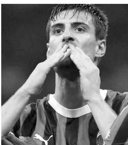
Milán venció al Inter.

El cuadro del Arsenal se quedó a solamente una jugada de ganar en Manchester y tomar el liderato, pero un gol de John Stones en la última jugada del encuentro hizo que los citizens igualaran en el estadio Etihad, lo que les bastó para seguir de líderes tras registrar 13 puntos de 15 posibles en la campaña.