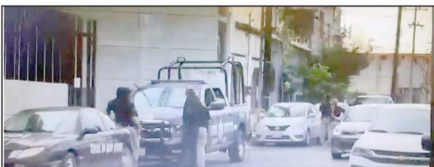
Dicen que hay un impedimento legal para sesionar sobre la Mesa Directiva del Congreso