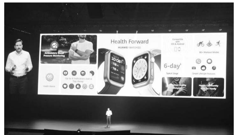
La marca con sede en China presentó cinco nuevos productos

Este dispositivo es el primer wearable de monitoreo ambulatorio de la presión arterial, el cual está certificado