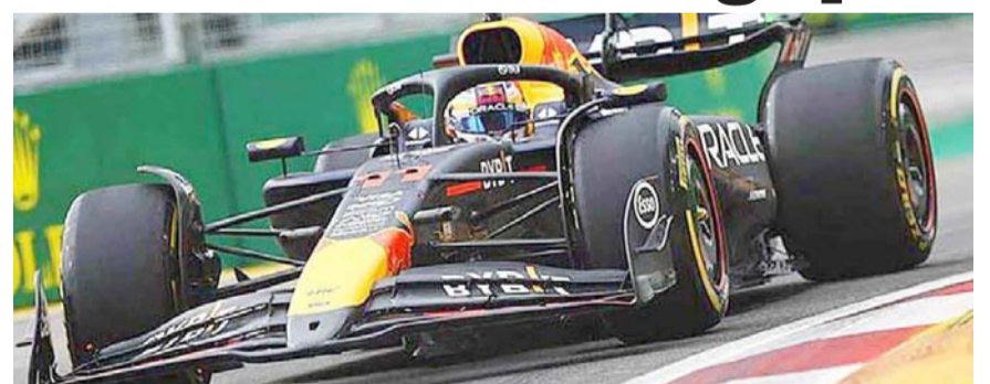
Sergio Pérez bajó a la octava posición en esa clasificación.

un noveno puesto en el Gran Premio de Singapur, aunque esto no sucedió ya que las condiciones de la pista y también el sobrecalentamiento de sus neumáticos le imposibilitaron el adelantar a Nico Hulkenberg de Haas en las últimas vueltas.