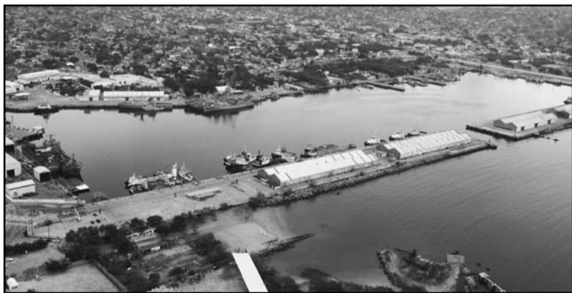
Se estima que el Corredor aportará un 2.65% al PIB del país, mientras que la inversión proyectada asciende a cinco billones de dólares.

A pesar de los incentivos fiscales que el gobierno ofrece a las empresas, las comunidades locales temen perder sus tierras y enfrentan un aumento de la especulación inmobiliaria, la violencia y el despojo.