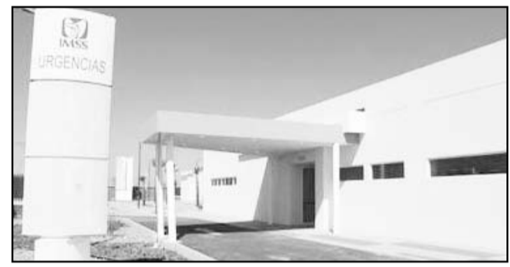
Se beneficiará a 564 mil 767 derechohabientes.