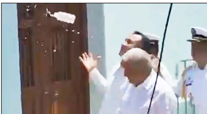
El jefe del Ejecutivo alcanzó a esquivar una botella que le fue lanzada desde donde se encontraban manifestantes del Poder Judicial.

Agradeció a sus compañeros del partido, quienes lo apoyaron como gobernante electo en 2018.