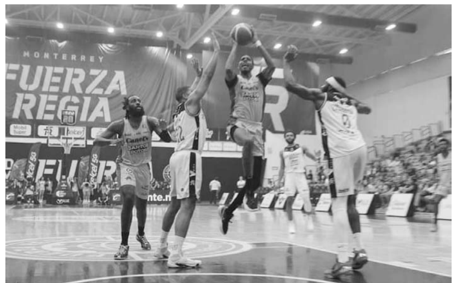
La escuadra local ganó ayer el segundo de la serie.

Tras esta situación, Fuerza Regia presenta una marca en esta temporada que es de 19 victorias por cuatro derrotas, y volverá a la actividad en la temporada regular de la LNBP cuando el próximo jueves y viernes tengan una serie de dos juegos en casa contra los Freseros de Guanajuato. (AC)