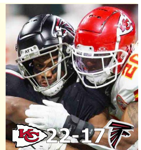
Jefes venció a los Halcones.