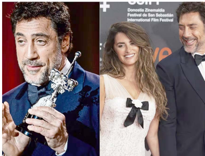
"Una mujer a la que amo y comparto una vida", dijo y luego se dio un momento para recuperar el aliento.

Ahora, espera que su experiencia sirva a aquellas mujeres con dudas y miedos, los mismos por los que pasó ella y que hoy ya están disipados, todo un paso desde la responsabilidad y el valor que le da a la vida y a la salud.