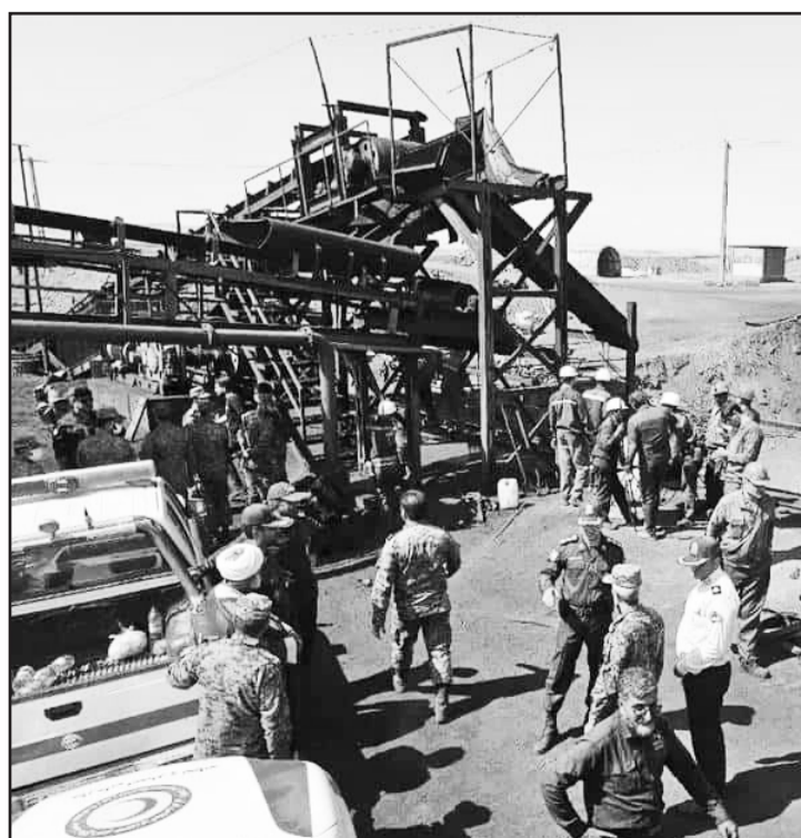
La explosión en la mina, provocada por una fuga de gas, dejó más de 50 muertos y 20 heridos.

Este trágico incidente recuerda otros accidentes en las minas de Irán. En 2017, una explosión en una mina de carbón en Azad Shahr, al norte del país, cobró la vida de 43 trabajadores, lo que provocó una fuerte indignación pública contra las autoridades.