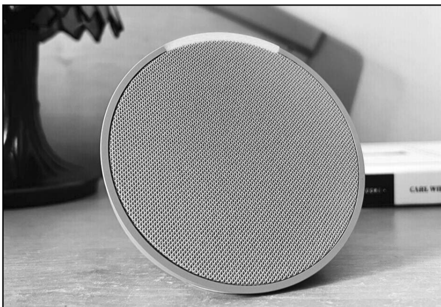
Si ya intentaste solucionar el problema de diversas formas y no obtienes un resultado positivo intenta reiniciar el dispositivo

Comprueba que los comandos estén configurados correctamente. Aunque también puede suceder que tu pronunciación no sea clara y esto puede ocasionar confusión en las instrucciones.